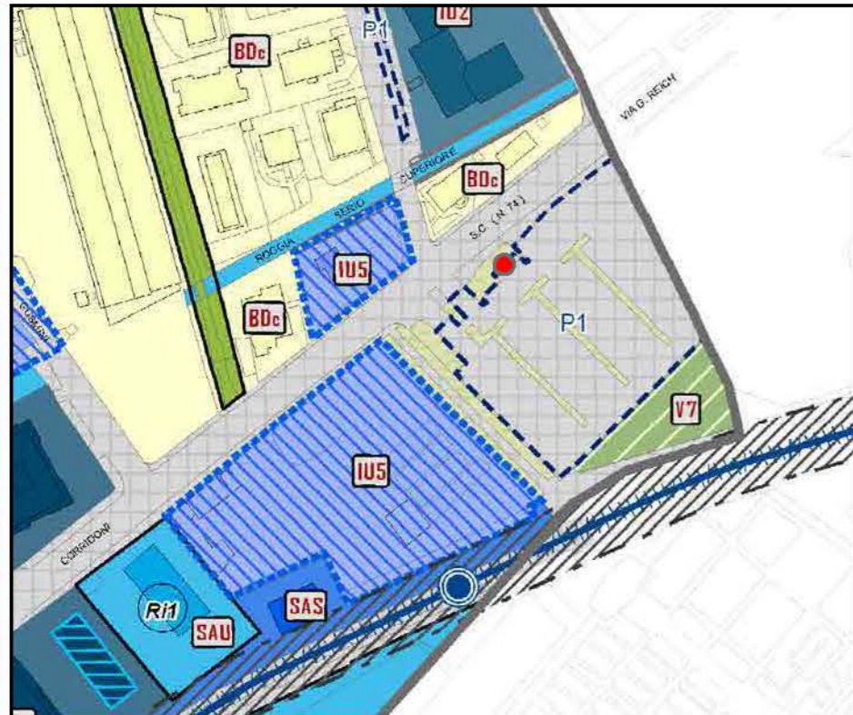
● Ipotesi di localizzazione nuovo chiosco Scala 1:2000

INQUADRAMENTO URBANISTICO: PR7 - PIANO DELLE REGOLE (PGT)