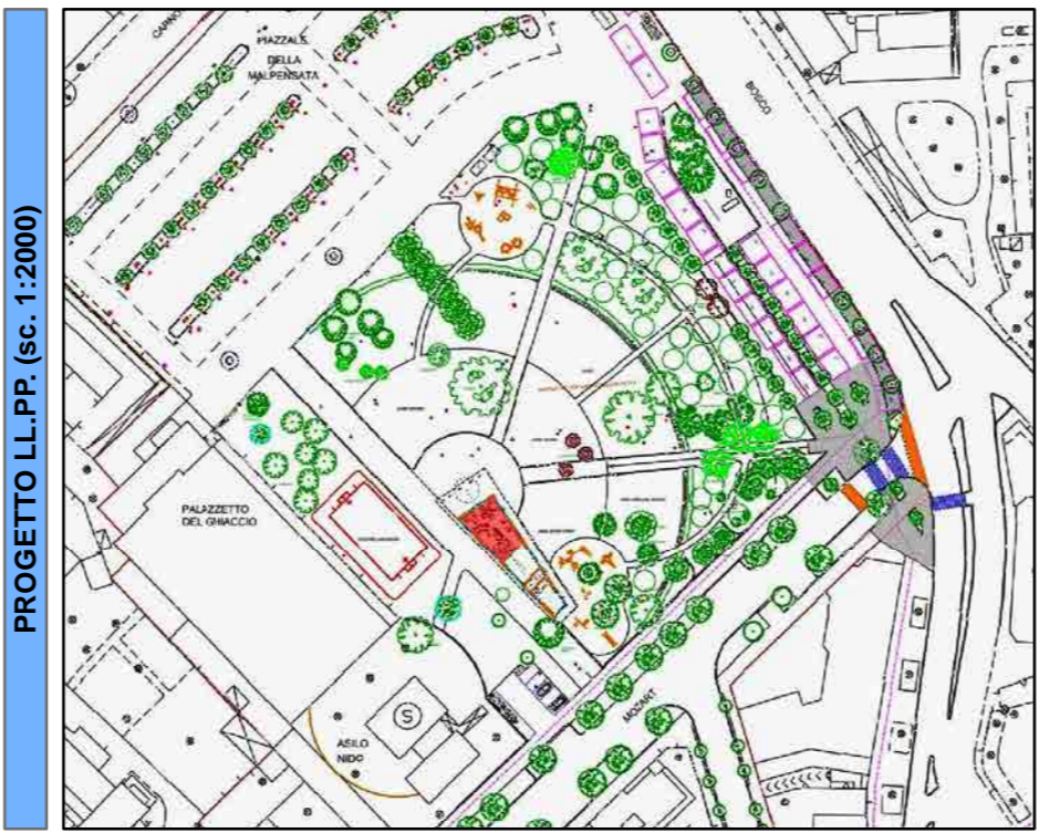
PROGETTO LL.PP. (sc. 1:2000)