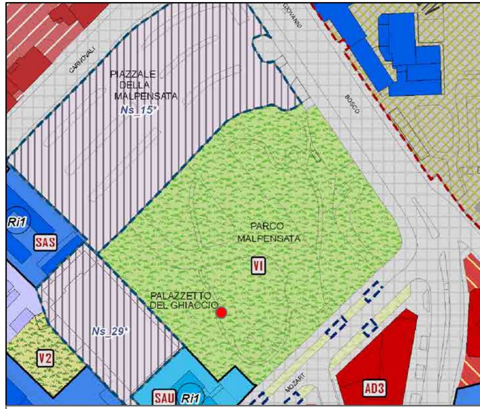
● Ipotesi di localizzazione nuovo chiosco Scala 1:2000

INQUADRAMENTO URBANISTICO: PR7 - PIANO DELLE REGOLE (PGT)