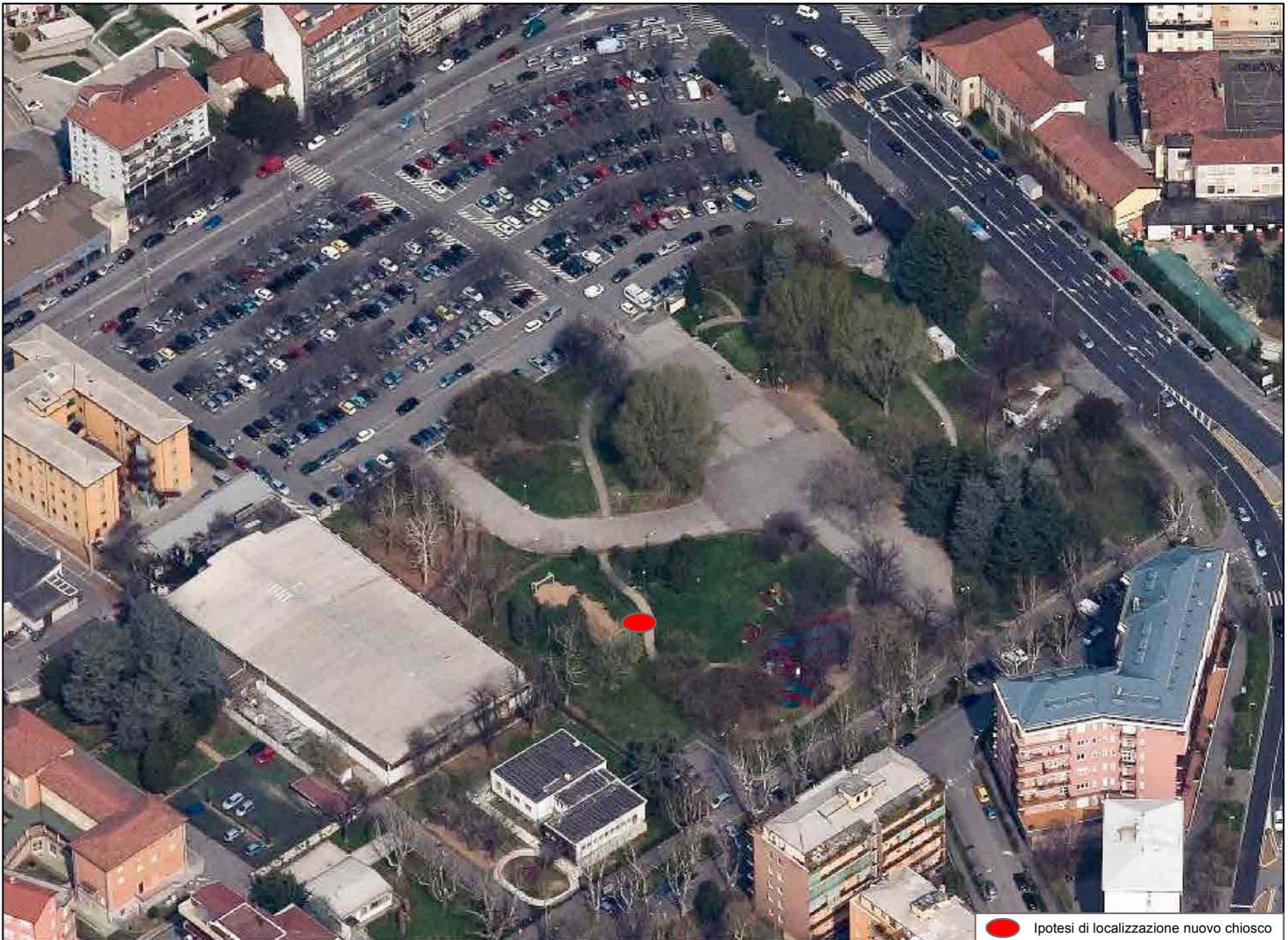
● Ipotesi di localizzazione nuovo chiosco

L'area può essere attrezzata per lo svolgimento di commercio al dettaglio, su area pubblica, di carattere temporaneo ai sensi dell'art.18.10 delle Norme del Piano dei Servizi.