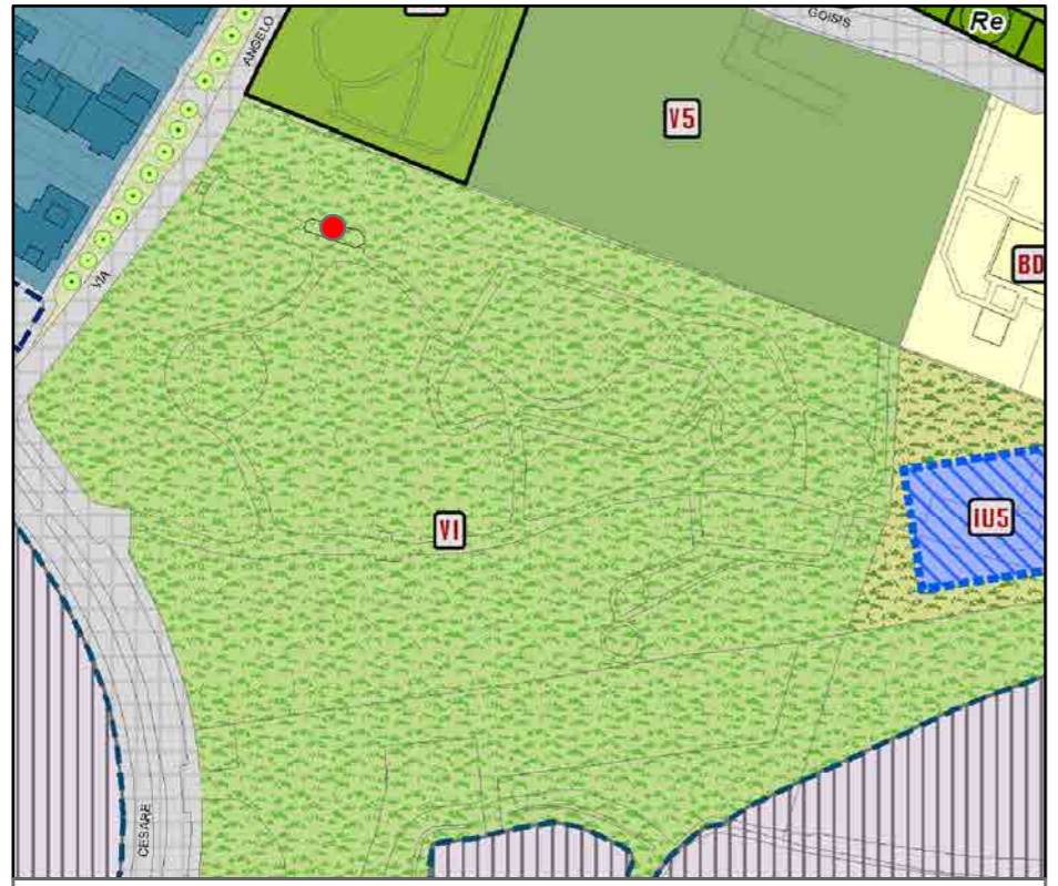
● Ipotesi di localizzazione nuovo chiosco Scala 1:2000

INQUADRAMENTO URBANISTICO: PR7 - PIANO DELLE REGOLE (PGT)