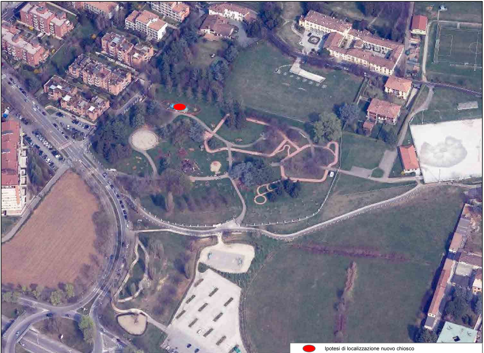
● Ipotesi di localizzazione nuovo chiosco

L'area può essere attrezzata per lo svolgimento di commercio al dettaglio, su area pubblica, di carattere temporaneo ai sensi dell'art.18.10 delle Norme del Piano dei Servizi.