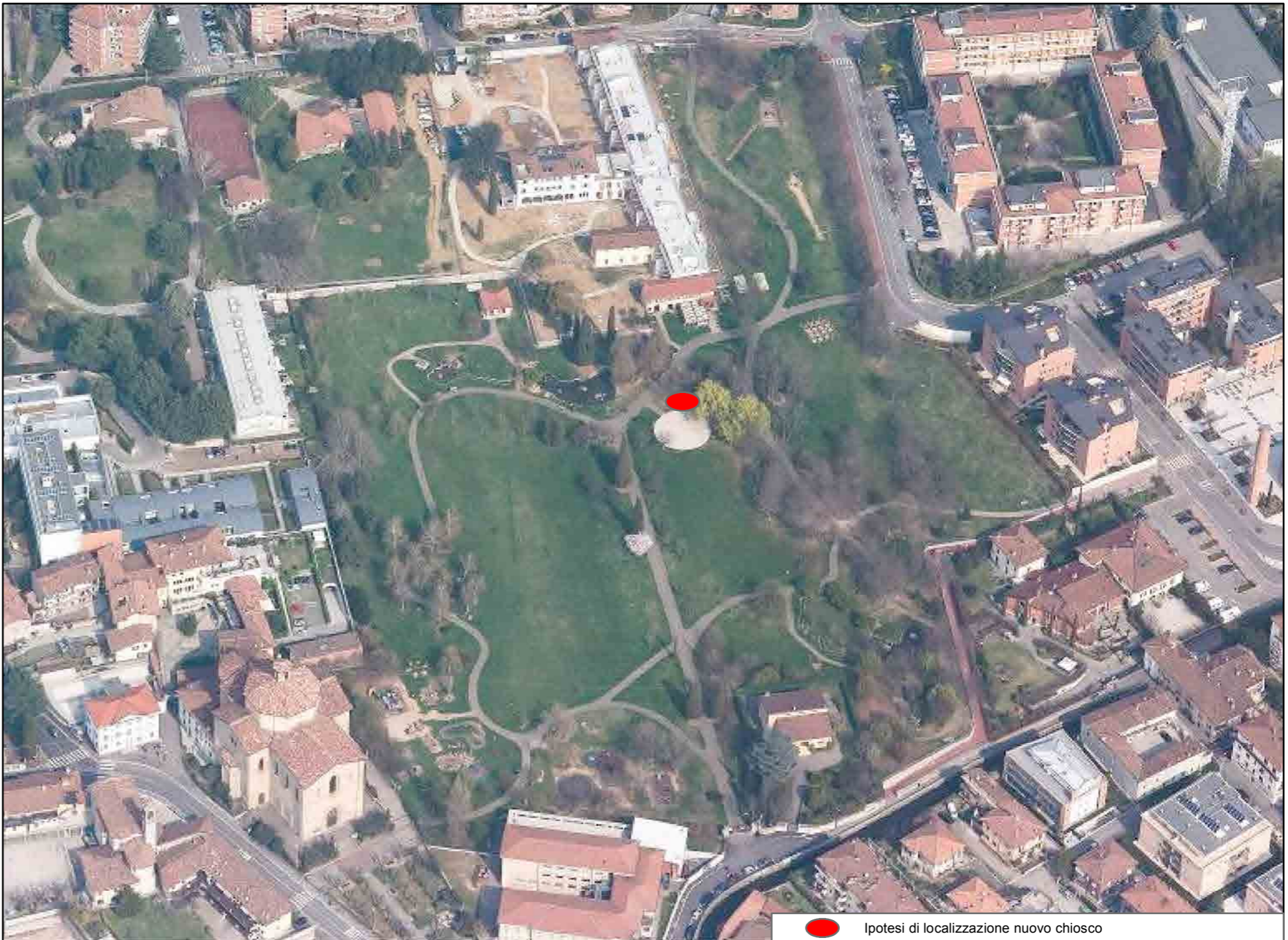
● Ipotesi di localizzazione nuovo chiosco

L'area può essere attrezzata per lo svolgimento di commercio al dettaglio, su area pubblica, di carattere temporaneo ai sensi dell'art.18.10 delle Norme del Piano dei Servizi.