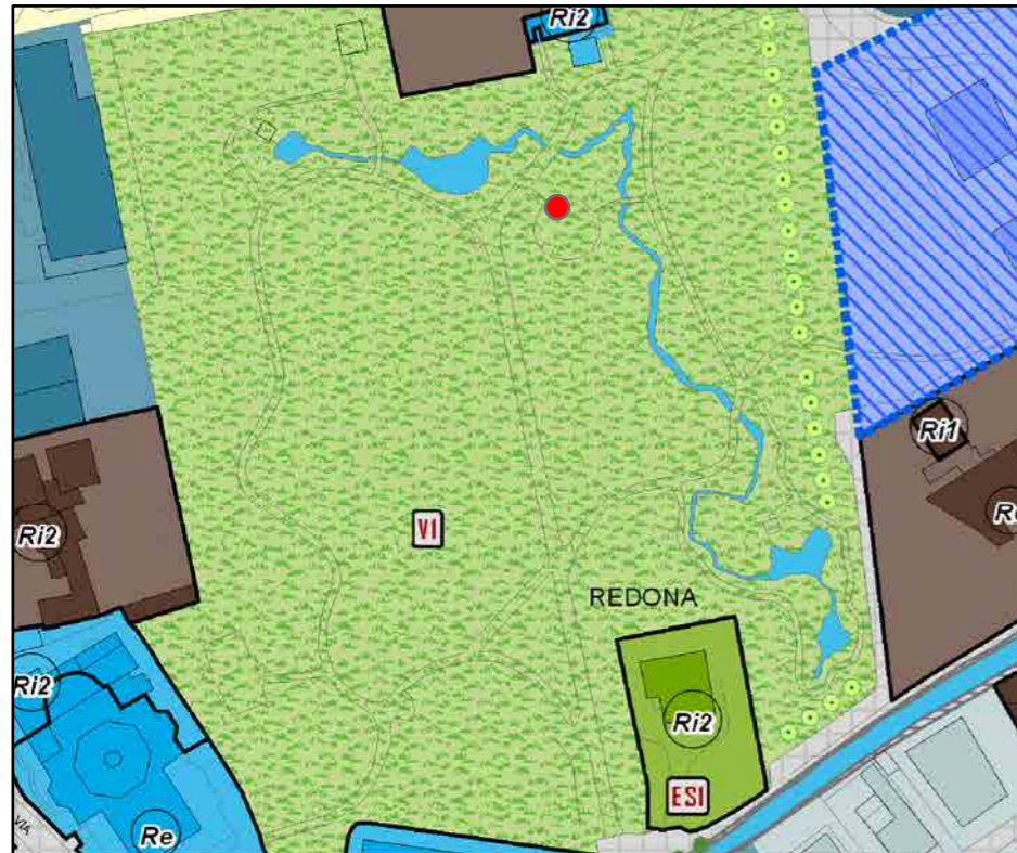
● Ipotesi di localizzazione nuovo chiosco Scala 1:2000

INQUADRAMENTO URBANISTICO: PR7 - PIANO DELLE REGOLE (PGT)