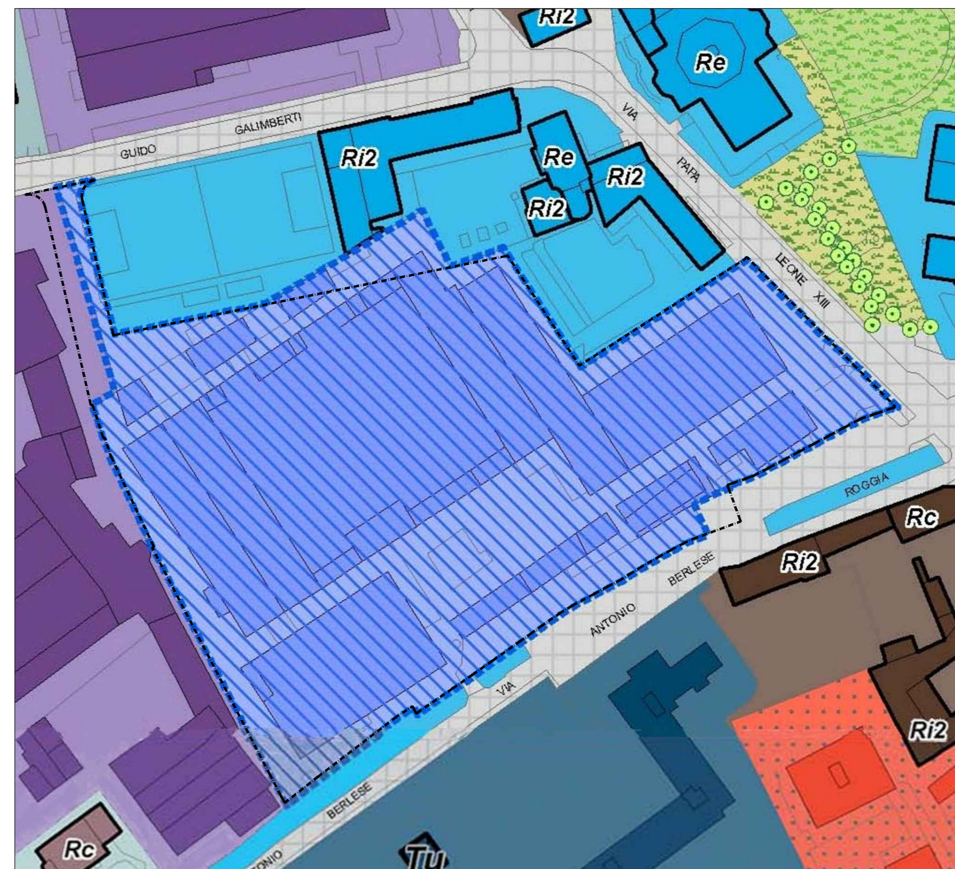
ESTRATTO P.G.T. SCALA 1:1000