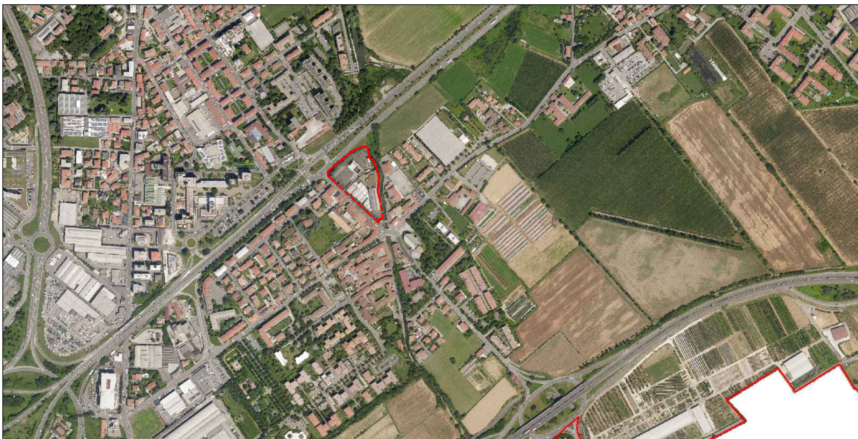
ORTOFOTO 2016 - SCALA 1:5000

Ambito Strategico At_e/10 EX MANGIMI MORETTI