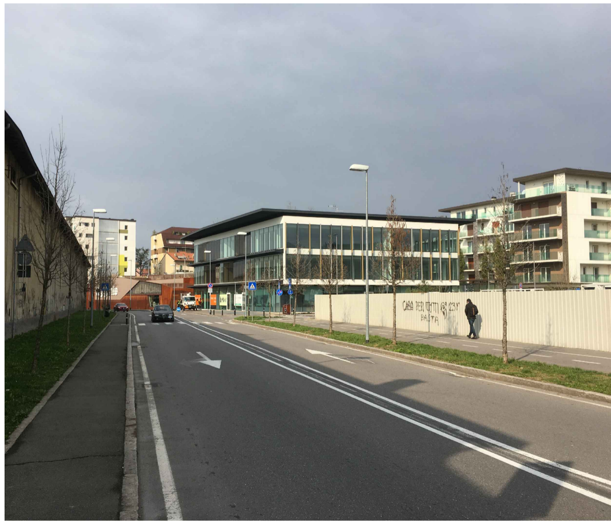
11_VISTA DA VIA BONO_LOTTO 01 E LOTTO 02