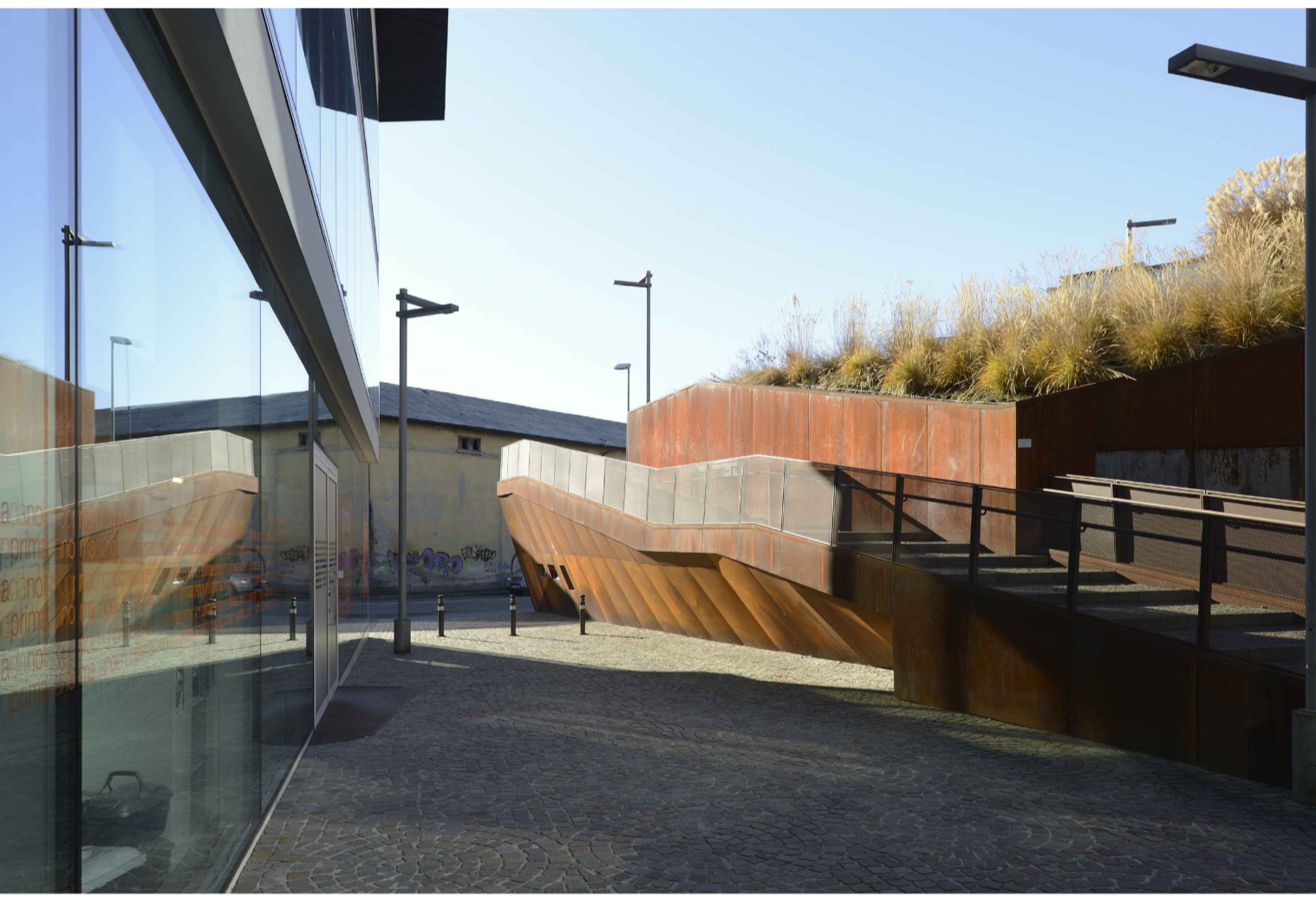
09_PIAZZA INTERNA_LOTTO 01