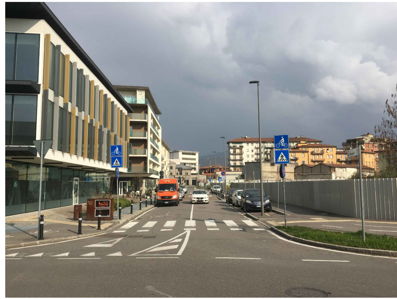
10_VISTA DA VIA BONO_LOTTO 01 E LOTTO 02