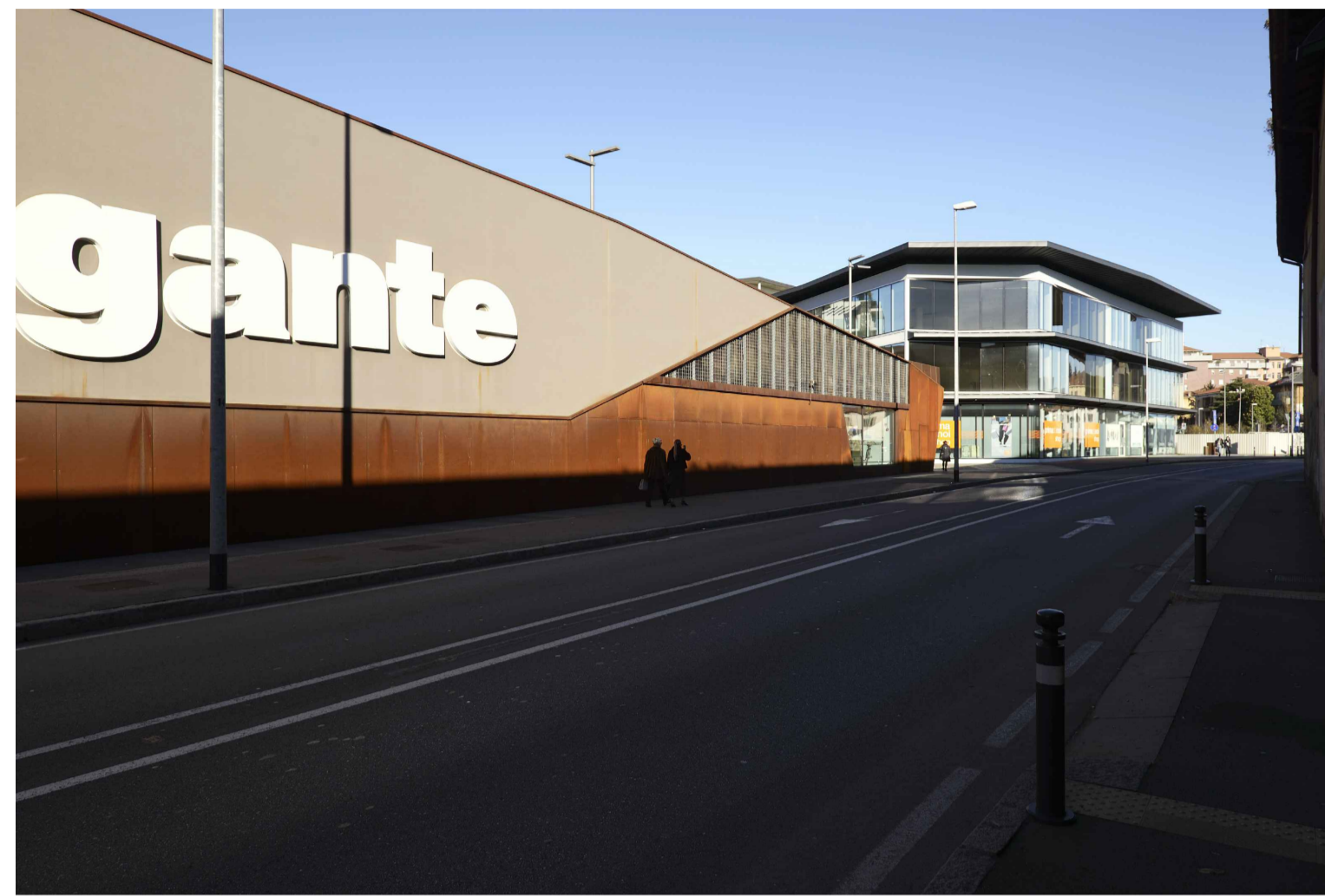
01_VIA BONO_LOTTO 1