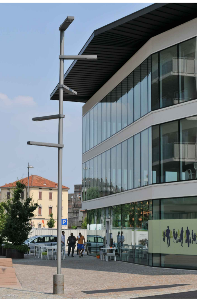
07_PIAZZA INTERNA_LOTTO 01