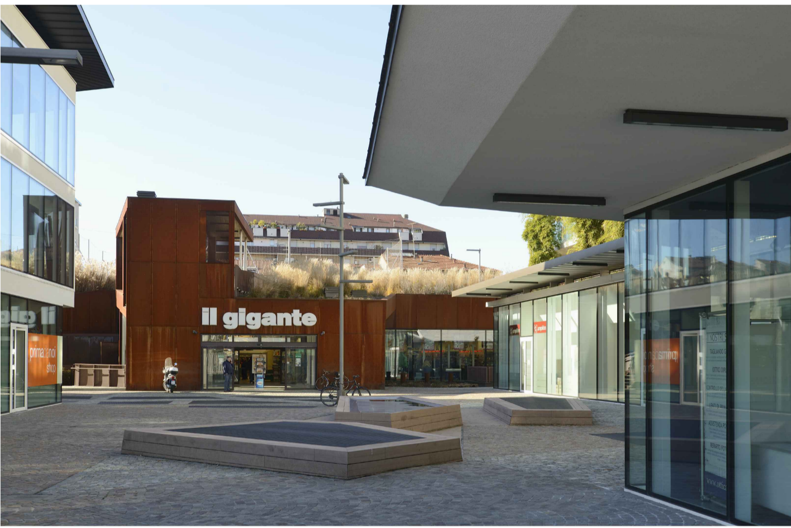
08_PIAZZA INTERNA_LOTTO 01