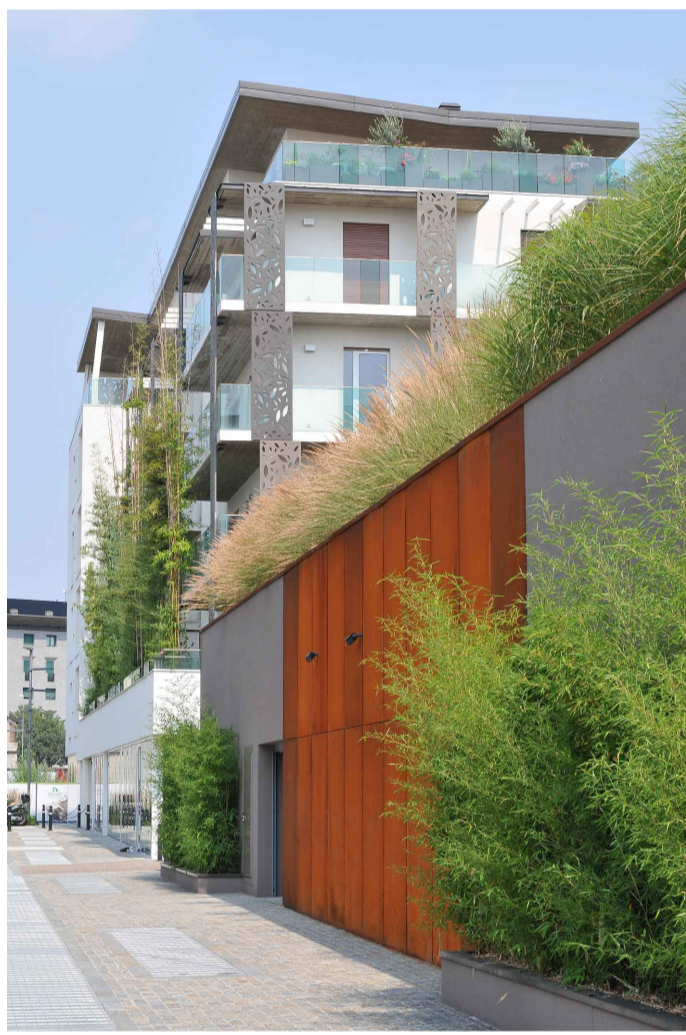
06_VIA MORETTI_LOTTO 01