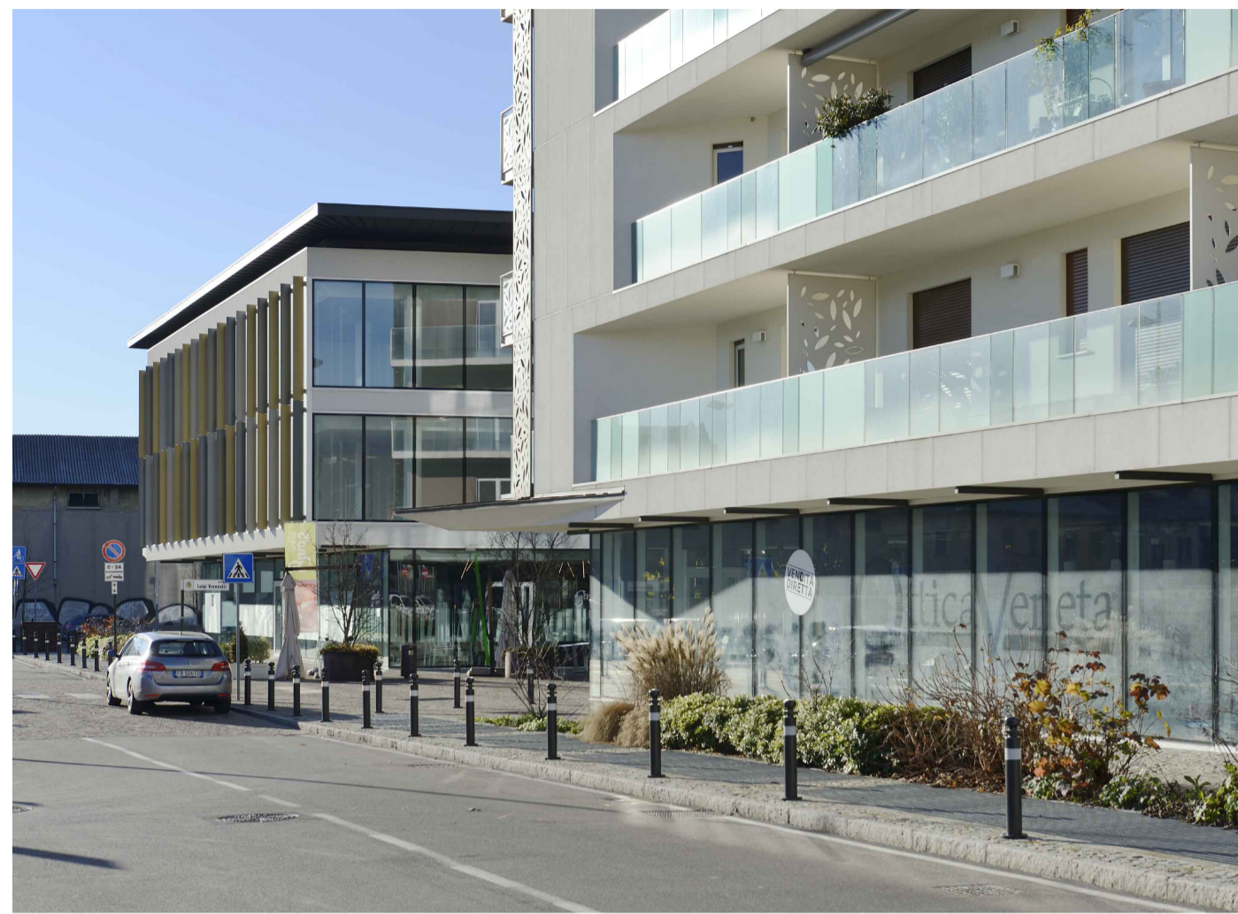
04_VIA MORETTI_LOTTO 01