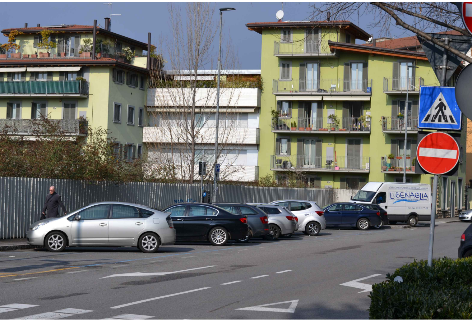
14_VISTA DA VIA PINAMONTE DA BREMBATE_LOTTO 02