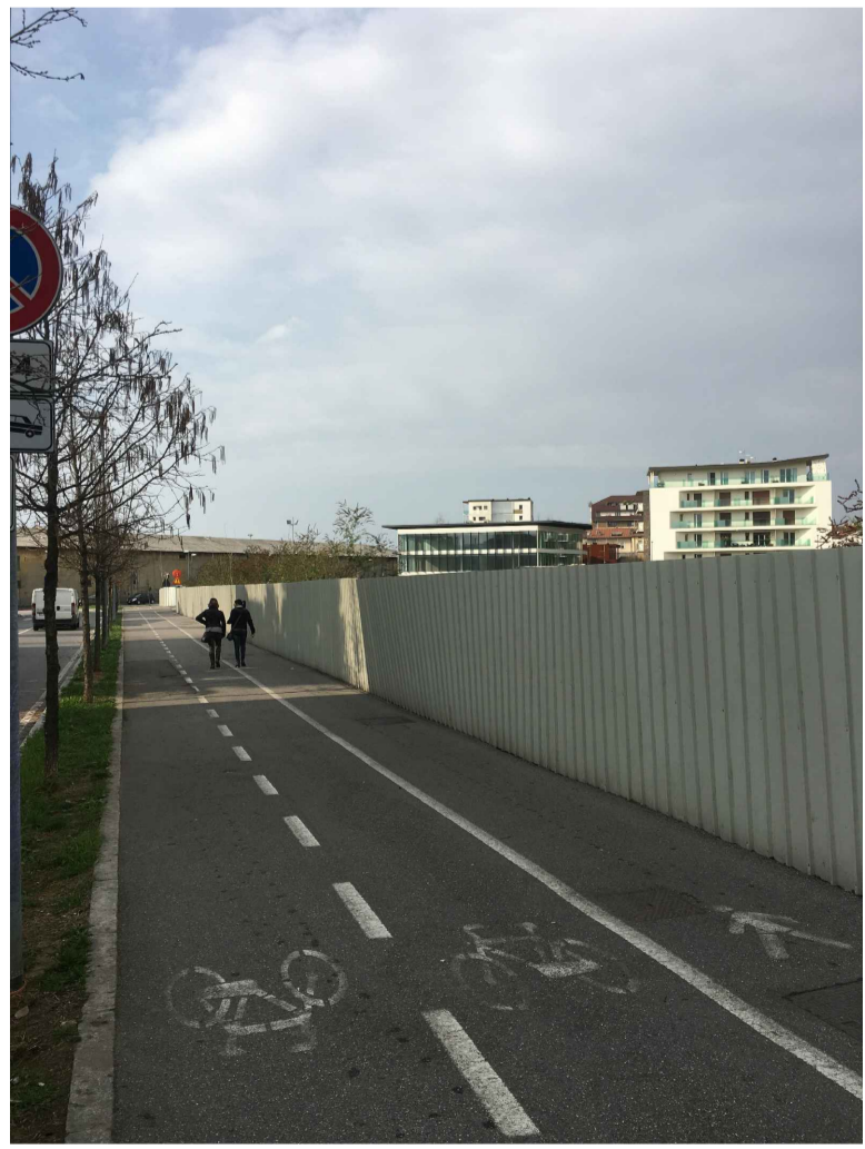
13_VISTA DA VIA BONO_LOTTO 02