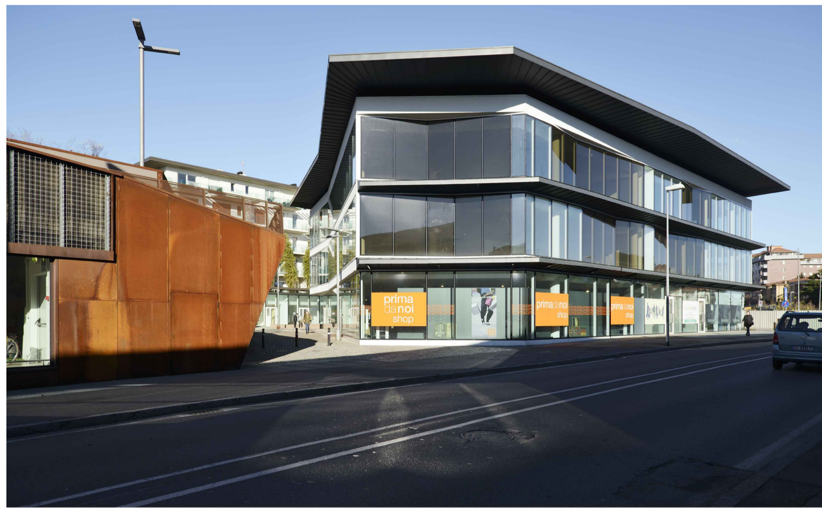
03_VIA BONO_LOTTO 01