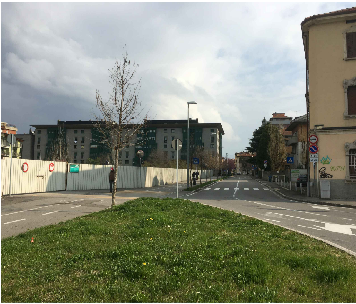
12_VISTA DA VIA BONO_LOTTO 02