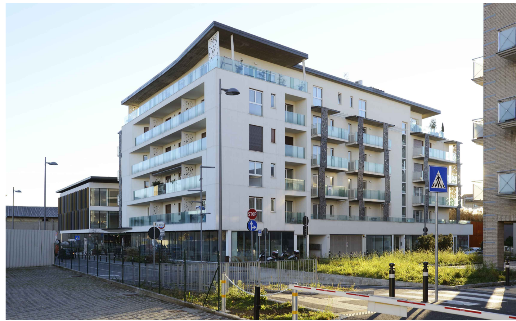
06_VIA MORETTI_LOTTO 01