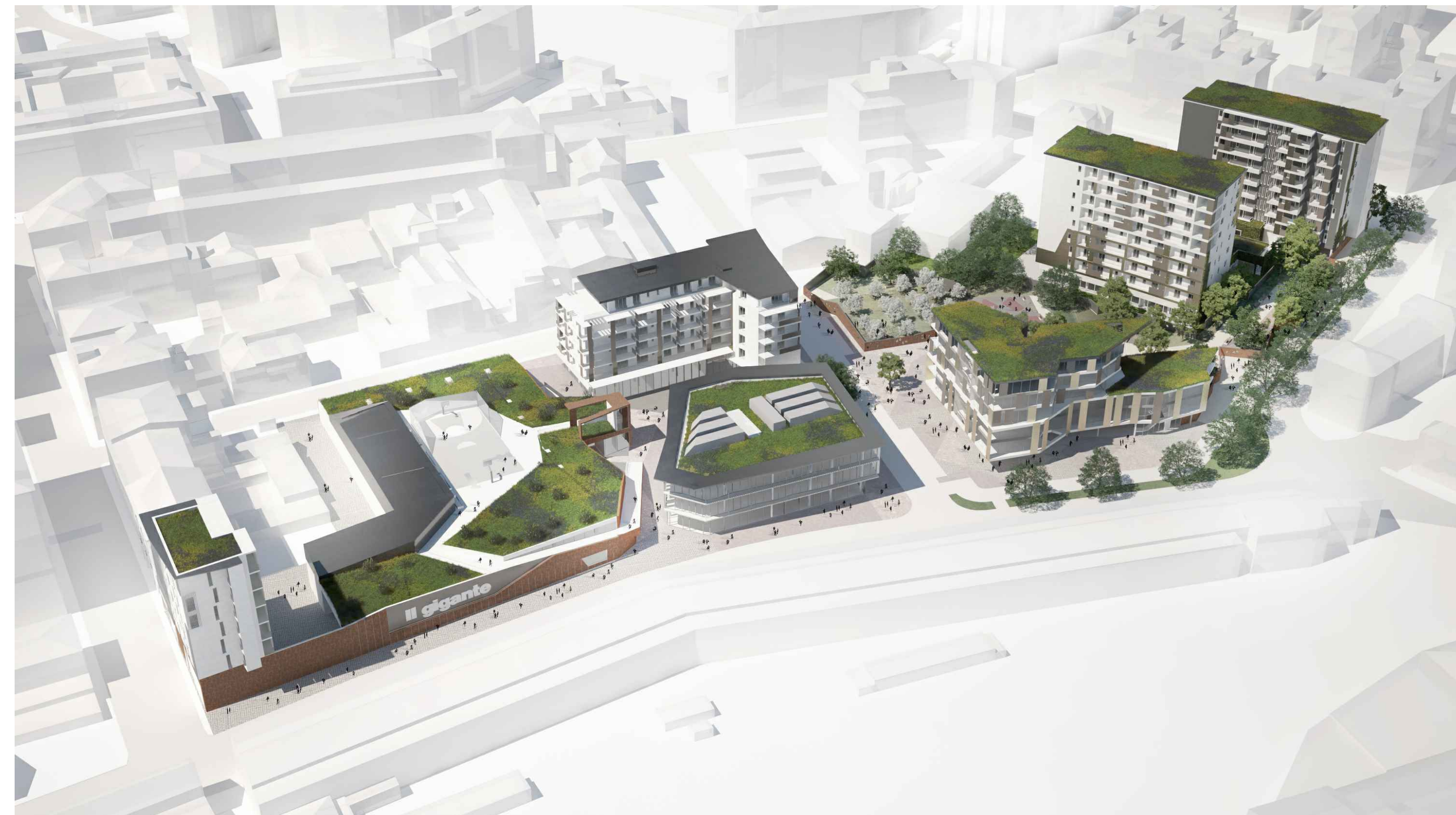
04_VISTA AEREA SUD-OVEST