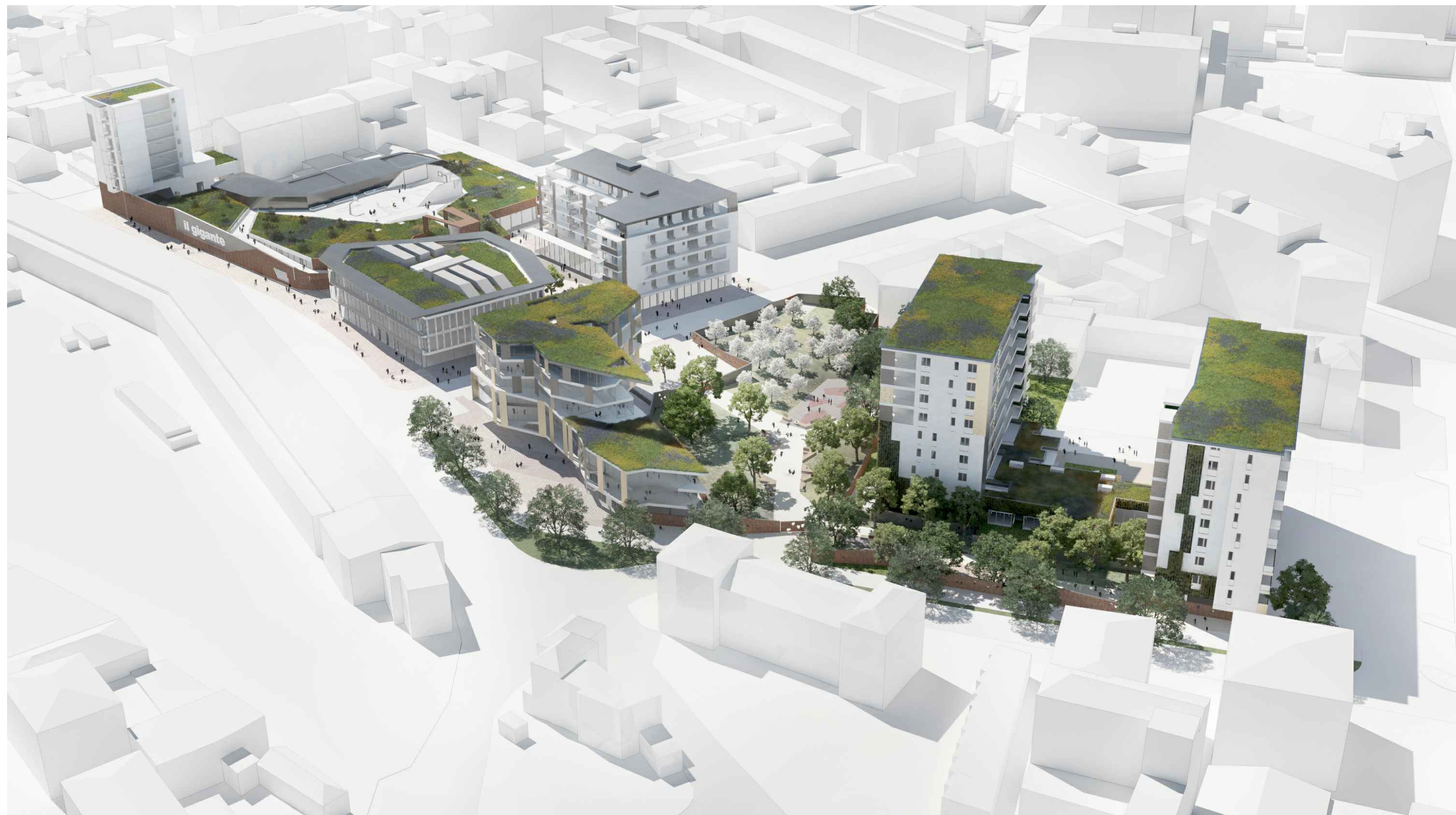
03_VISTA AEREA SUD-EST