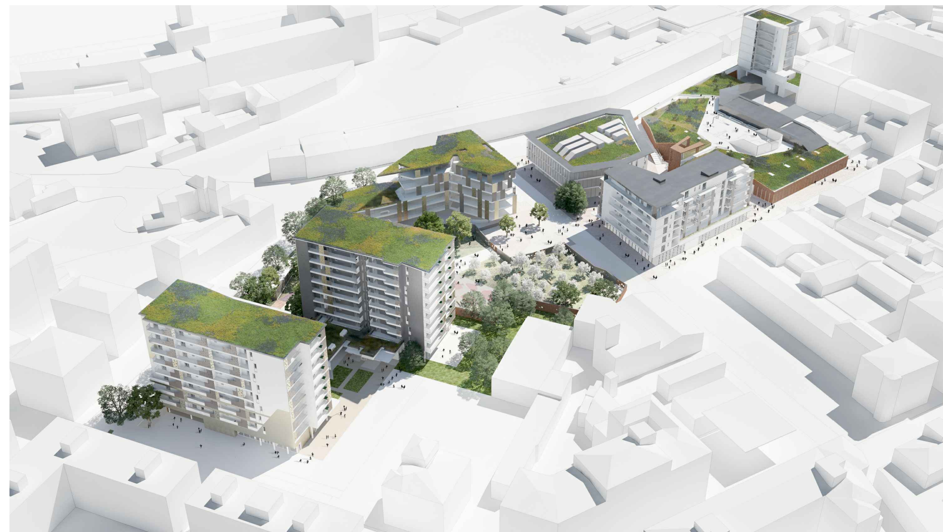
02_VISTA AEREA NORD-EST