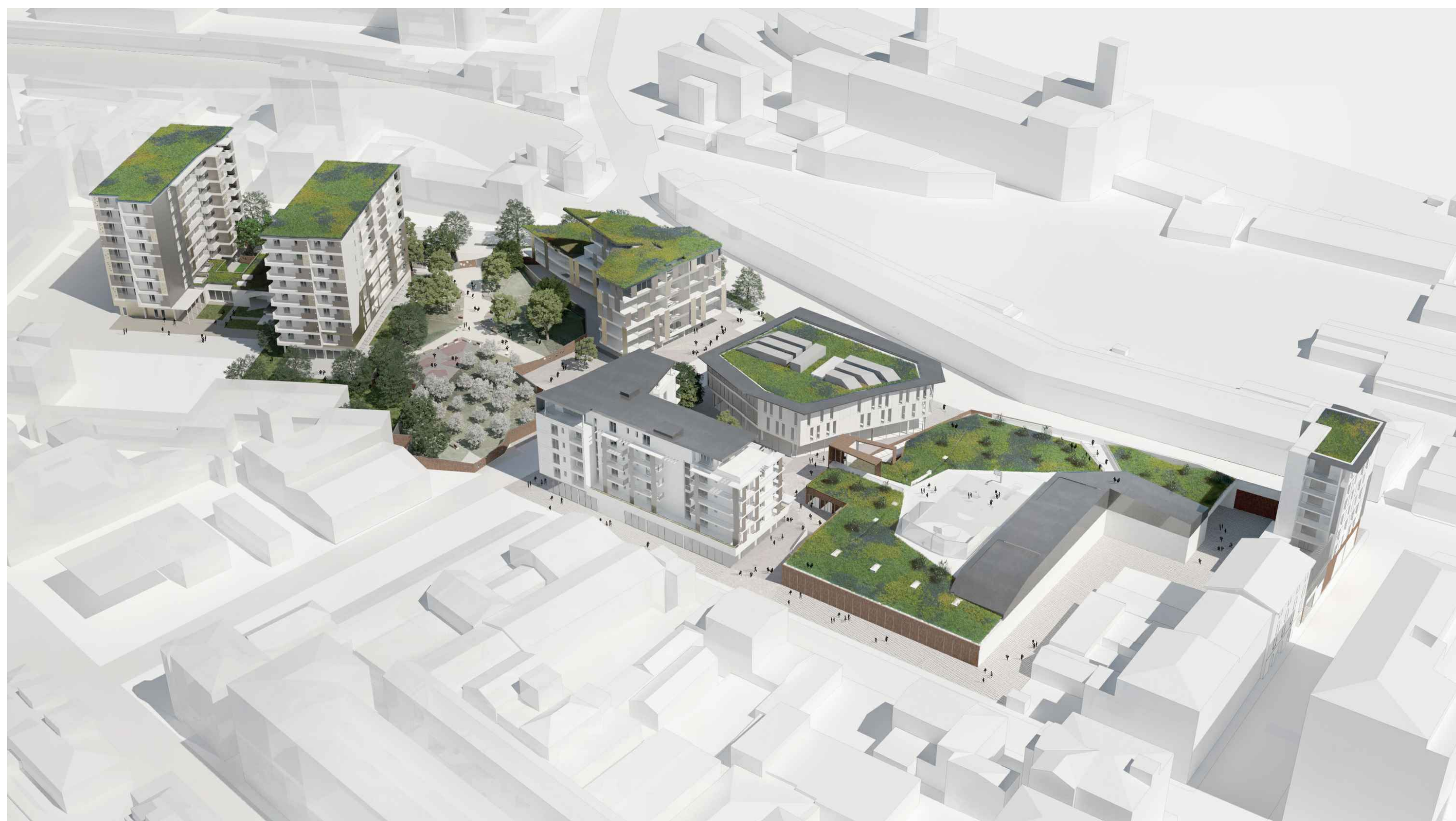
01_VISTA AEREA NORD_OVEST