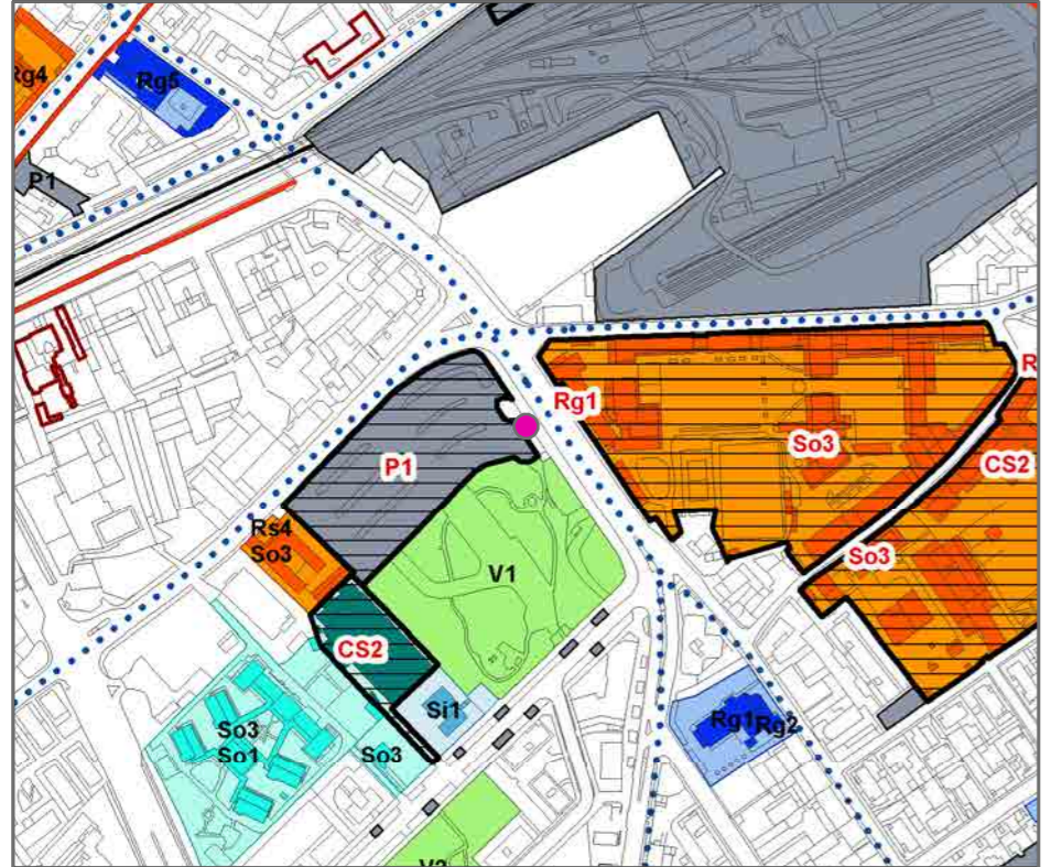
● Chiosco Scala 1:5000

INQUADRAMENTO URBANISTICO: PS1 - PIANO DEI SERVIZI - L'OFFERTA (PGT)