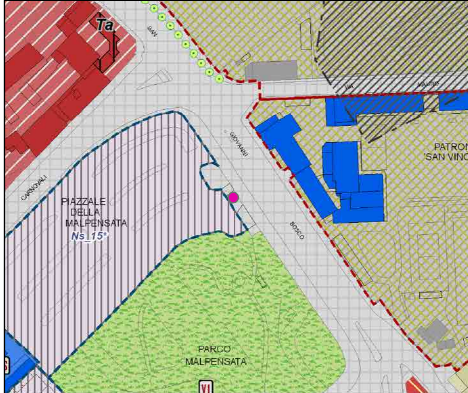
● Chiosco Scala 1:2000

INQUADRAMENTO URBANISTICO: PR7 - PIANO DELLE REGOLE (PGT)