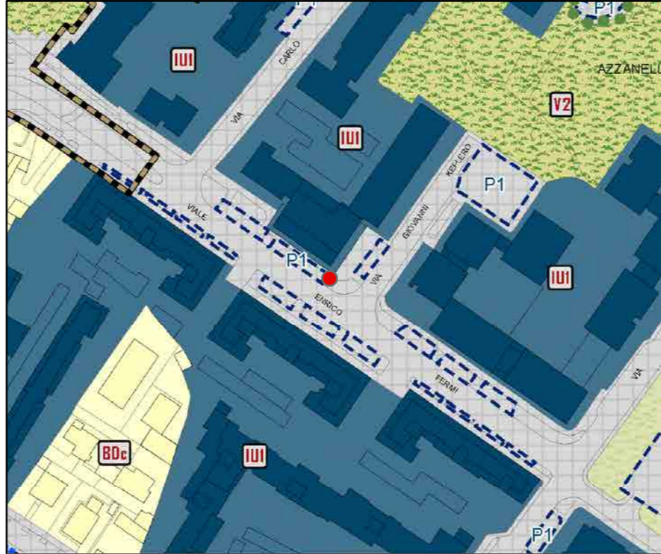
● Edicola Scala 1:2000

INQUADRAMENTO URBANISTICO: PR7 - PIANO DELLE REGOLE (PGT)