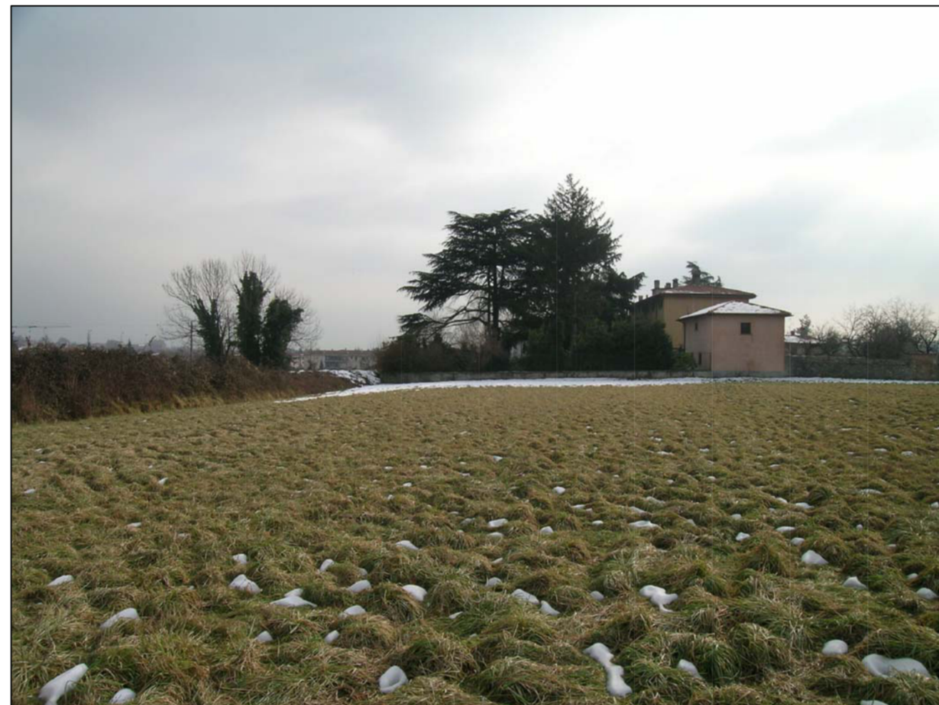
VISTA FOTOGRAFICA 4