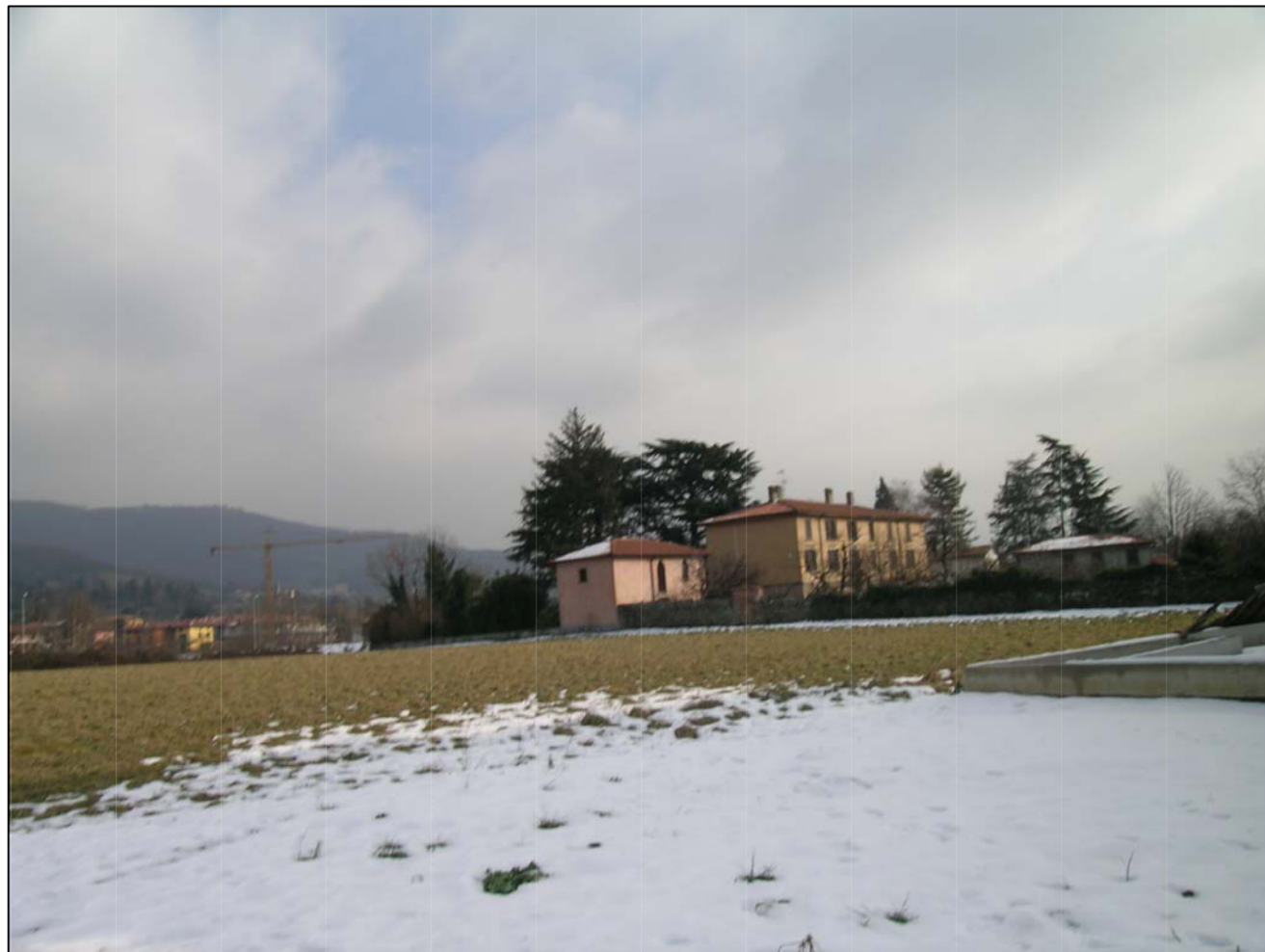
VISTA FOTOGRAFICA 1