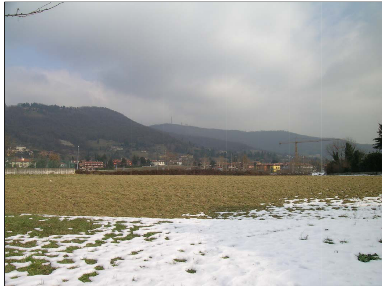
VISTA FOTOGRAFICA 2