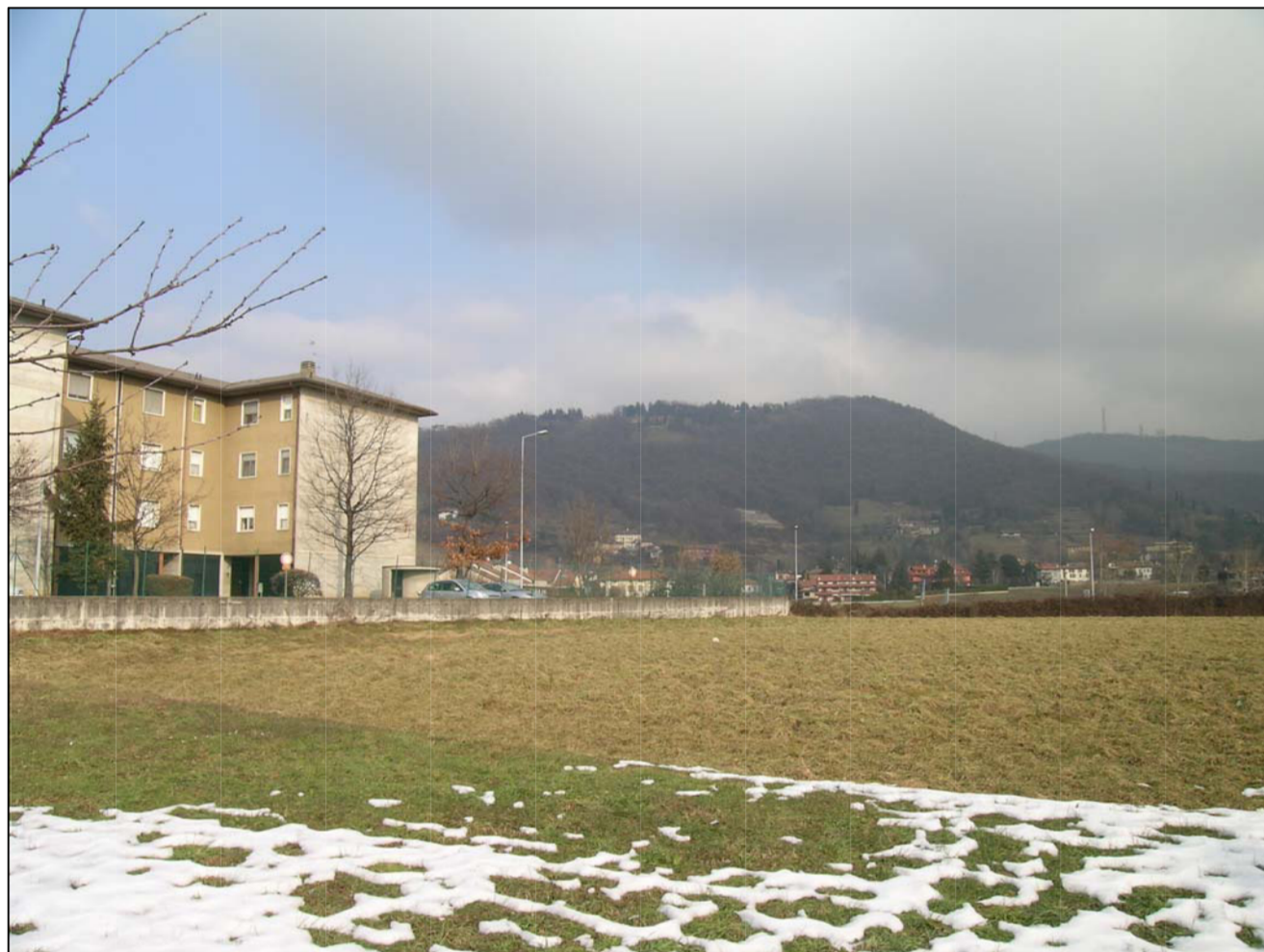
VISTA FOTOGRAFICA 3