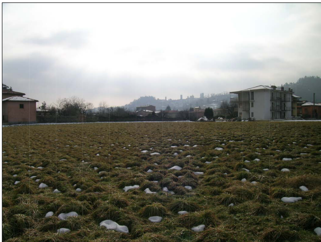
VISTA FOTOGRAFICA 5