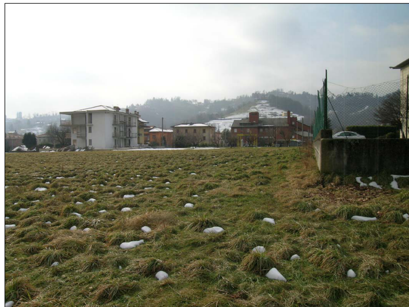
VISTA FOTOGRAFICA 6