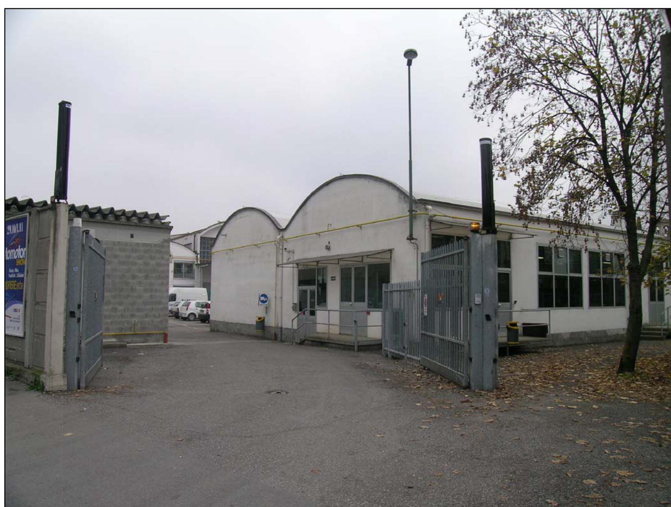
VISTA FOTOGRAFICA 5