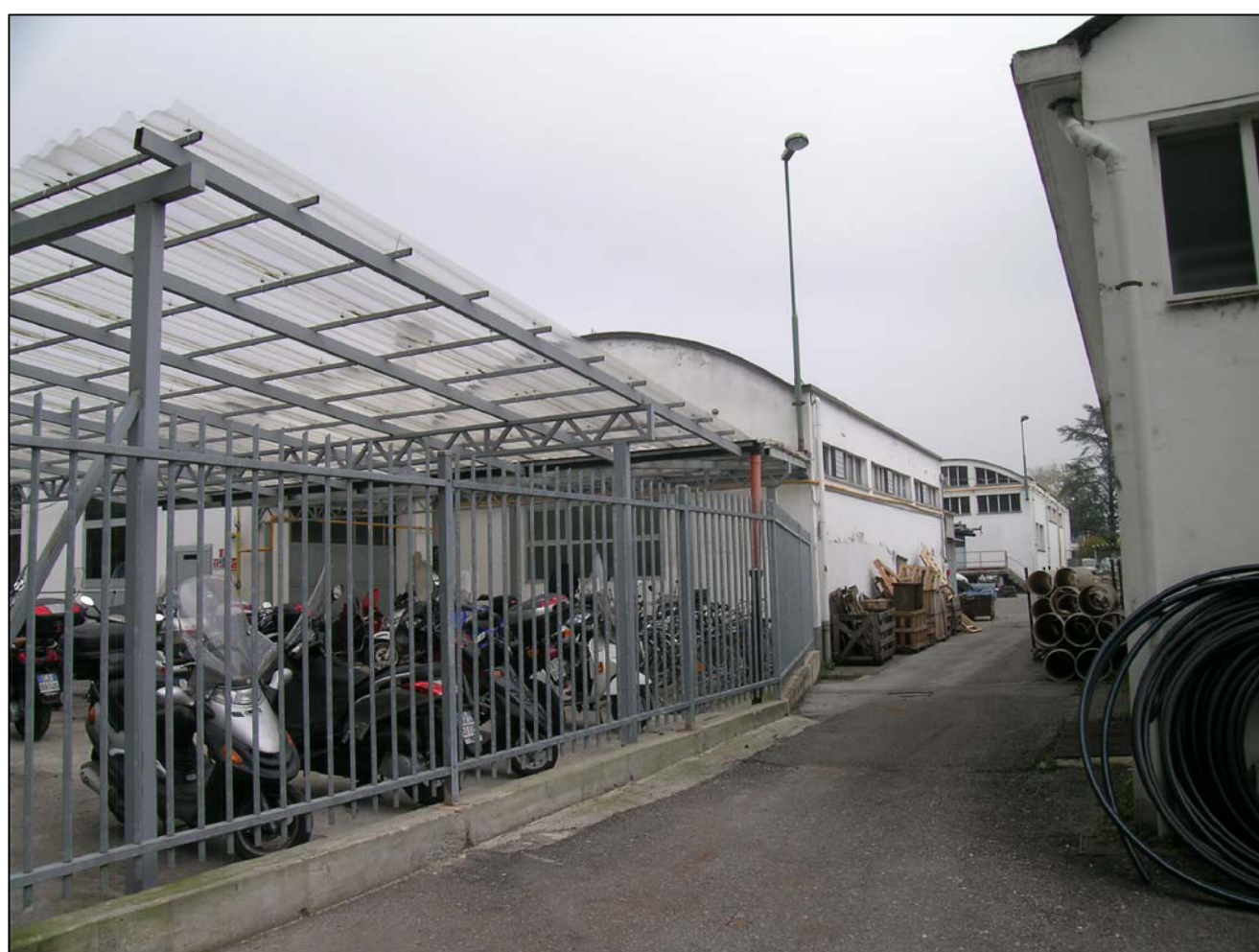
VISTA FOTOGRAFICA 3