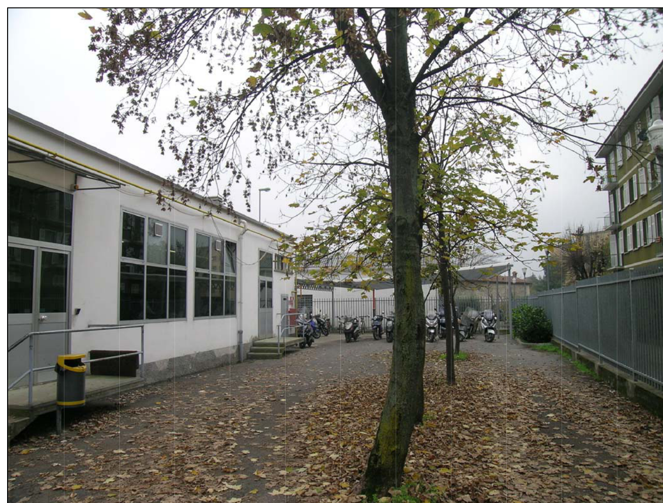
VISTA FOTOGRAFICA 4