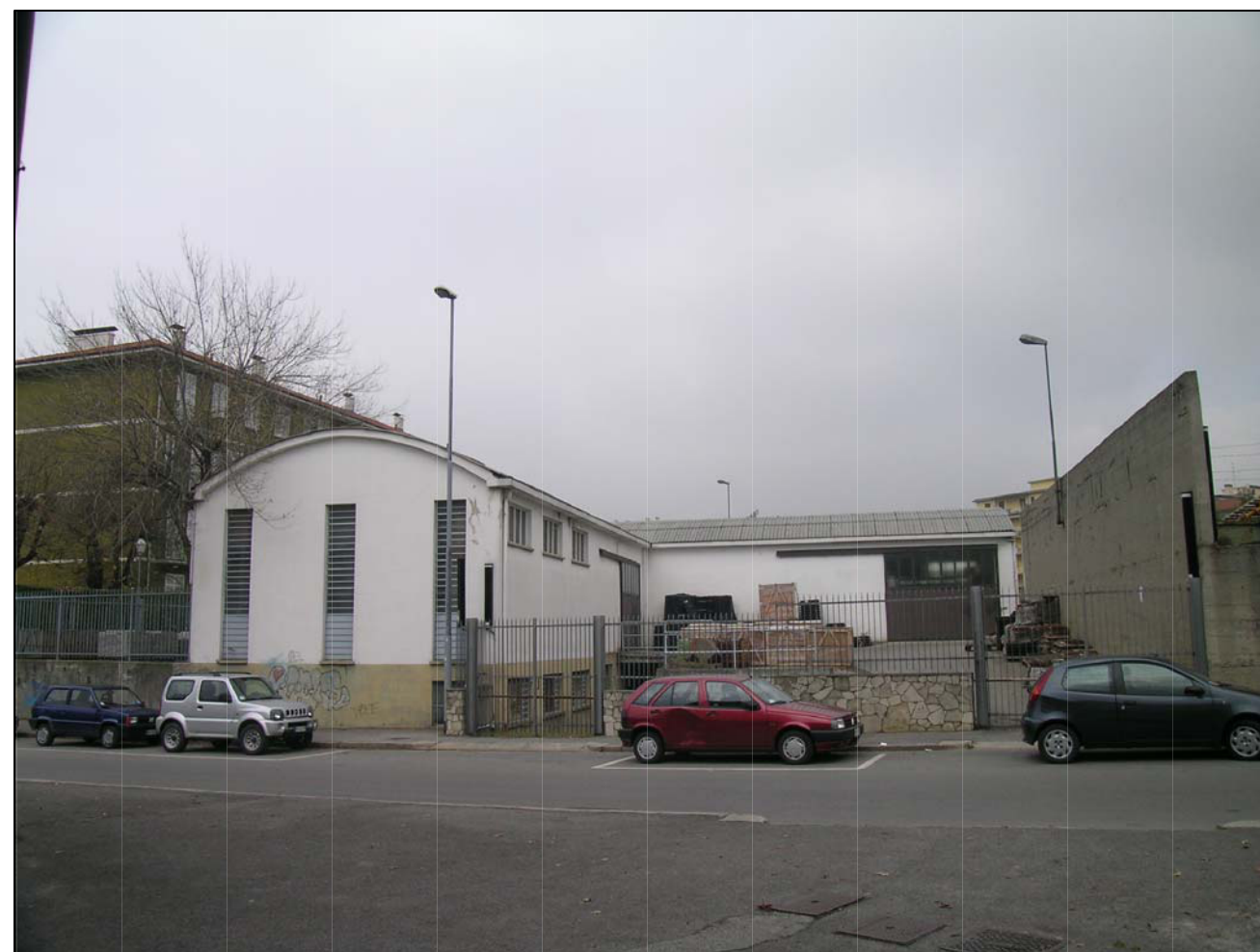
VISTA FOTOGRAFICA 2