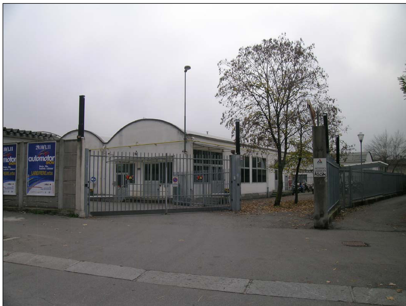
VISTA FOTOGRAFICA 1