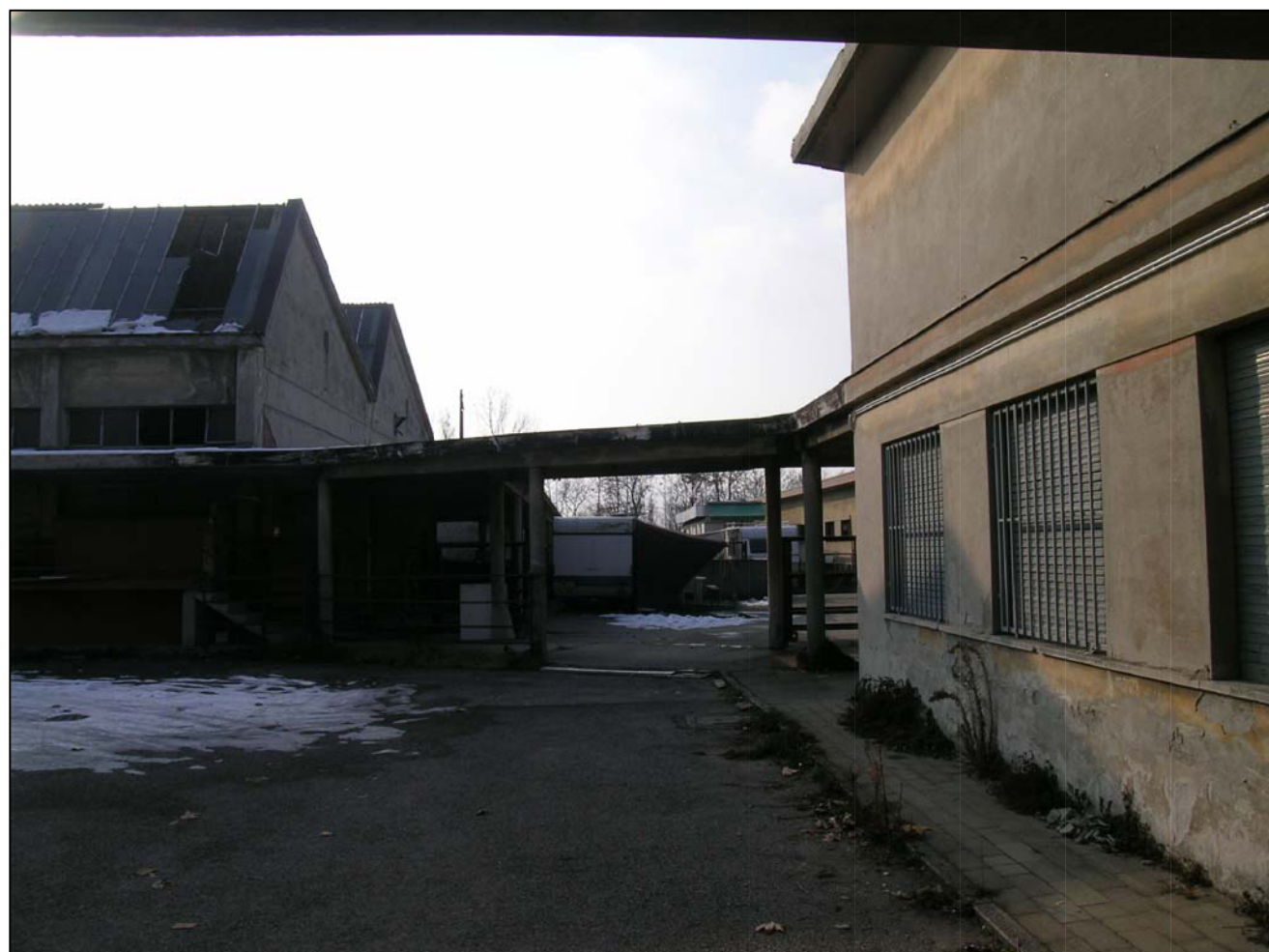
VISTA FOTOGRAFICA 3