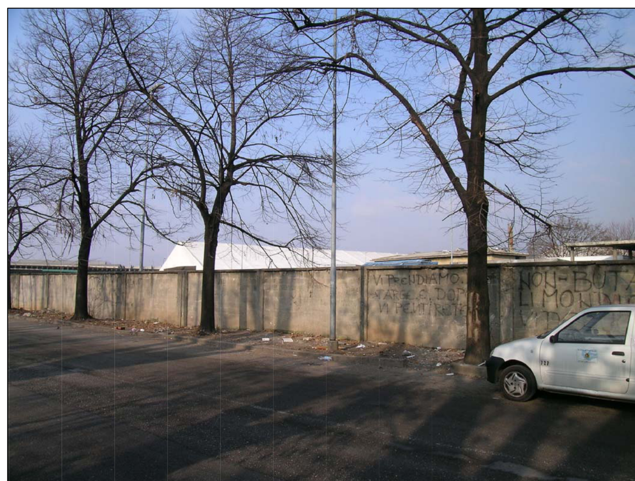
VISTA FOTOGRAFICA 6