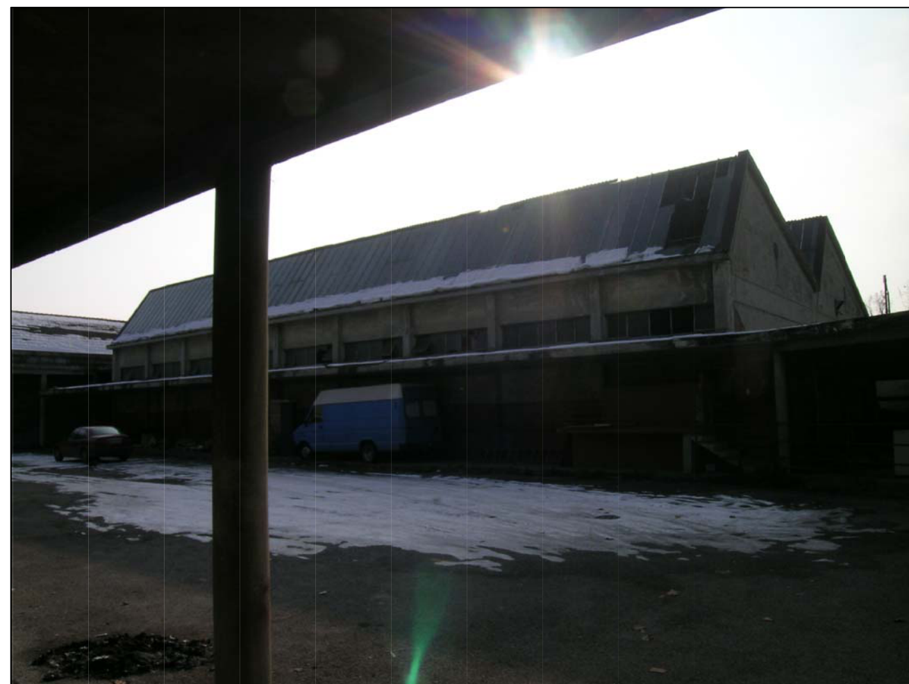
VISTA FOTOGRAFICA 4