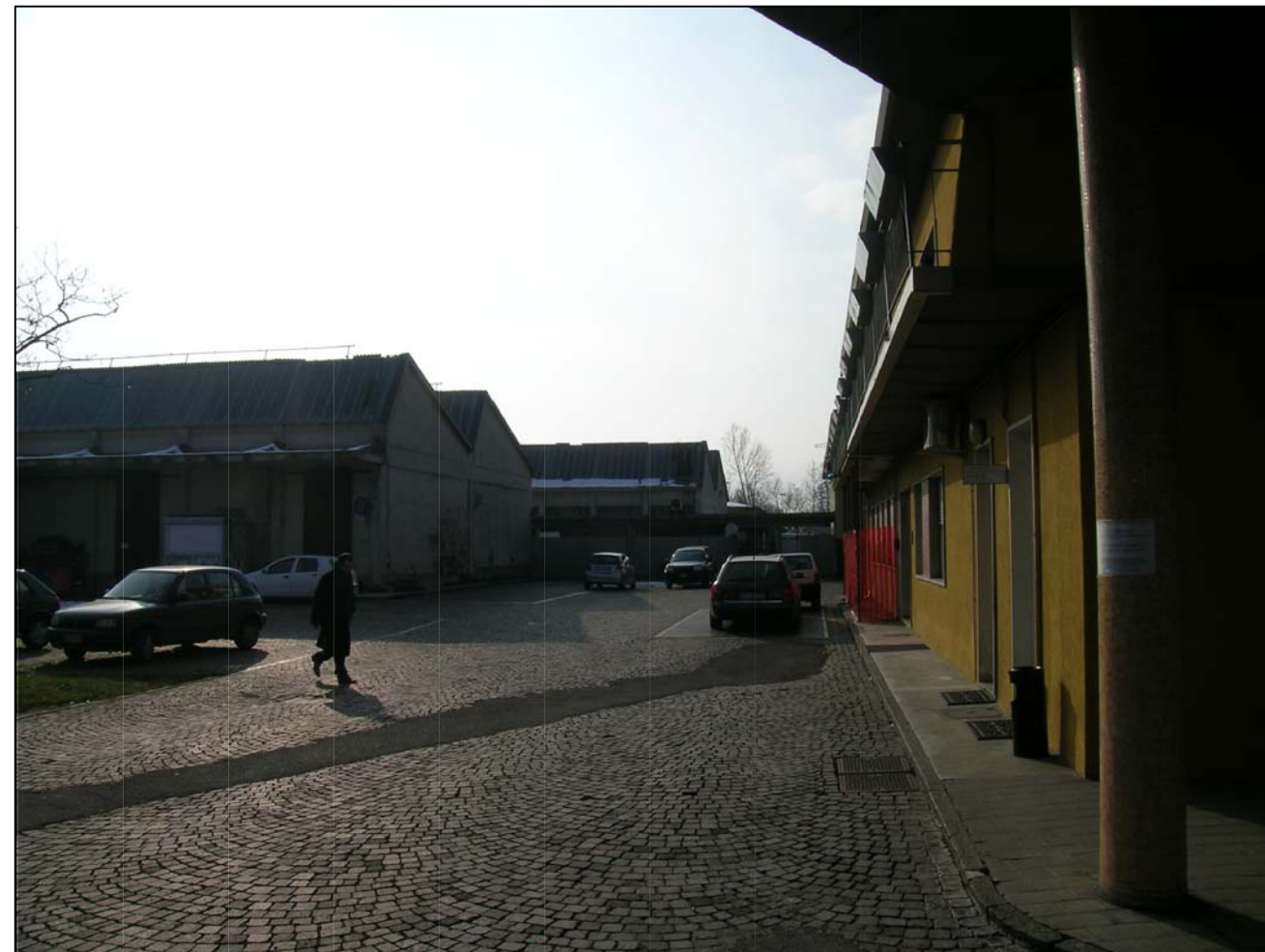
VISTA FOTOGRAFICA 2