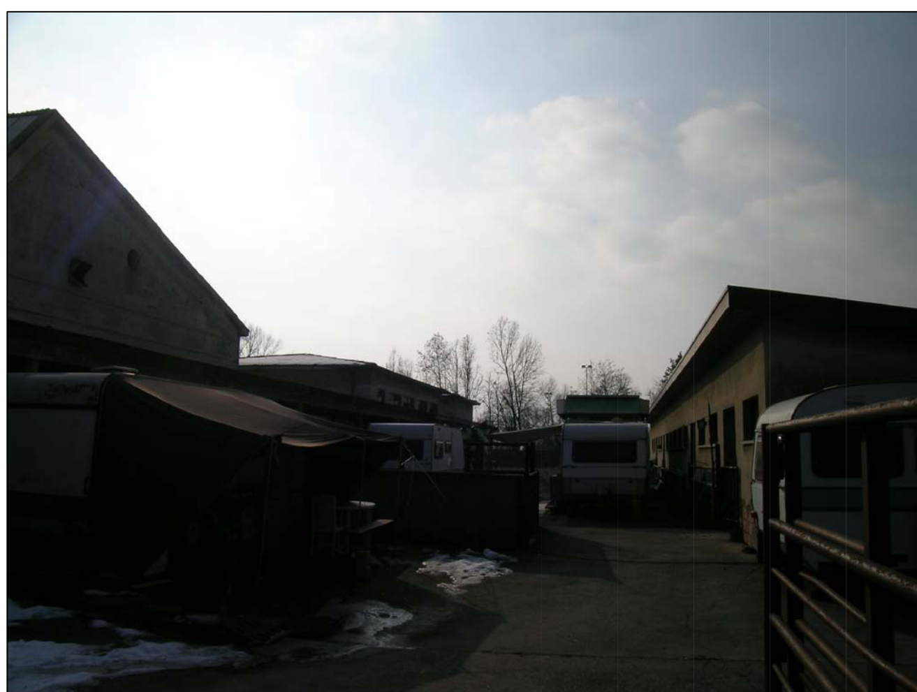
VISTA FOTOGRAFICA 5