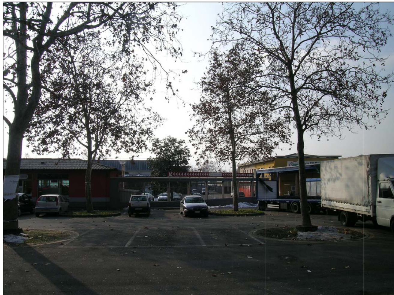
VISTA FOTOGRAFICA 1