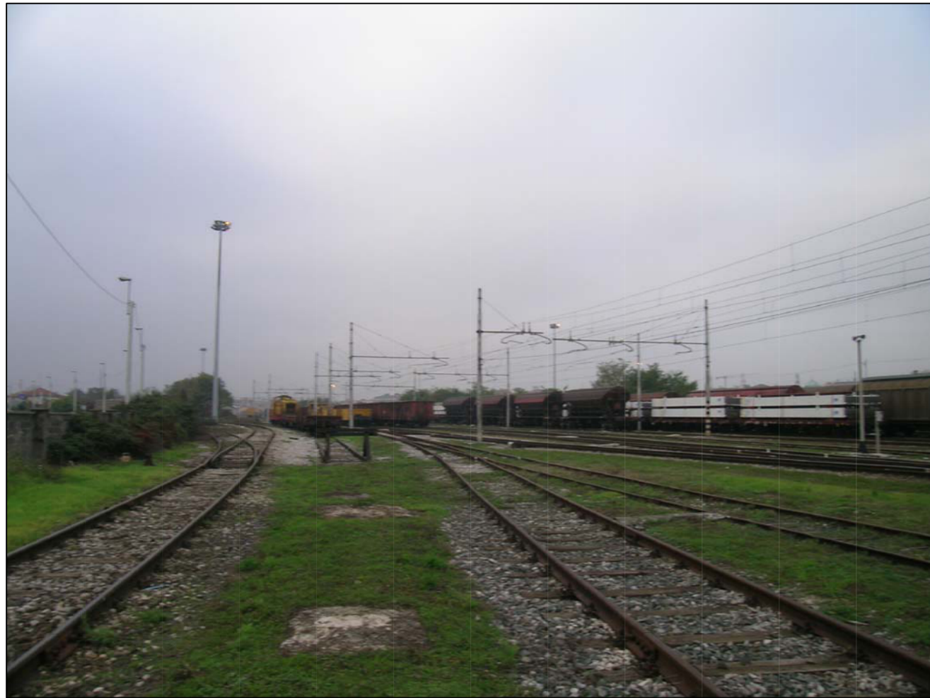
VISTA FOTOGRAFICA 1