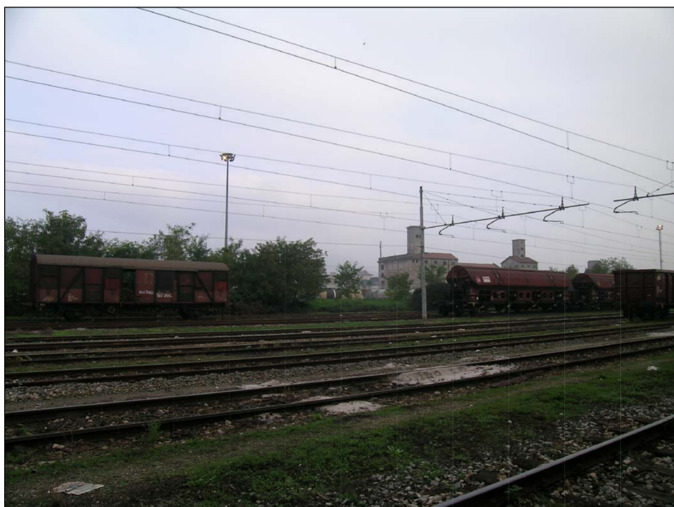
VISTA FOTOGRAFICA 5