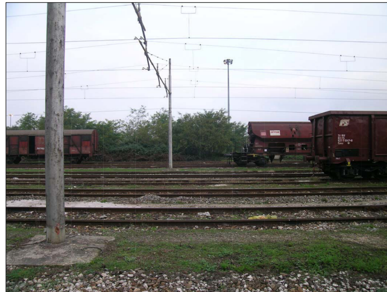
VISTA FOTOGRAFICA 4