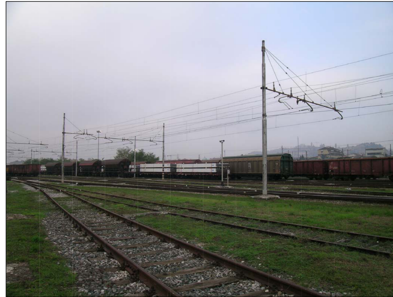
VISTA FOTOGRAFICA 2