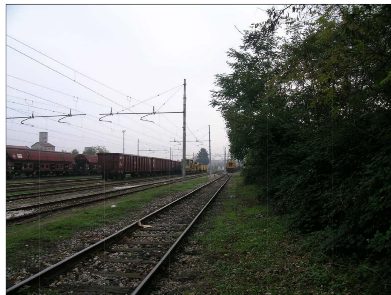
VISTA FOTOGRAFICA 6