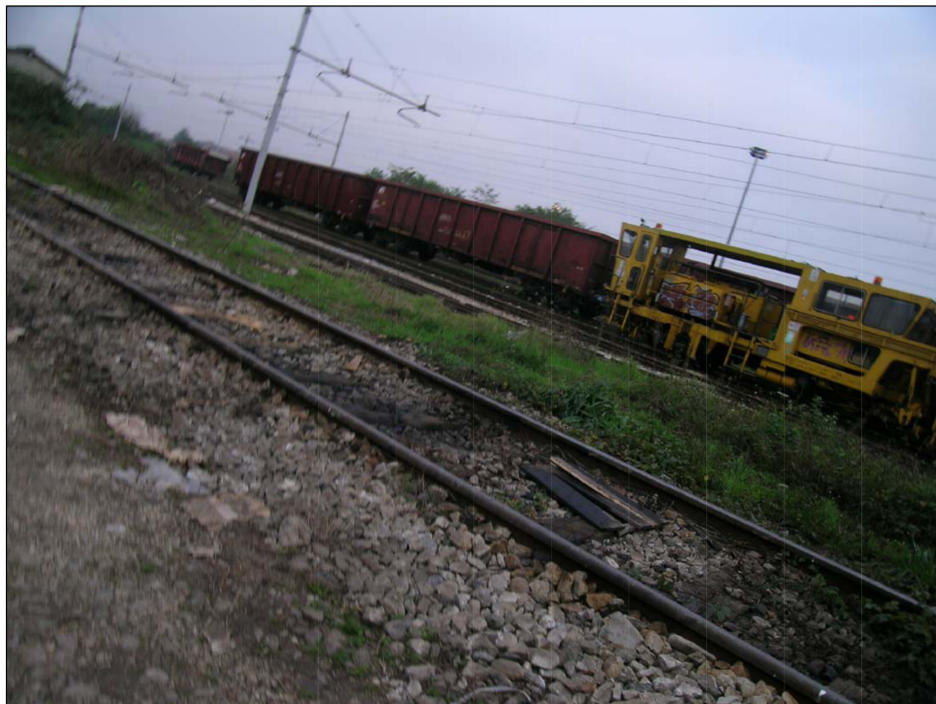
VISTA FOTOGRAFICA 3