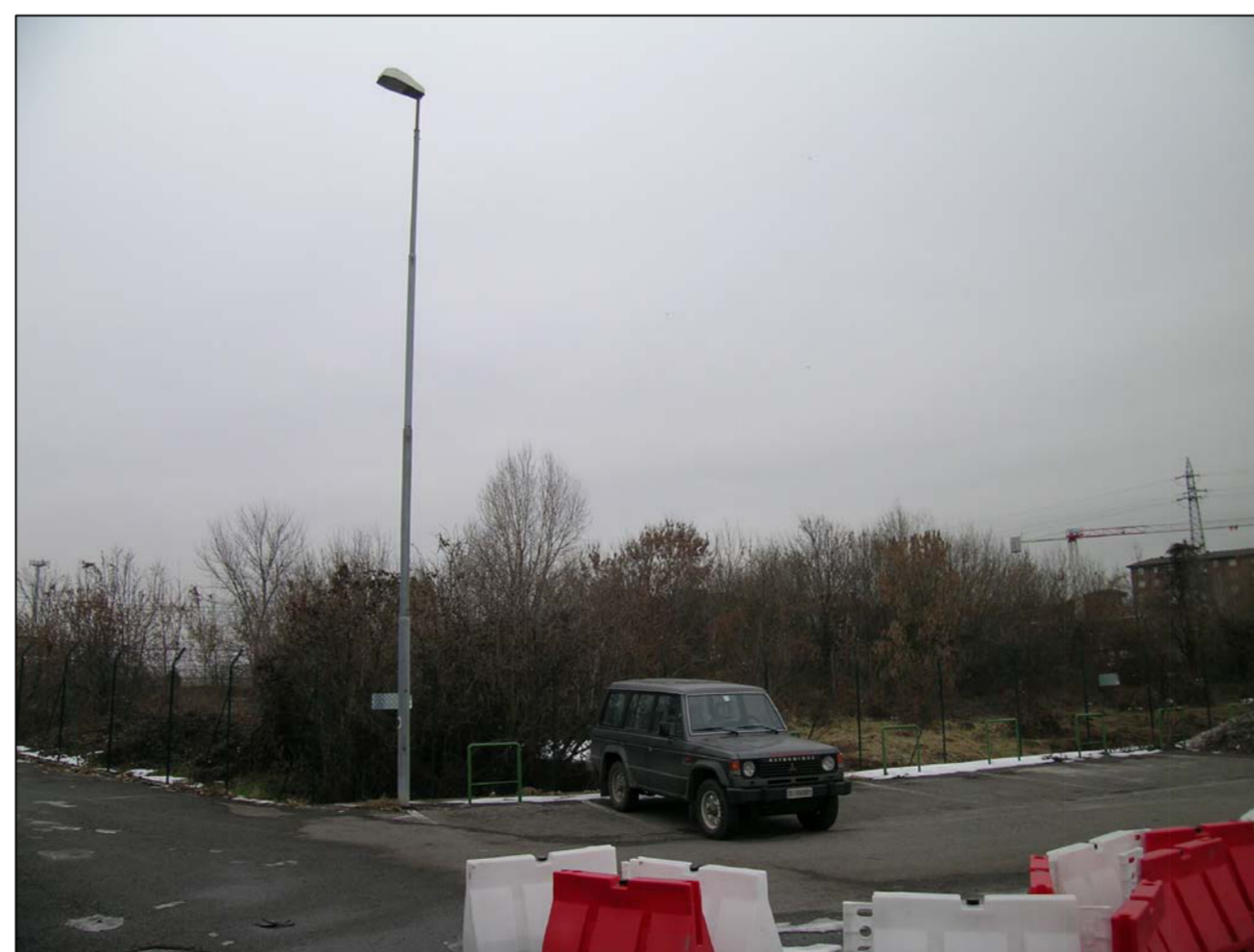
VISTA FOTOGRAFICA 6-79