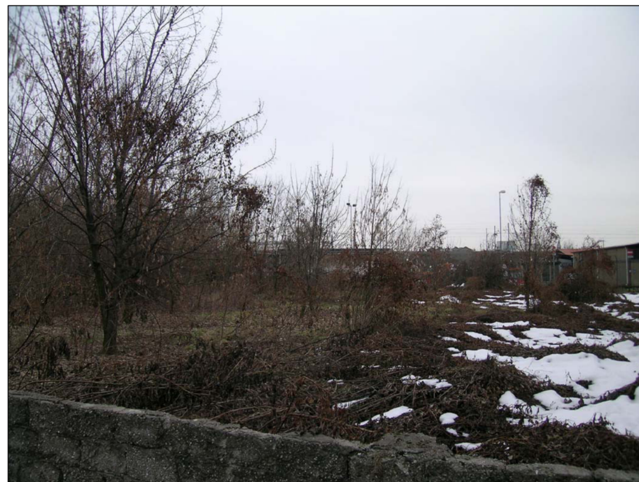
VISTA FOTOGRAFICA 4-75