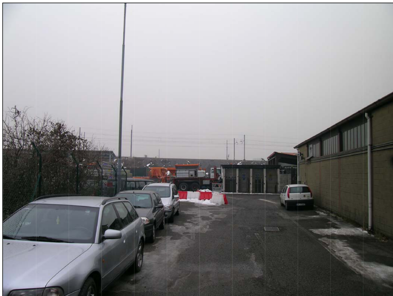
VISTA FOTOGRAFICA 1