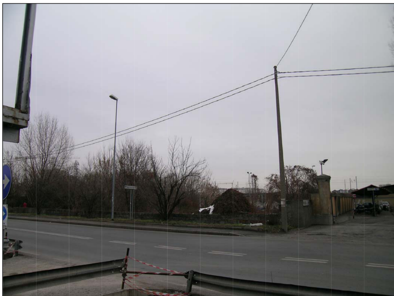
VISTA FOTOGRAFICA 3-74