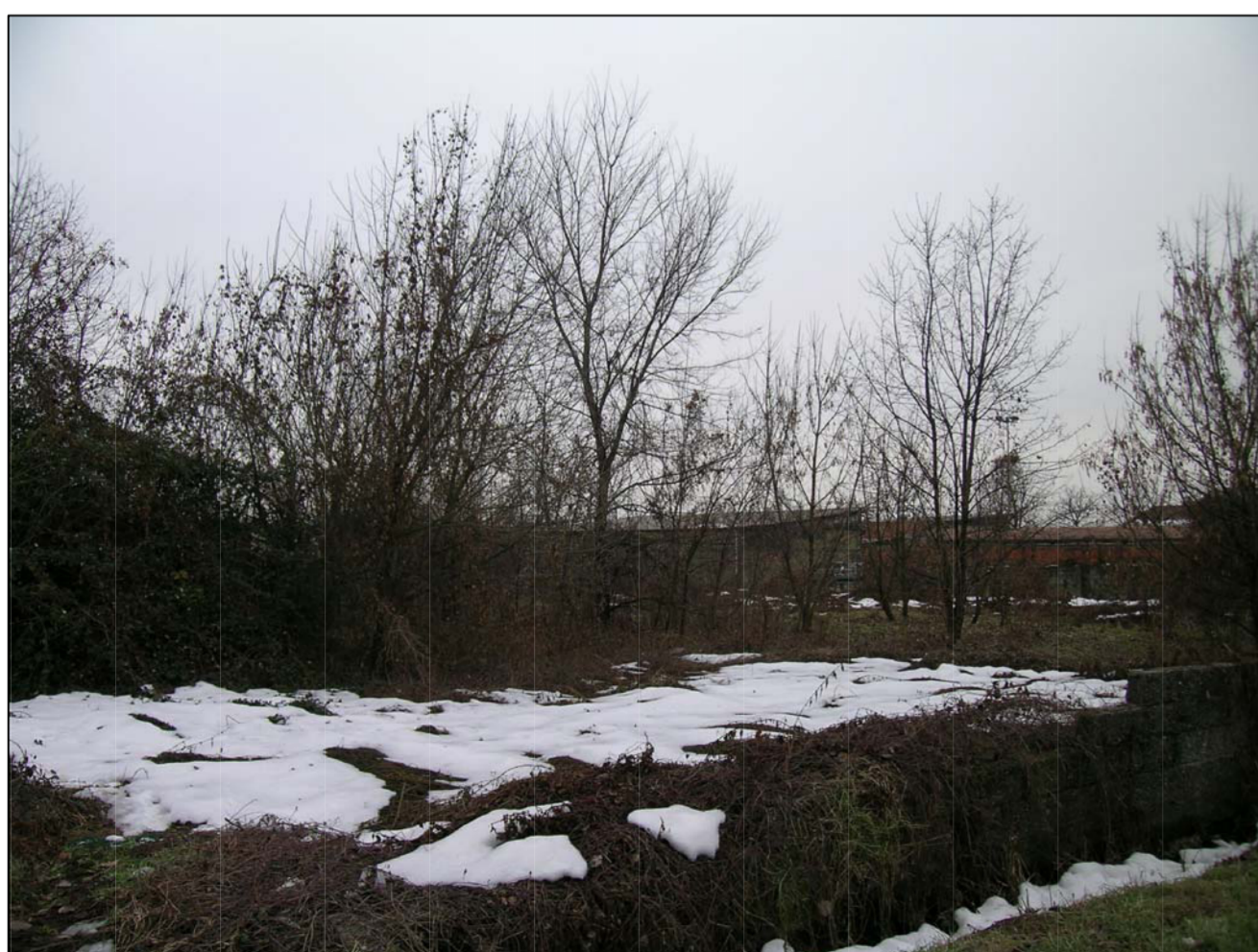
VISTA FOTOGRAFICA 5-76