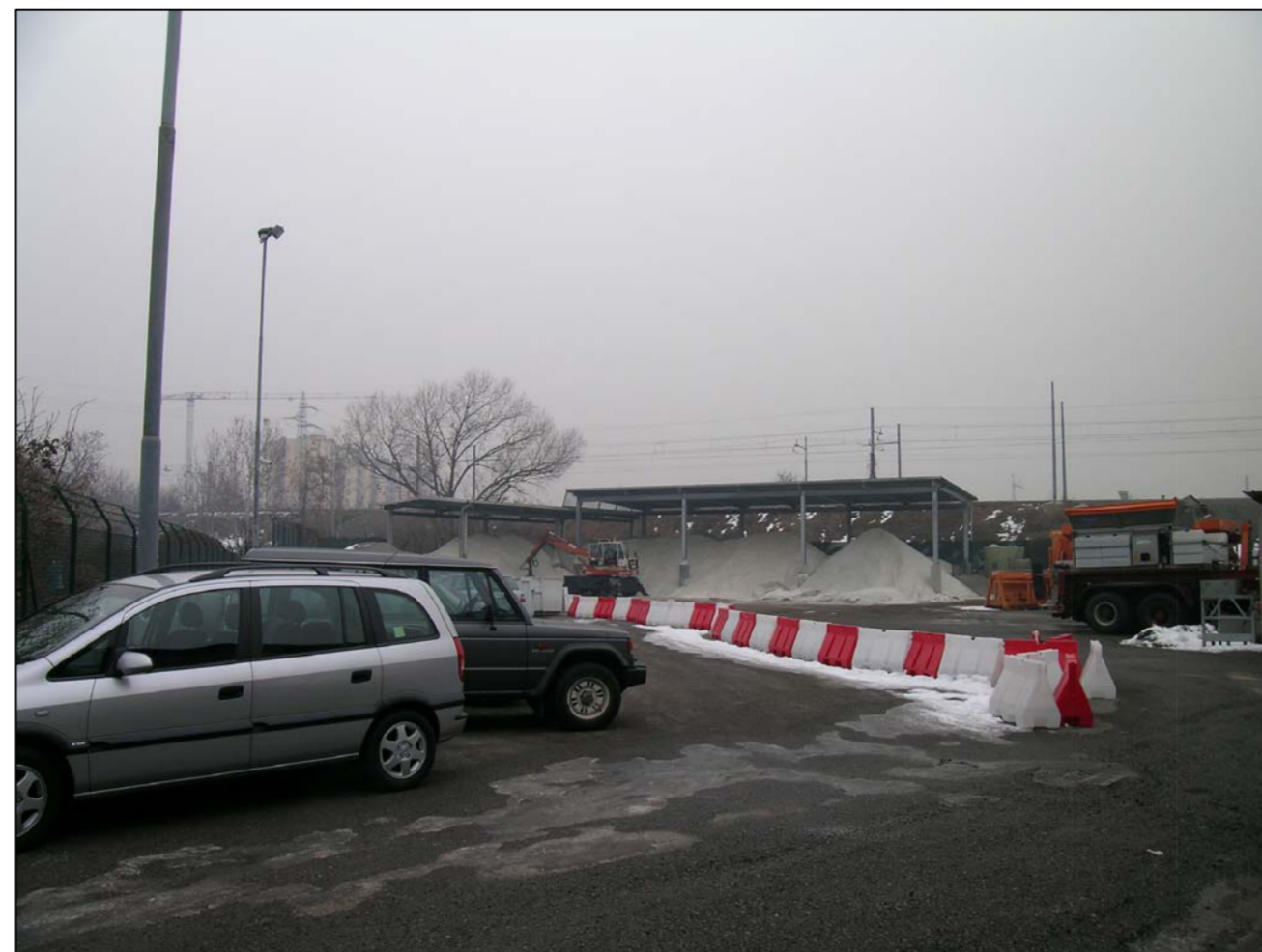
VISTA FOTOGRAFICA 2