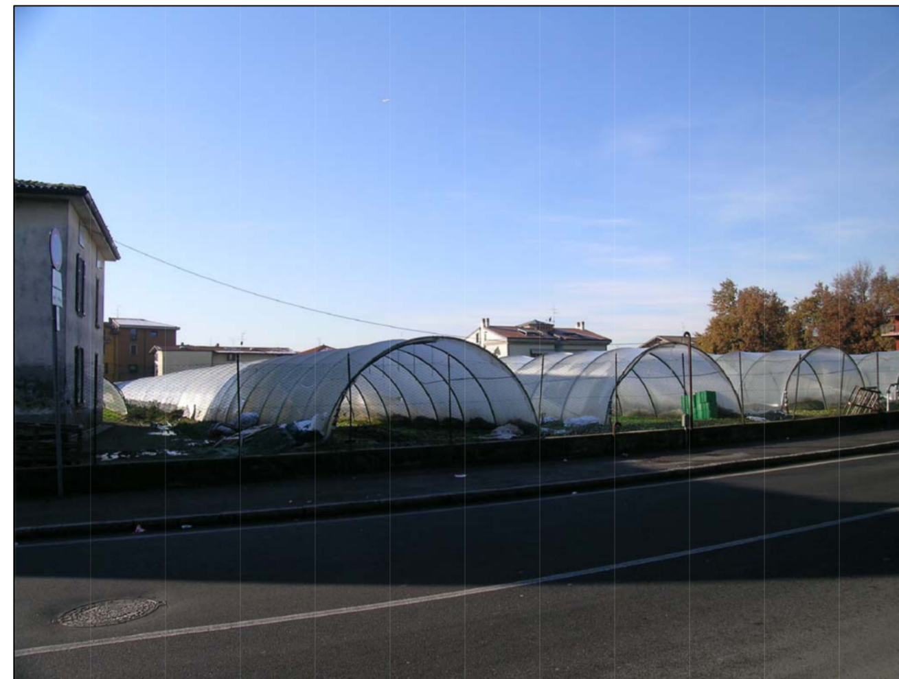
VISTA FOTOGRAFICA 4