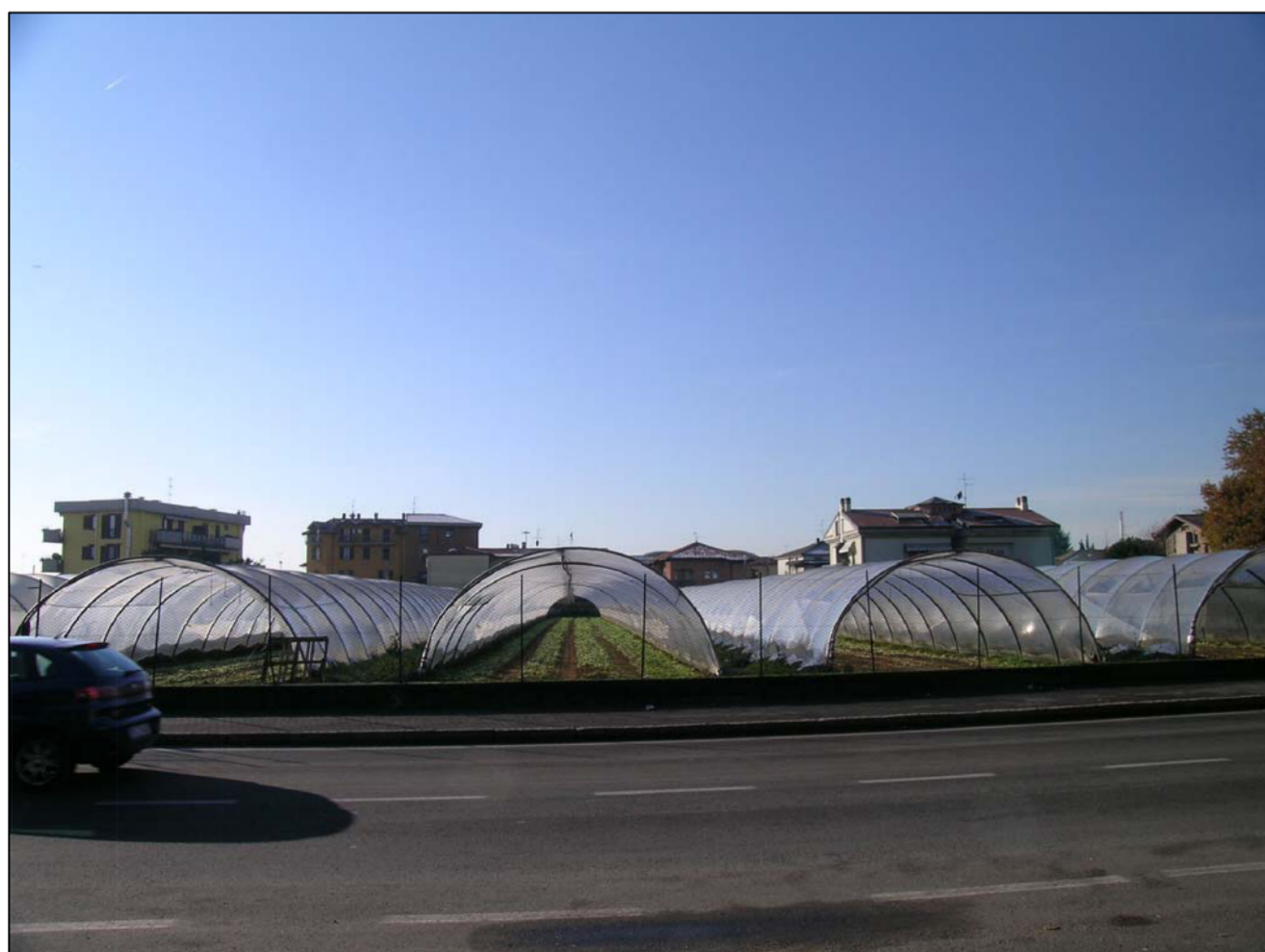
VISTA FOTOGRAFICA 5