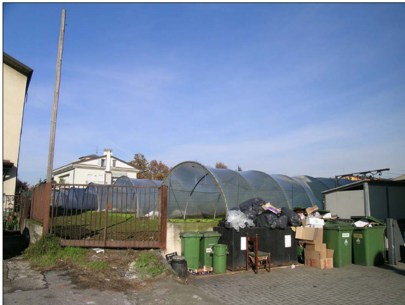
VISTA FOTOGRAFICA 3