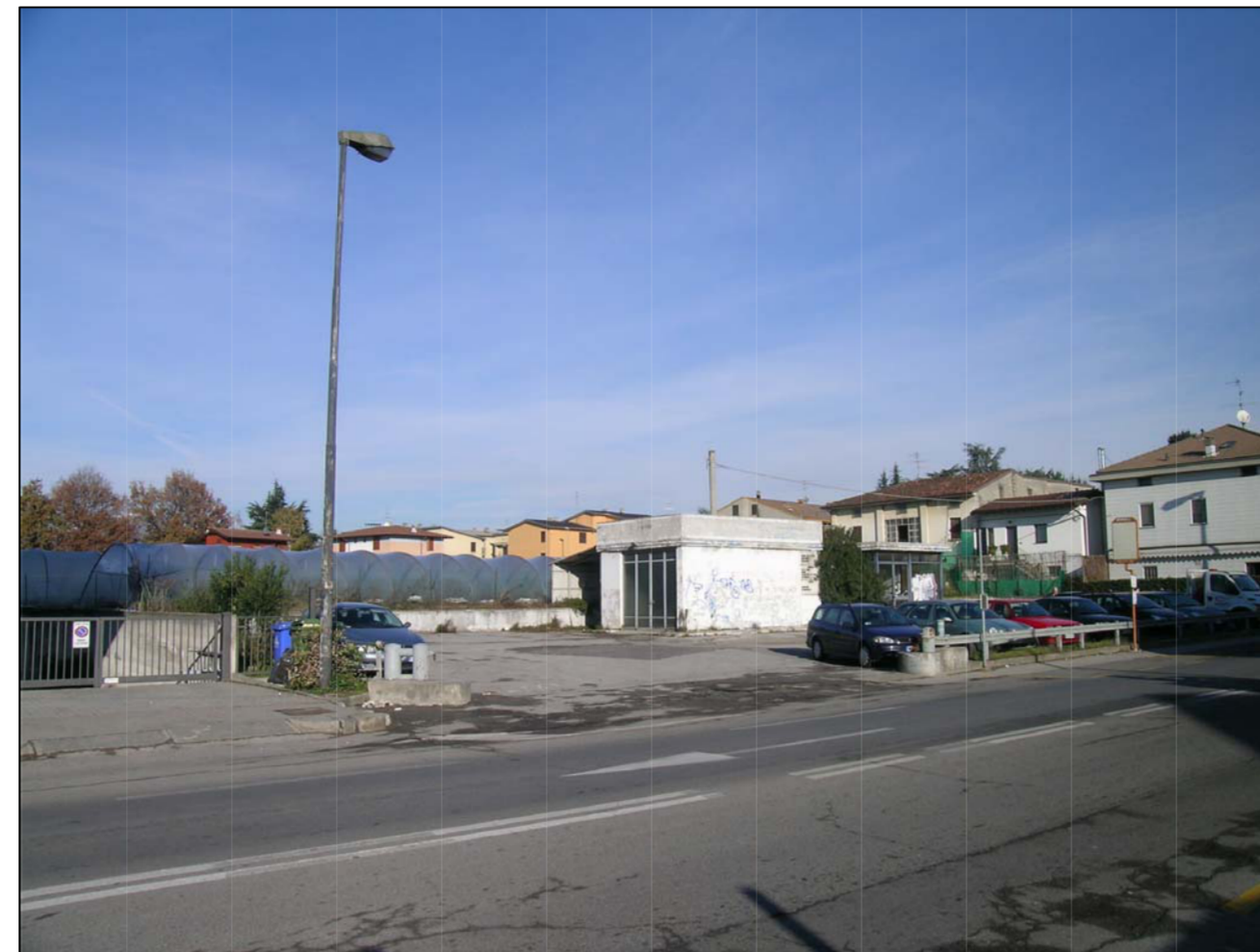
VISTA FOTOGRAFICA 2