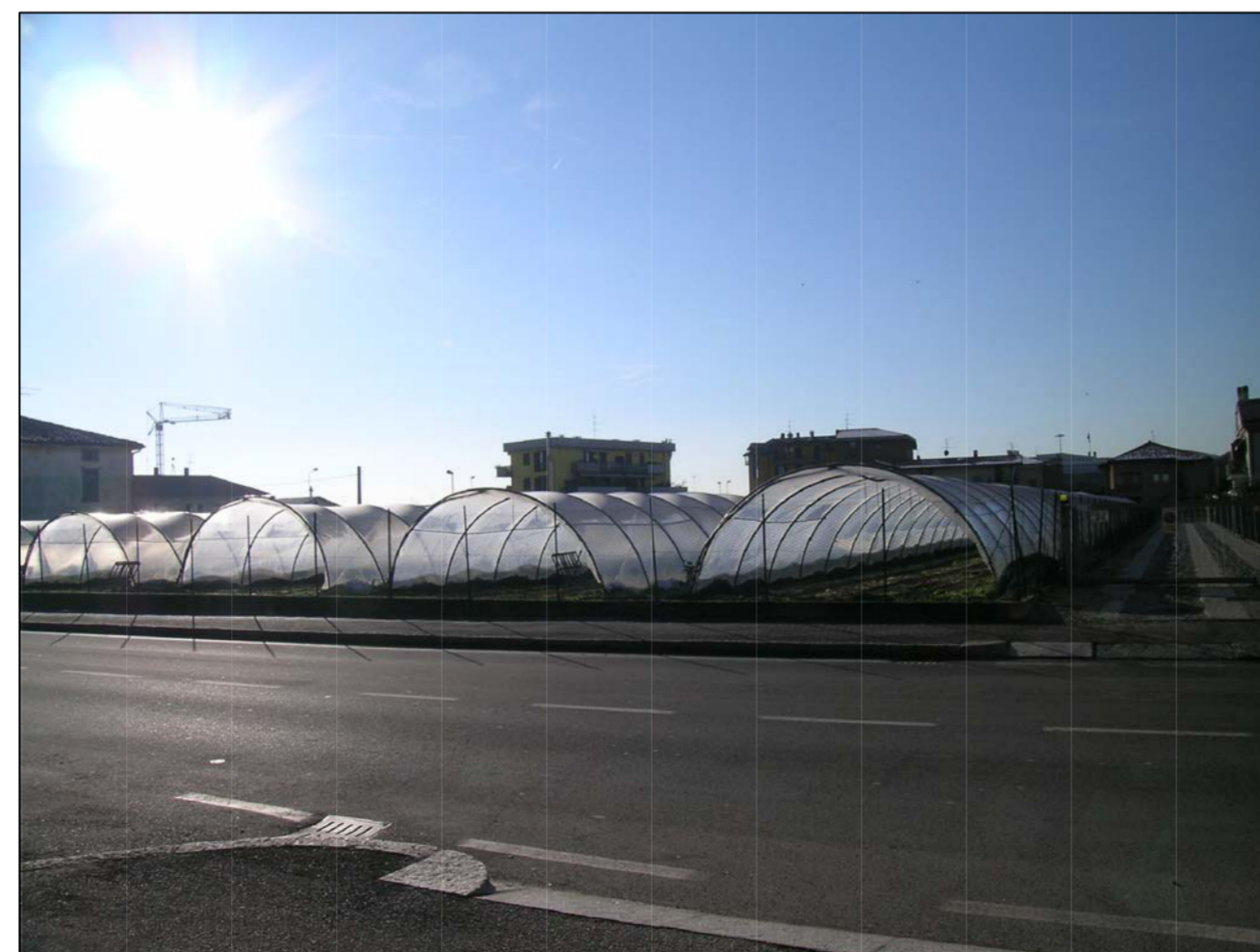
VISTA FOTOGRAFICA 6