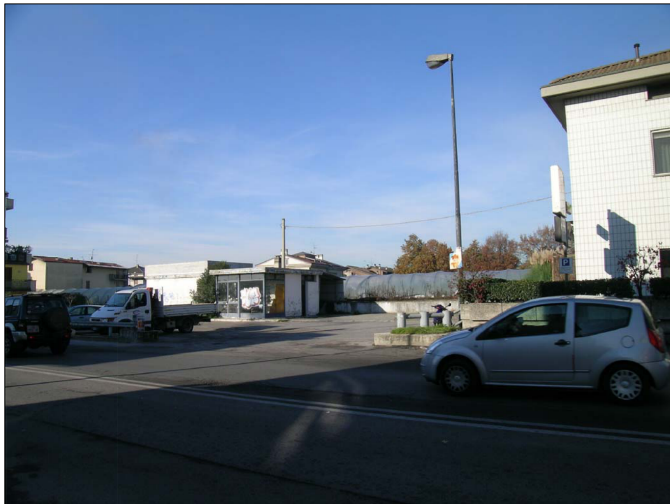
VISTA FOTOGRAFICA 1