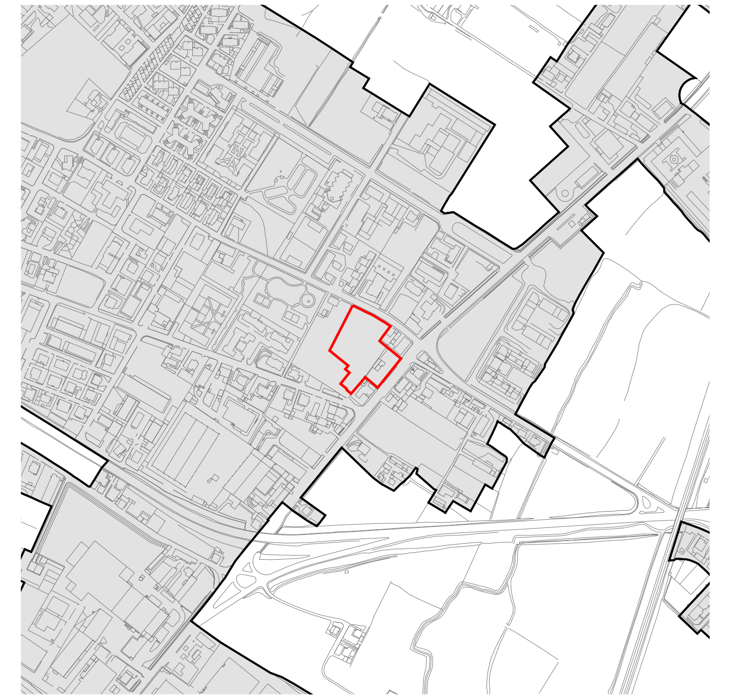
PERIMETRAZIONE CENTRO EDIFICATO - SCALA 1:5.000