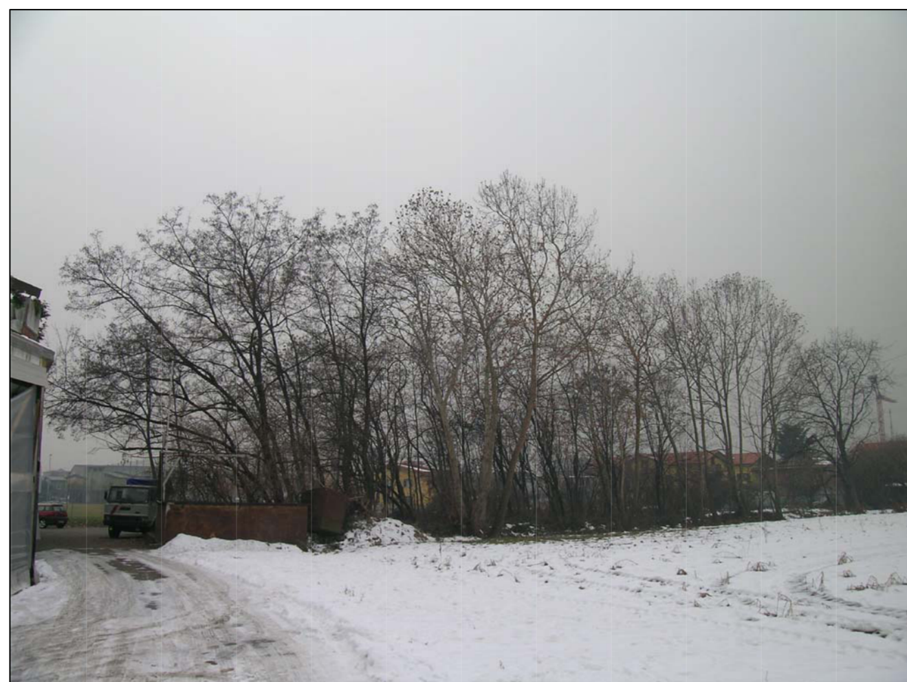
VISTA FOTOGRAFICA 2