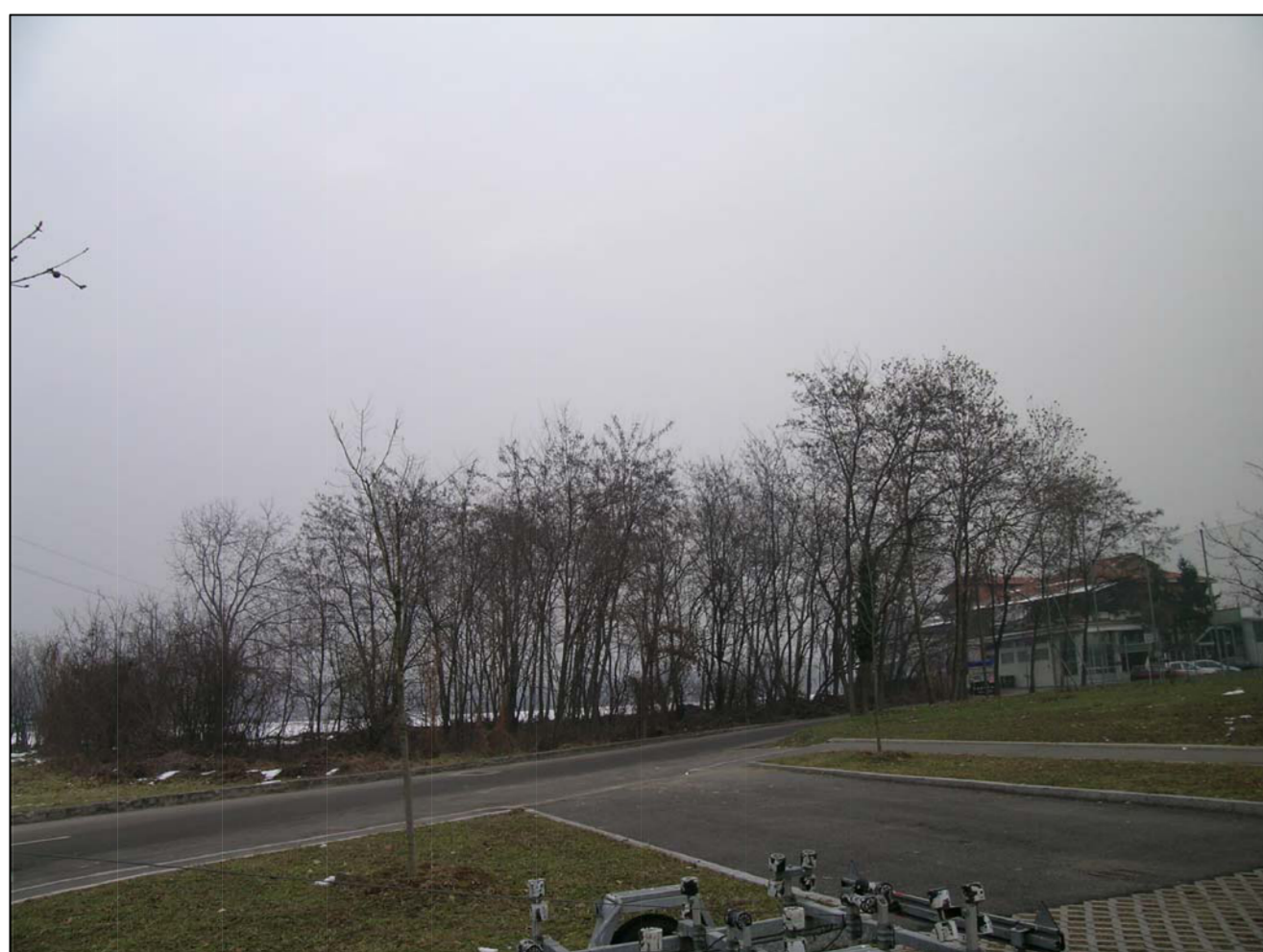
VISTA FOTOGRAFICA 5