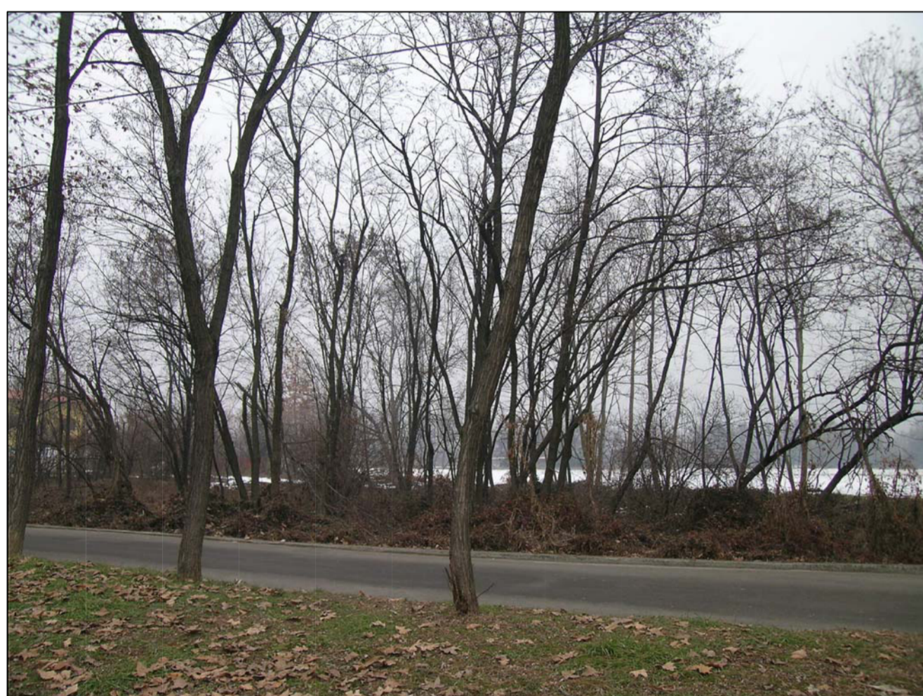
VISTA FOTOGRAFICA 3