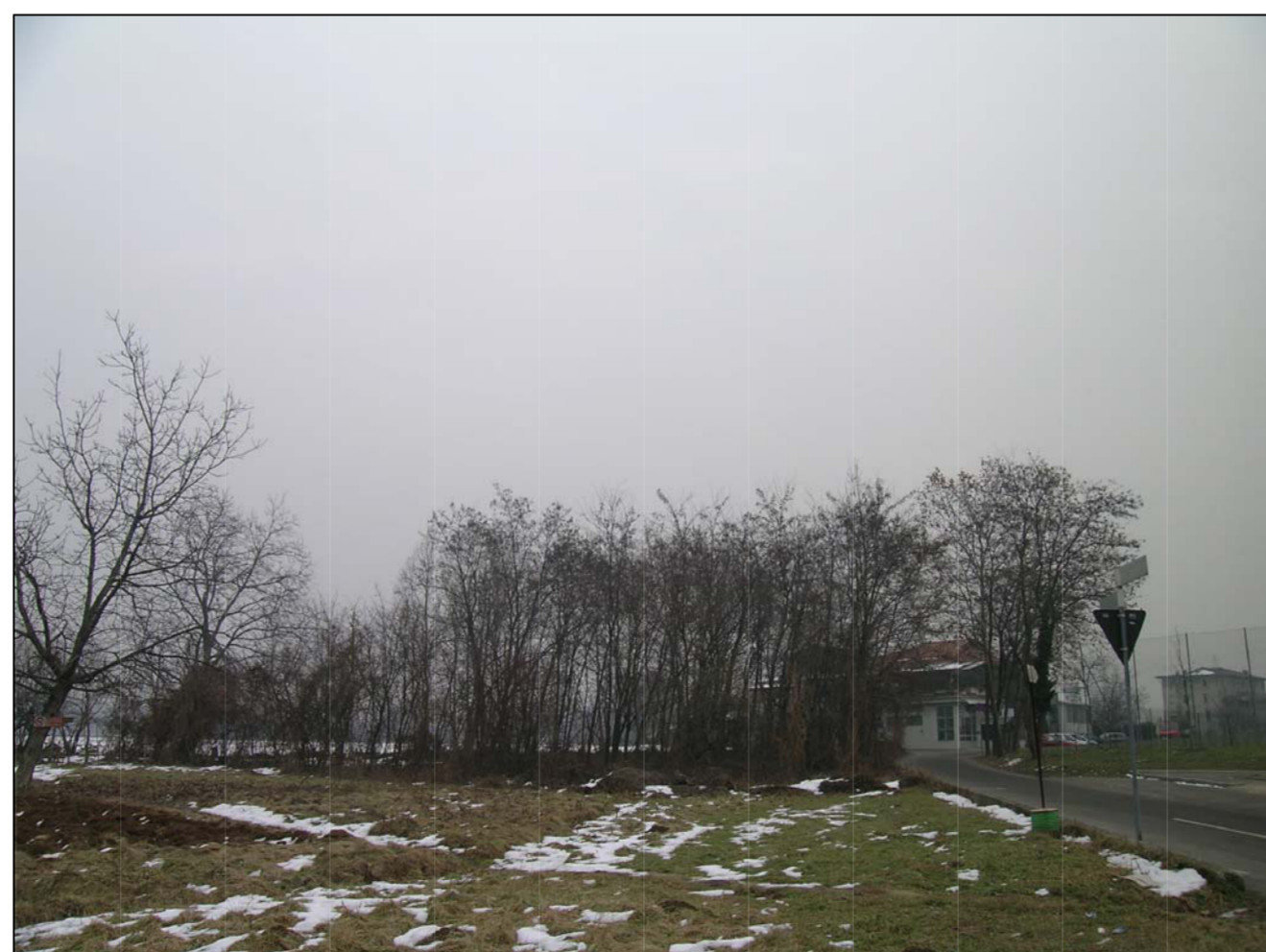
VISTA FOTOGRAFICA 6