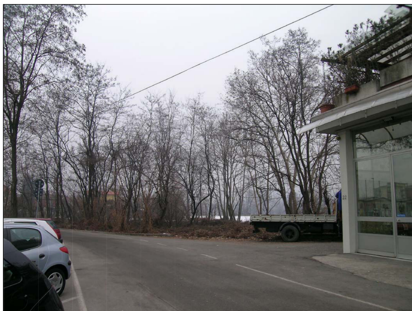
VISTA FOTOGRAFICA 1