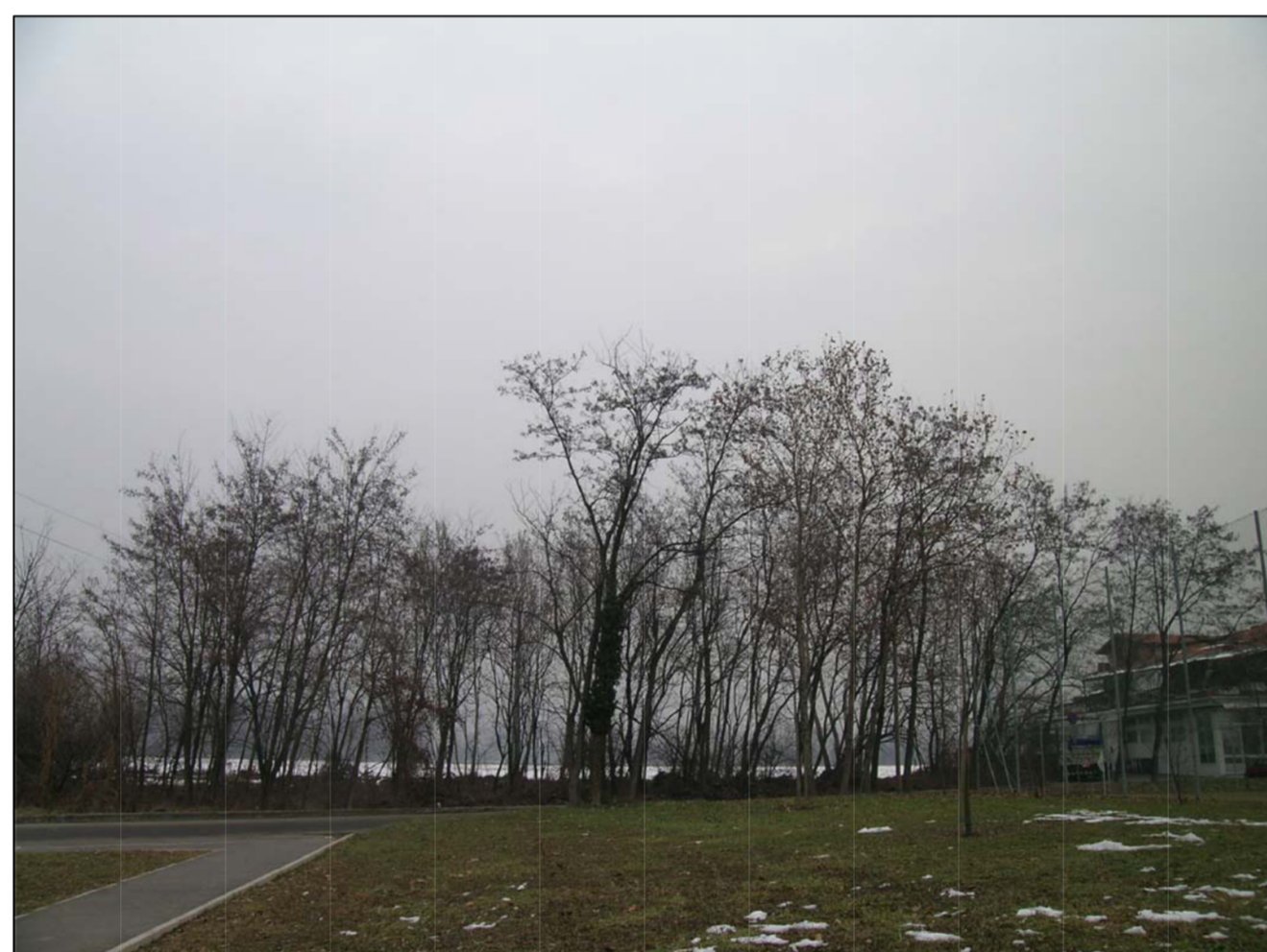
VISTA FOTOGRAFICA 4