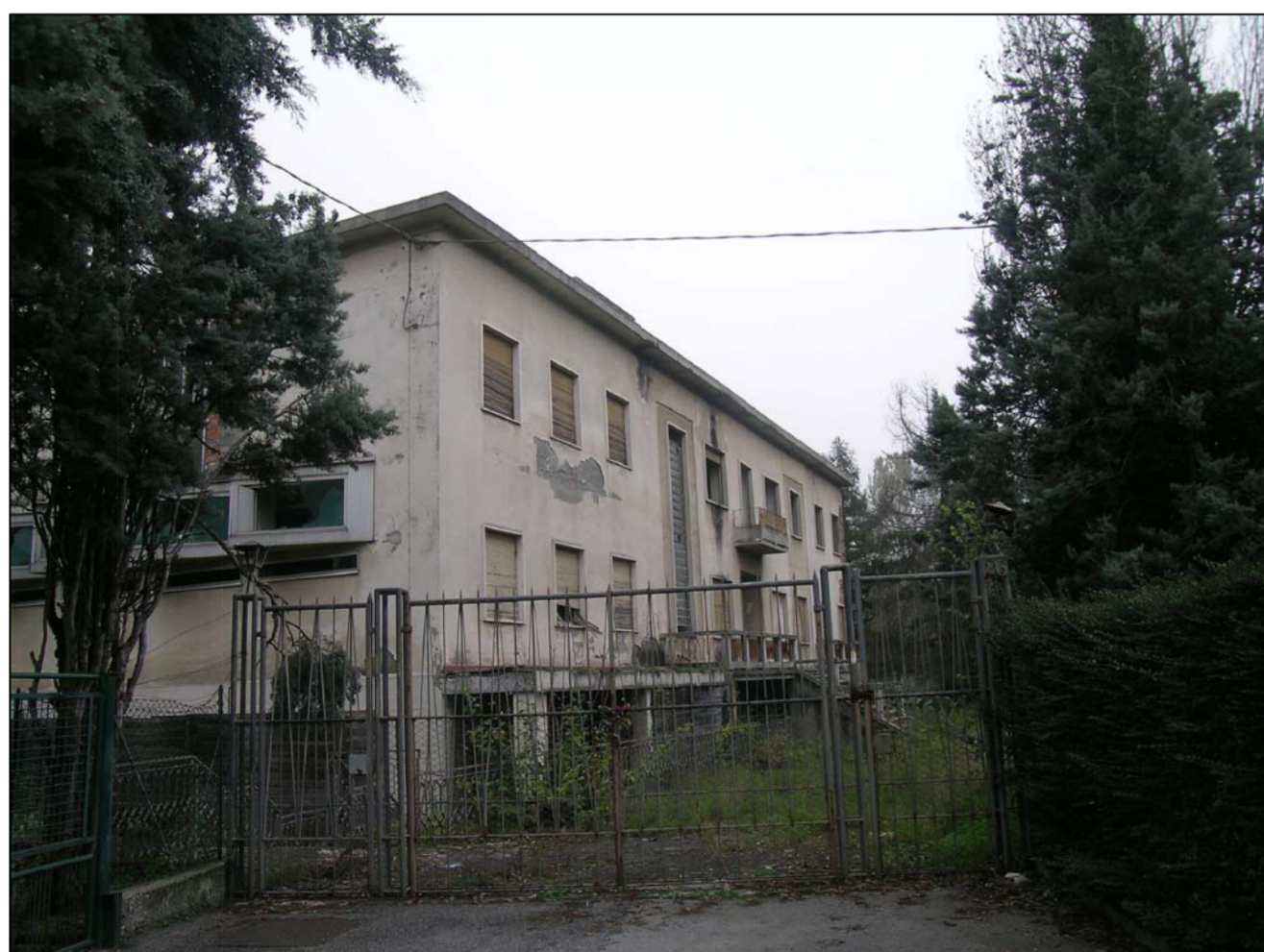
VISTA FOTOGRAFICA 5