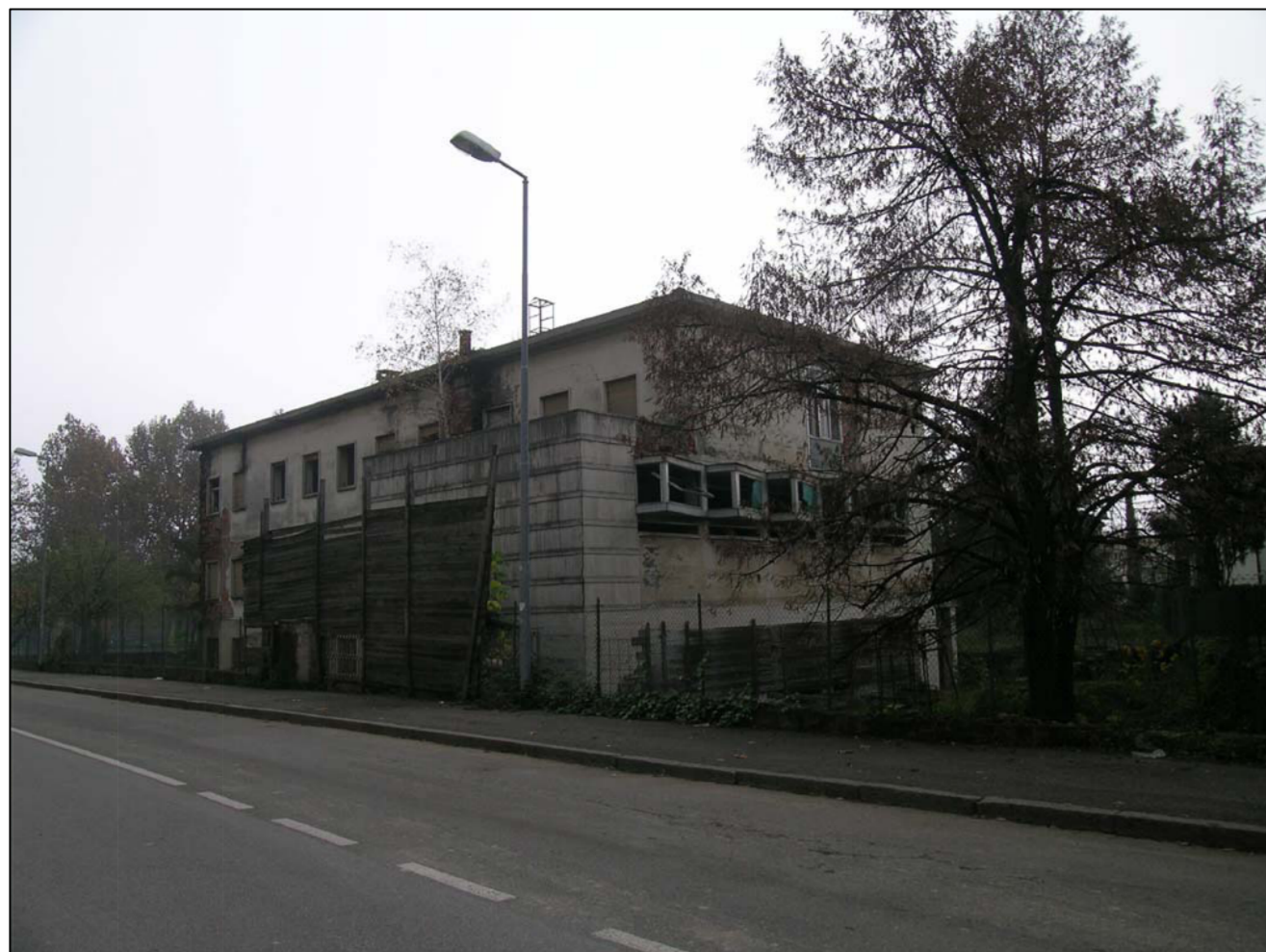
VISTA FOTOGRAFICA 1