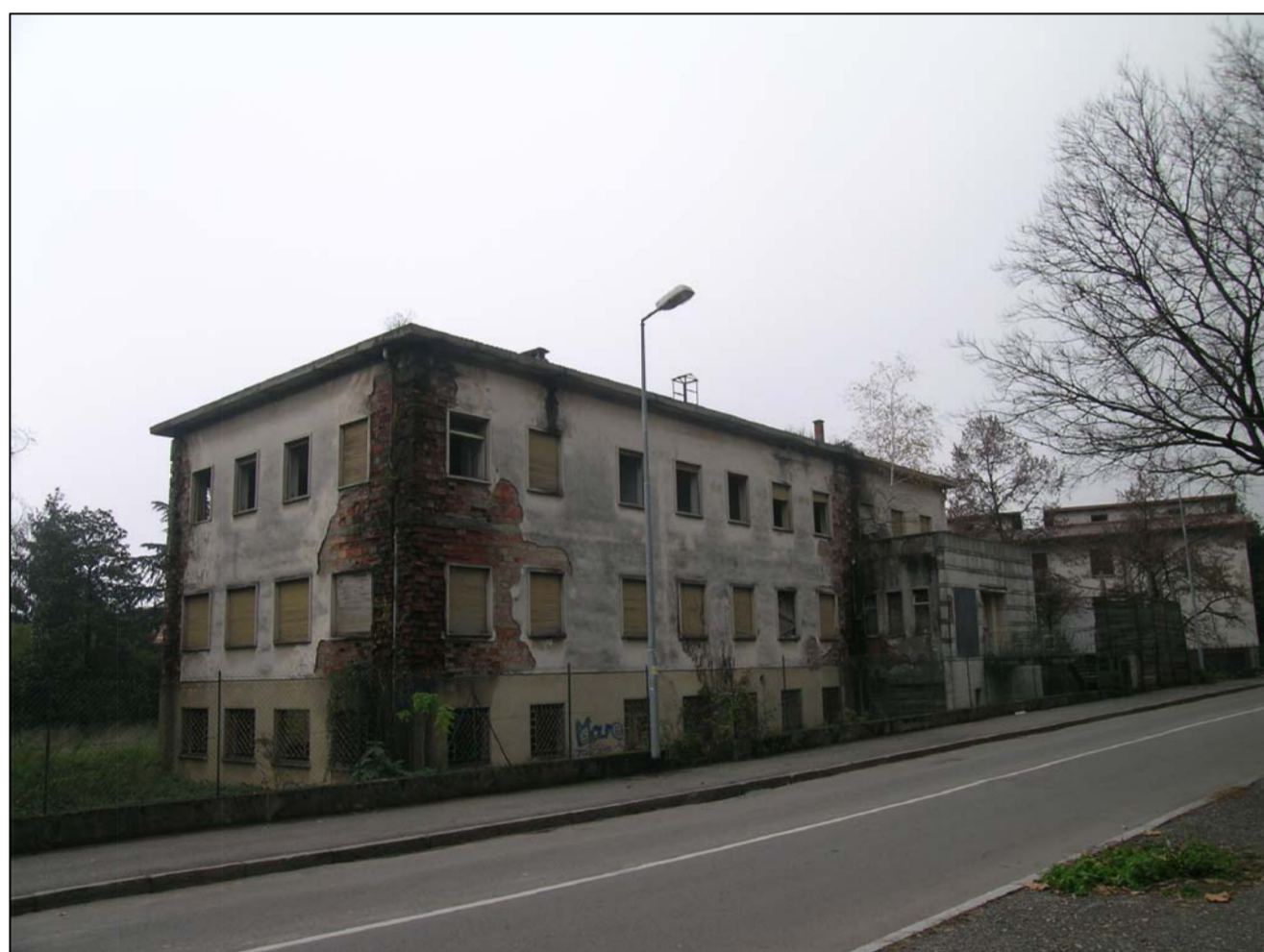
VISTA FOTOGRAFICA 3