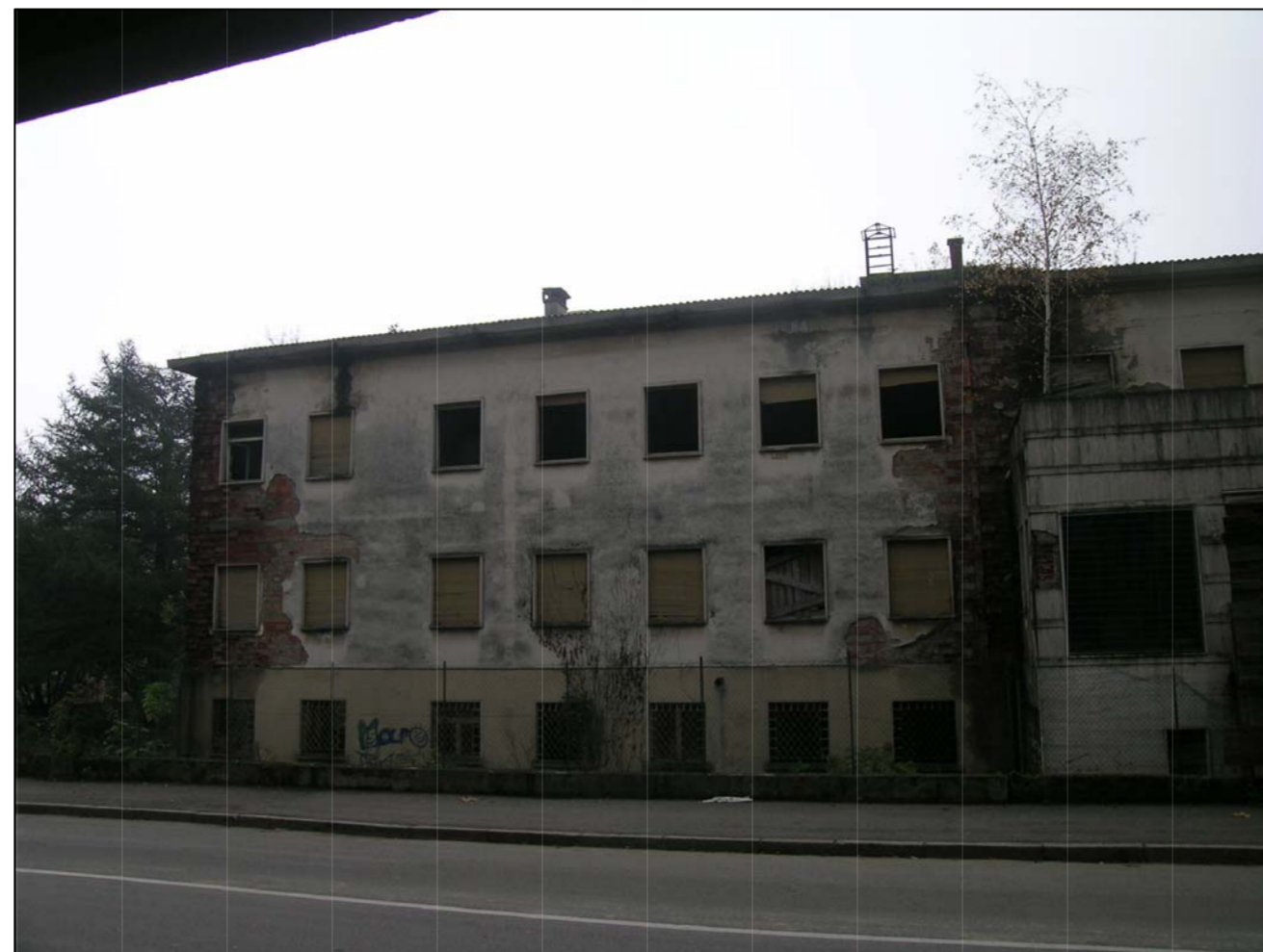
VISTA FOTOGRAFICA 2