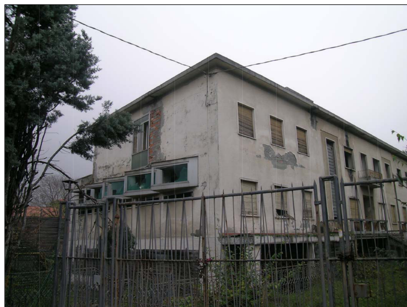
VISTA FOTOGRAFICA 6