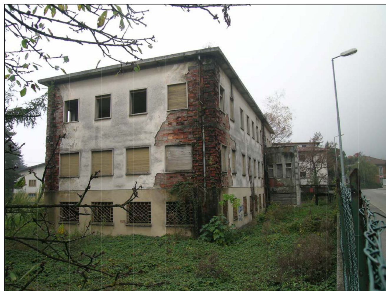
VISTA FOTOGRAFICA 4