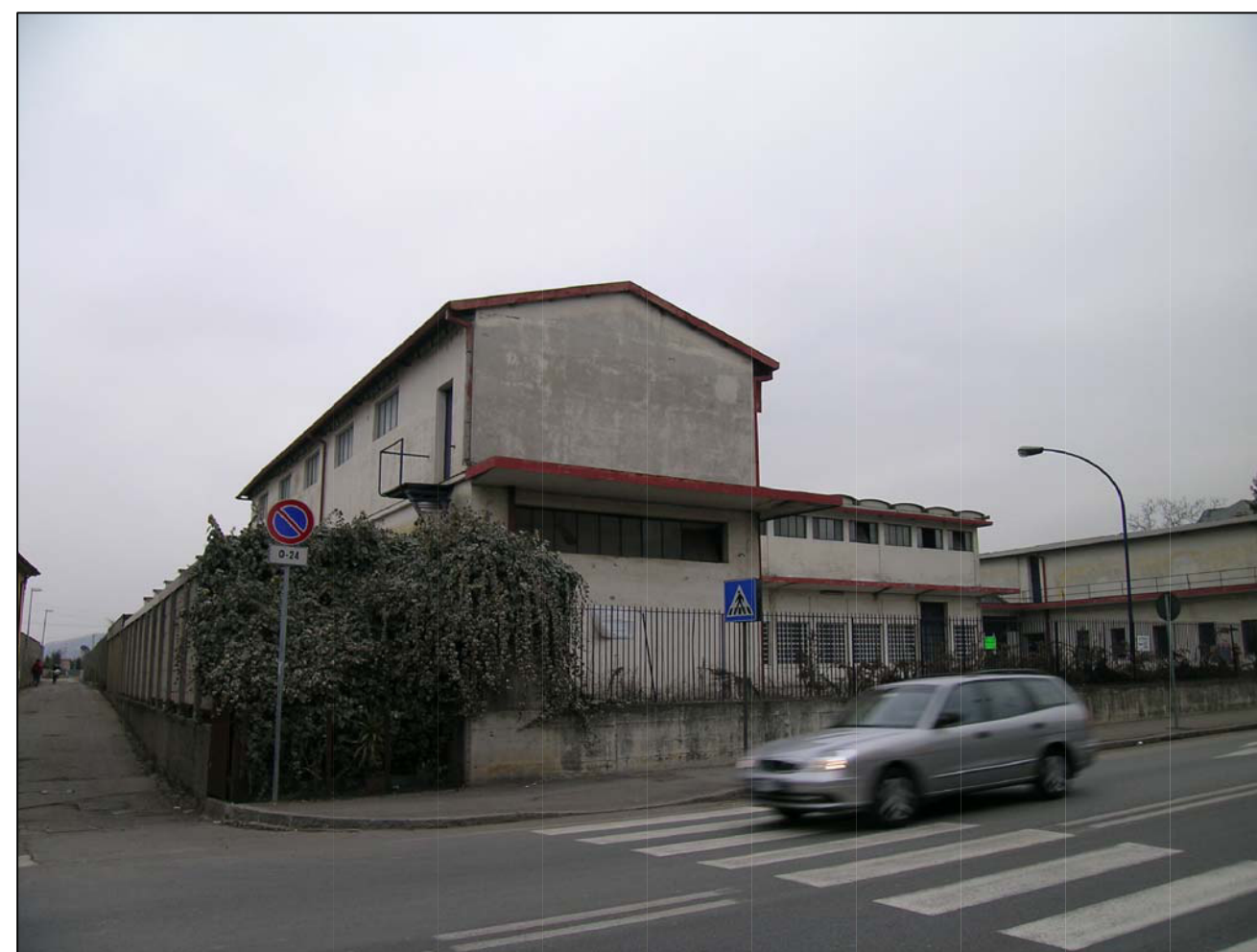
VISTA FOTOGRAFICA 4