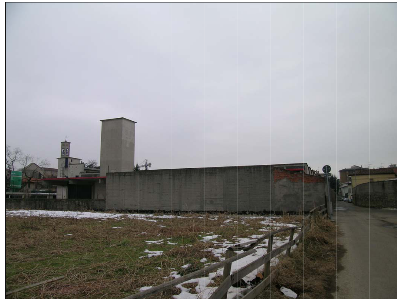
VISTA FOTOGRAFICA 2