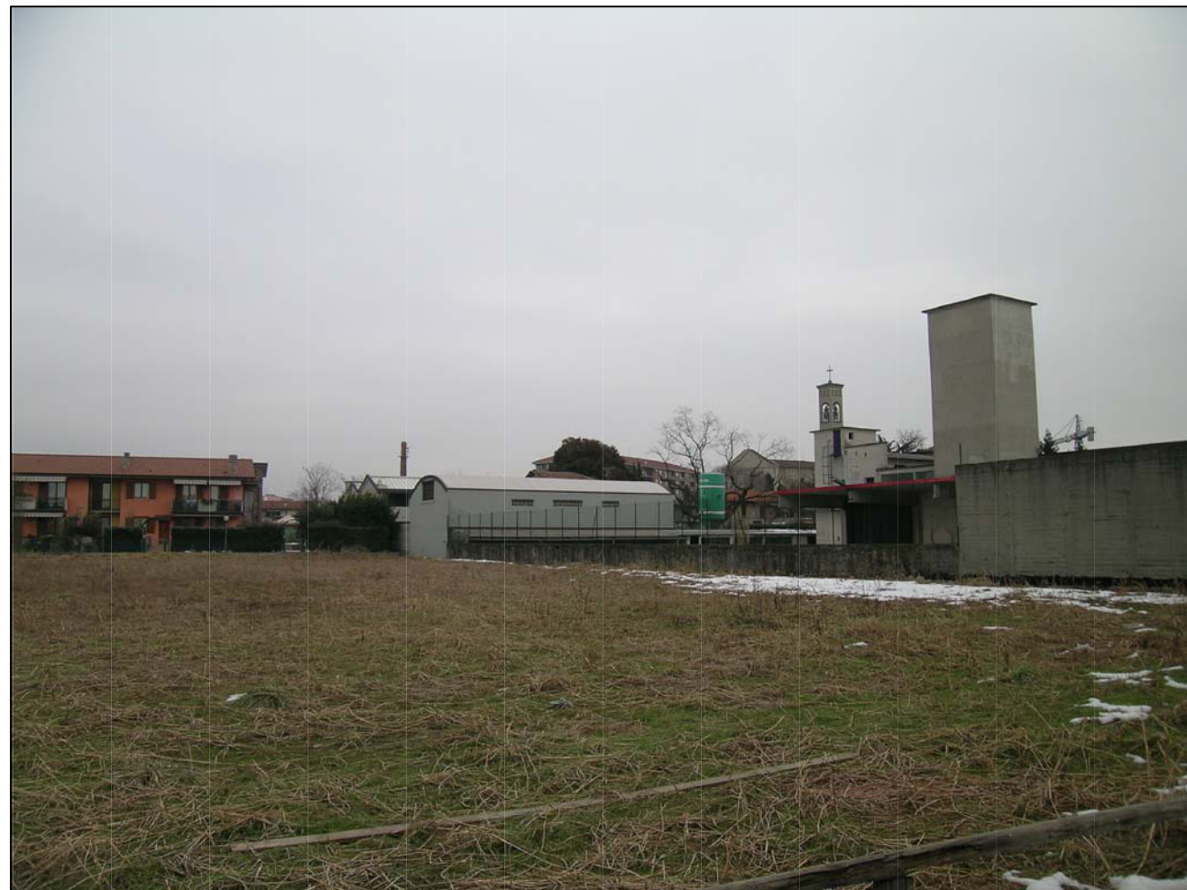
VISTA FOTOGRAFICA 1