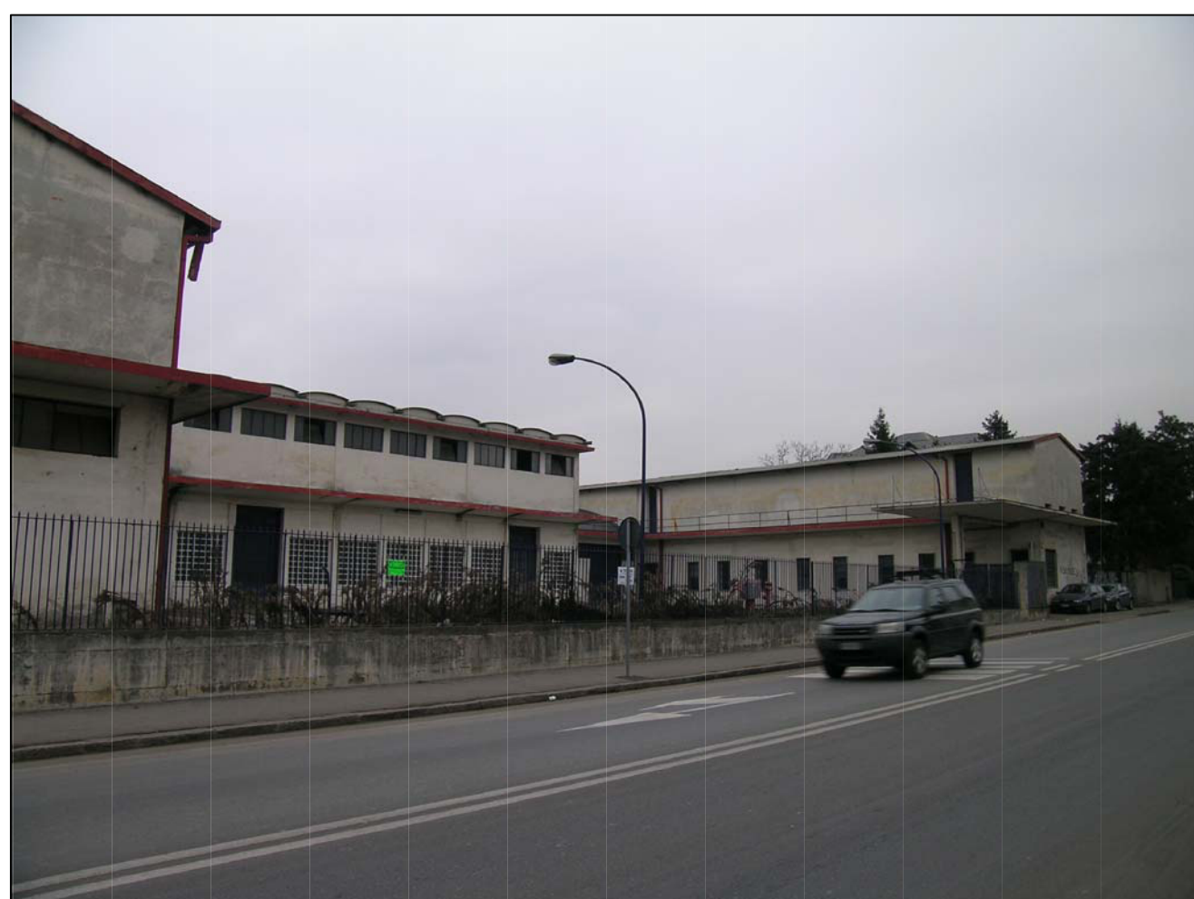
VISTA FOTOGRAFICA 5