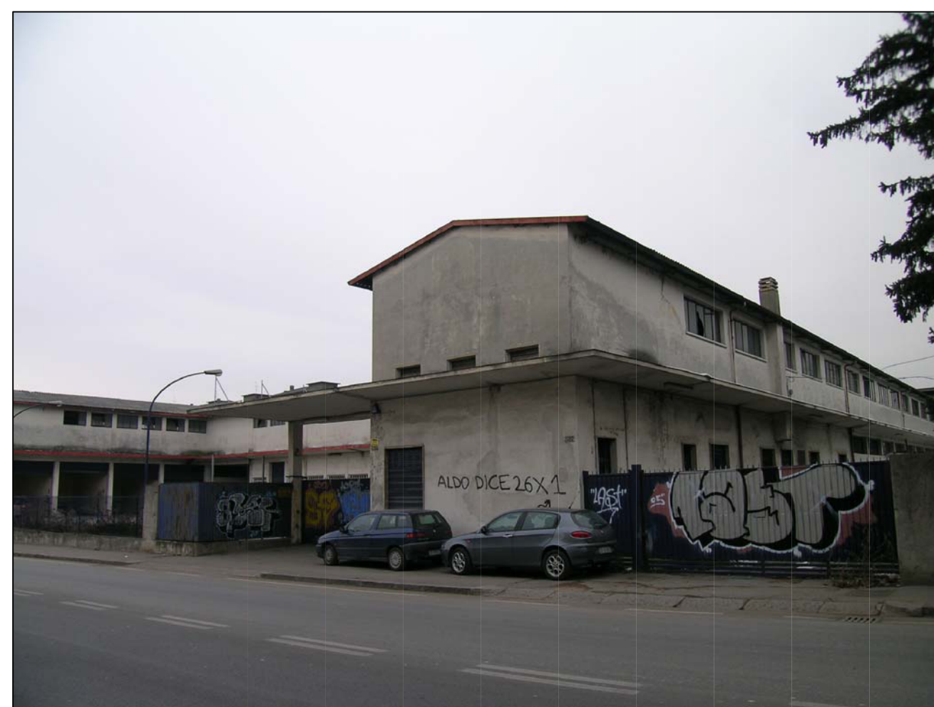
VISTA FOTOGRAFICA 6