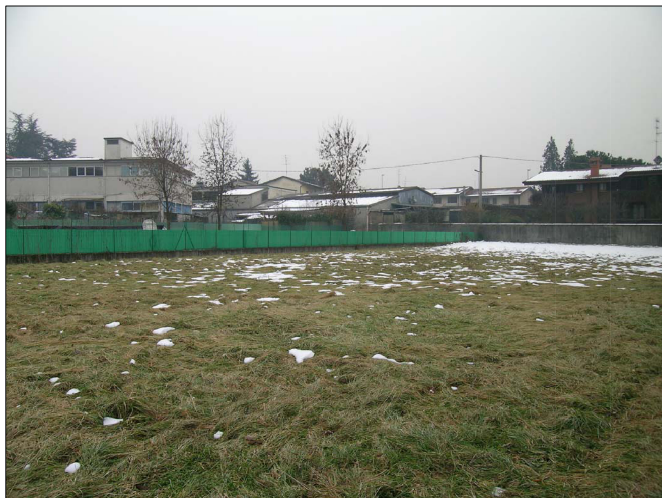
VISTA FOTOGRAFICA 5