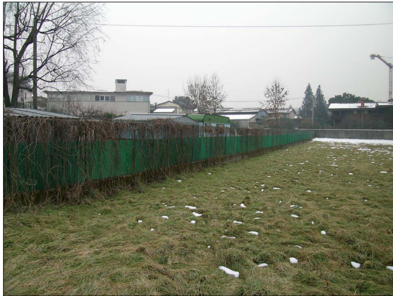
VISTA FOTOGRAFICA 3