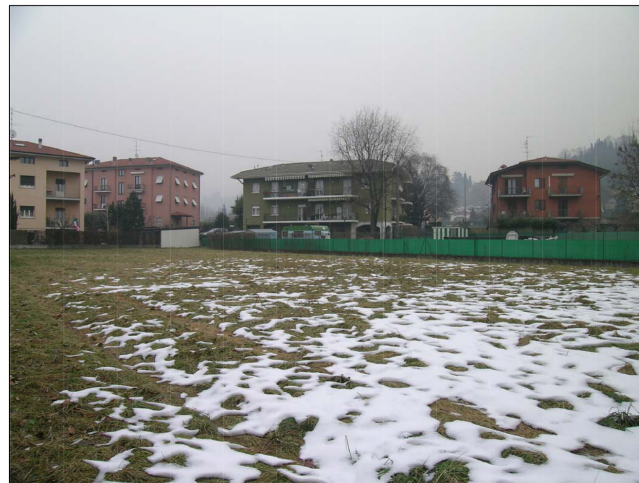
VISTA FOTOGRAFICA 6