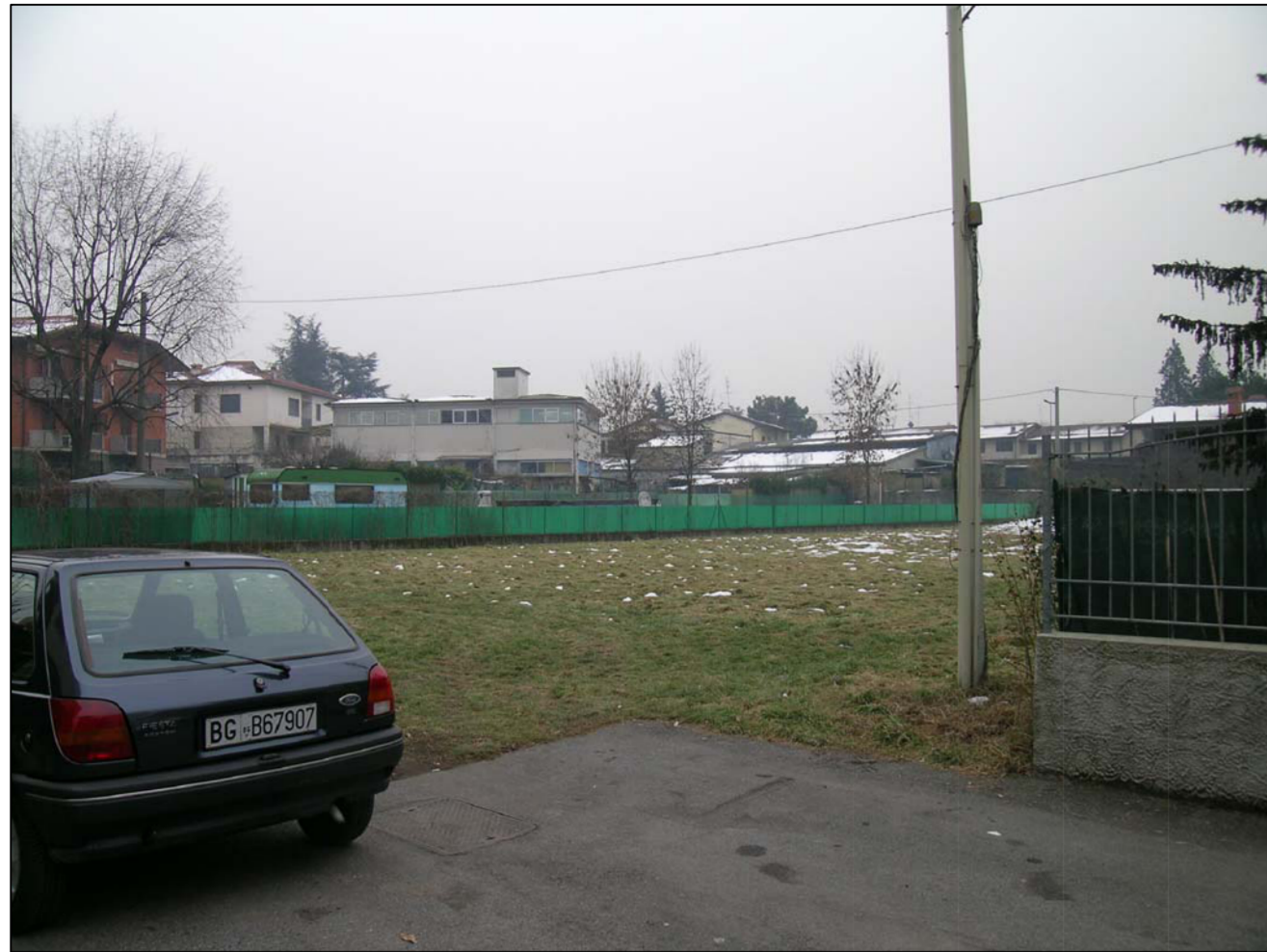
VISTA FOTOGRAFICA 1