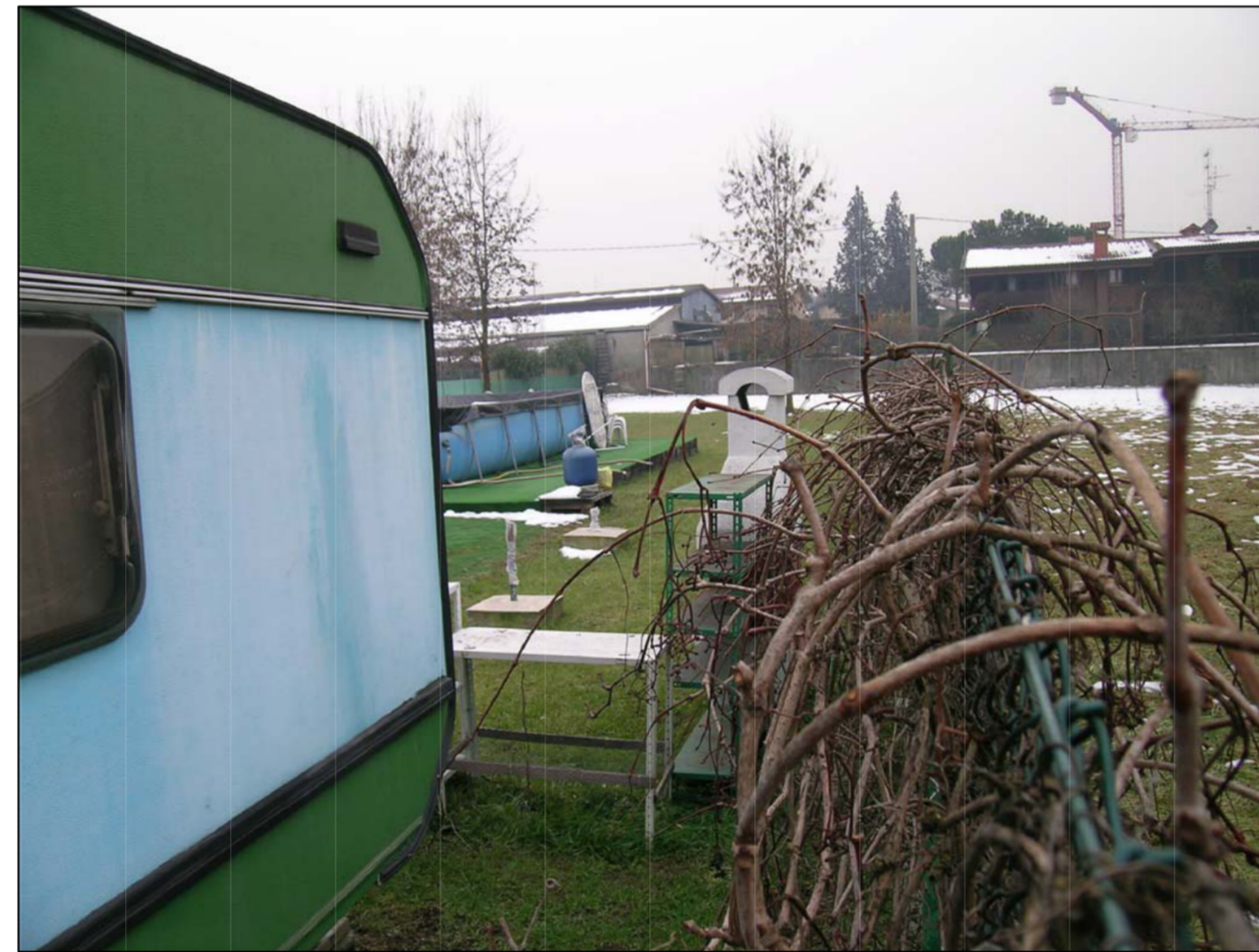
VISTA FOTOGRAFICA 4