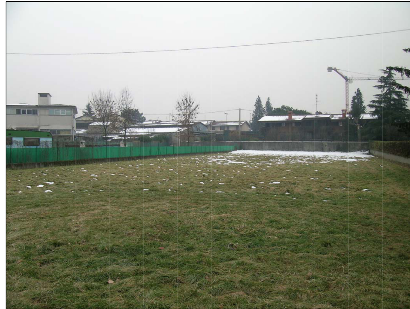
VISTA FOTOGRAFICA 2