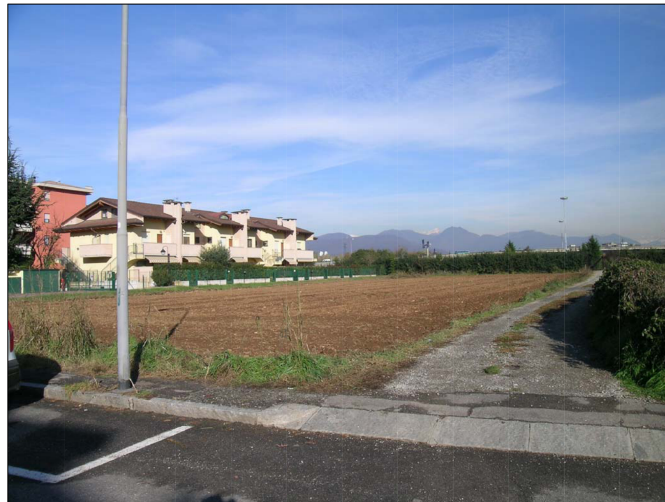
VISTA FOTOGRAFICA 4