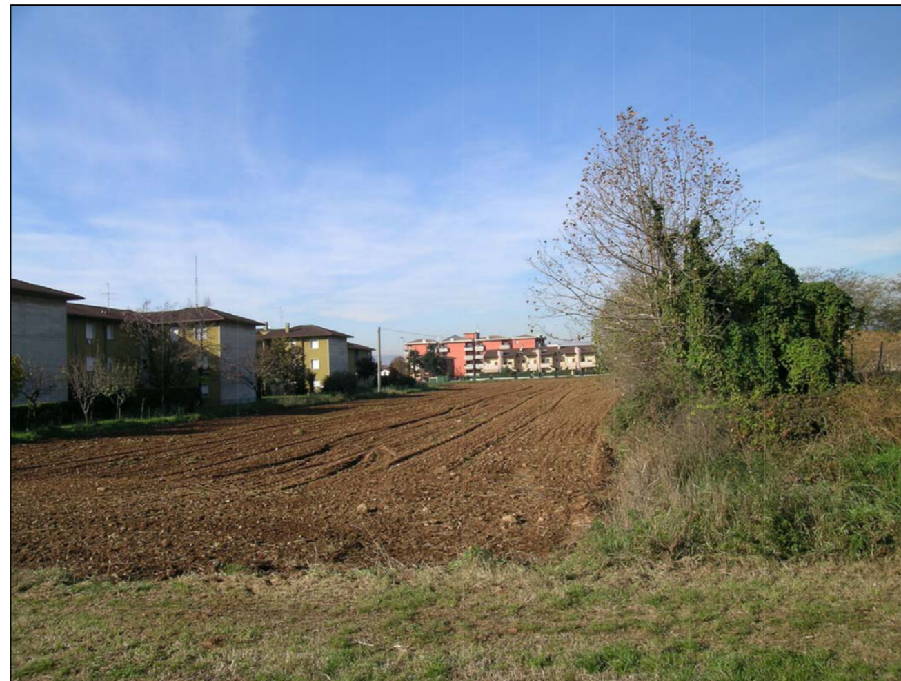
VISTA FOTOGRAFICA 2