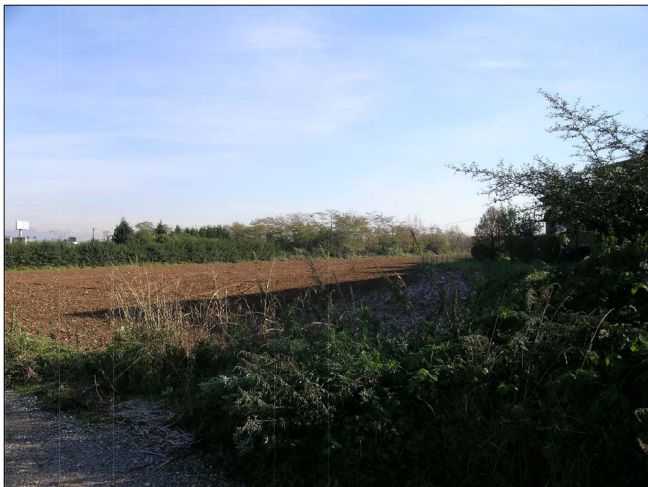
VISTA FOTOGRAFICA 5