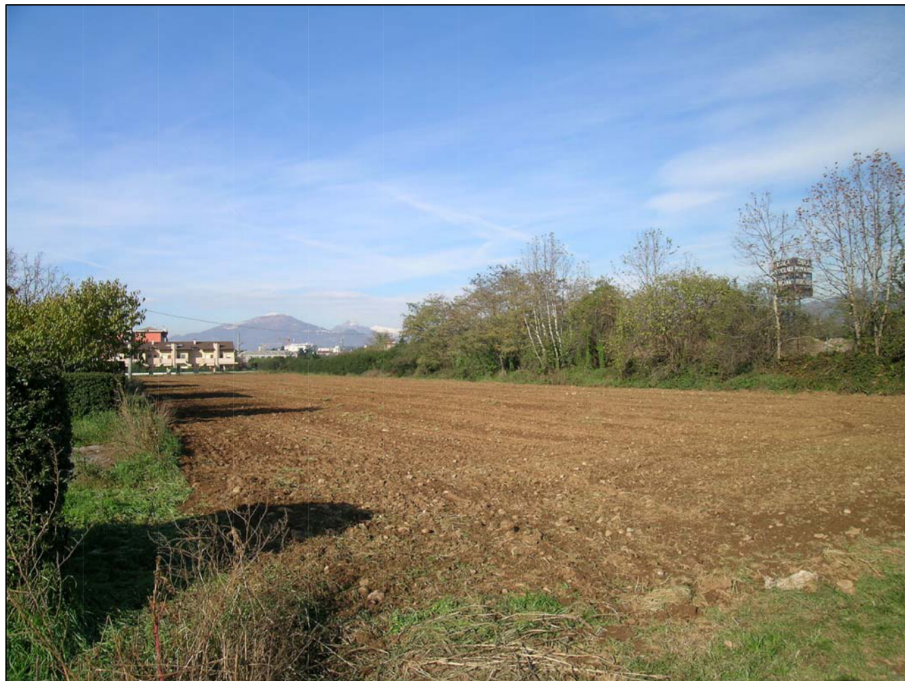
VISTA FOTOGRAFICA 1