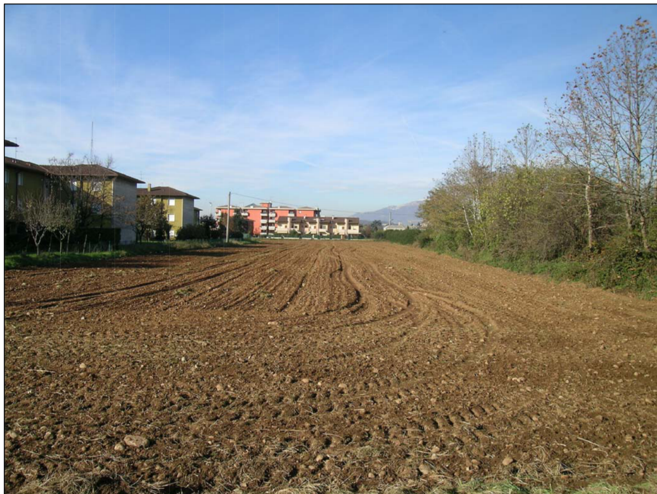
VISTA FOTOGRAFICA 3