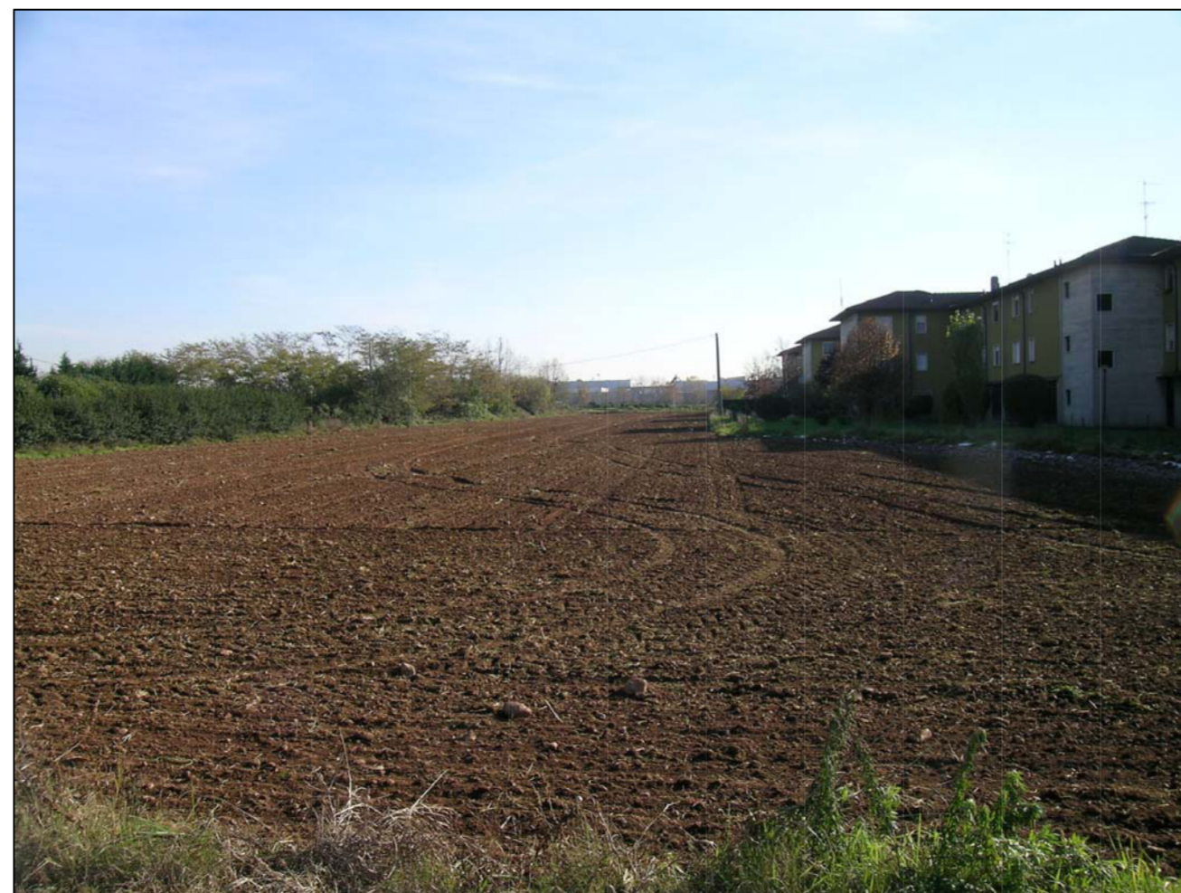
VISTA FOTOGRAFICA 6