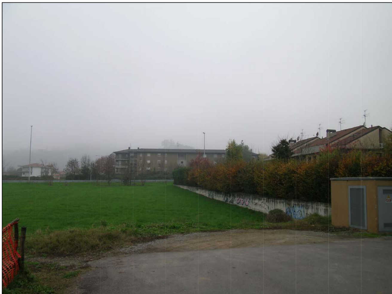
VISTA FOTOGRAFICA 1