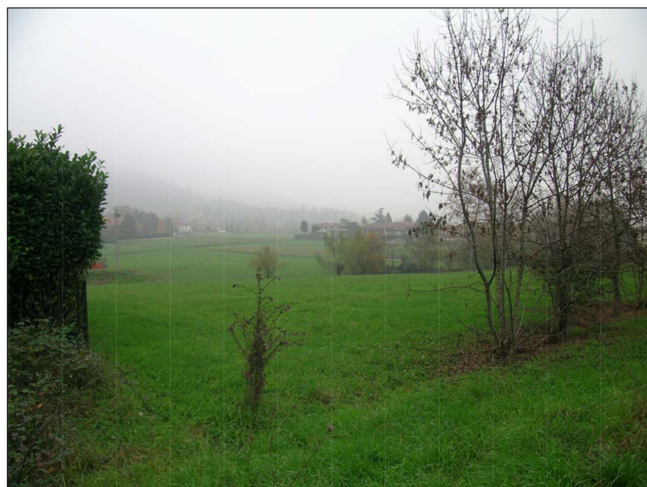
VISTA FOTOGRAFICA 6