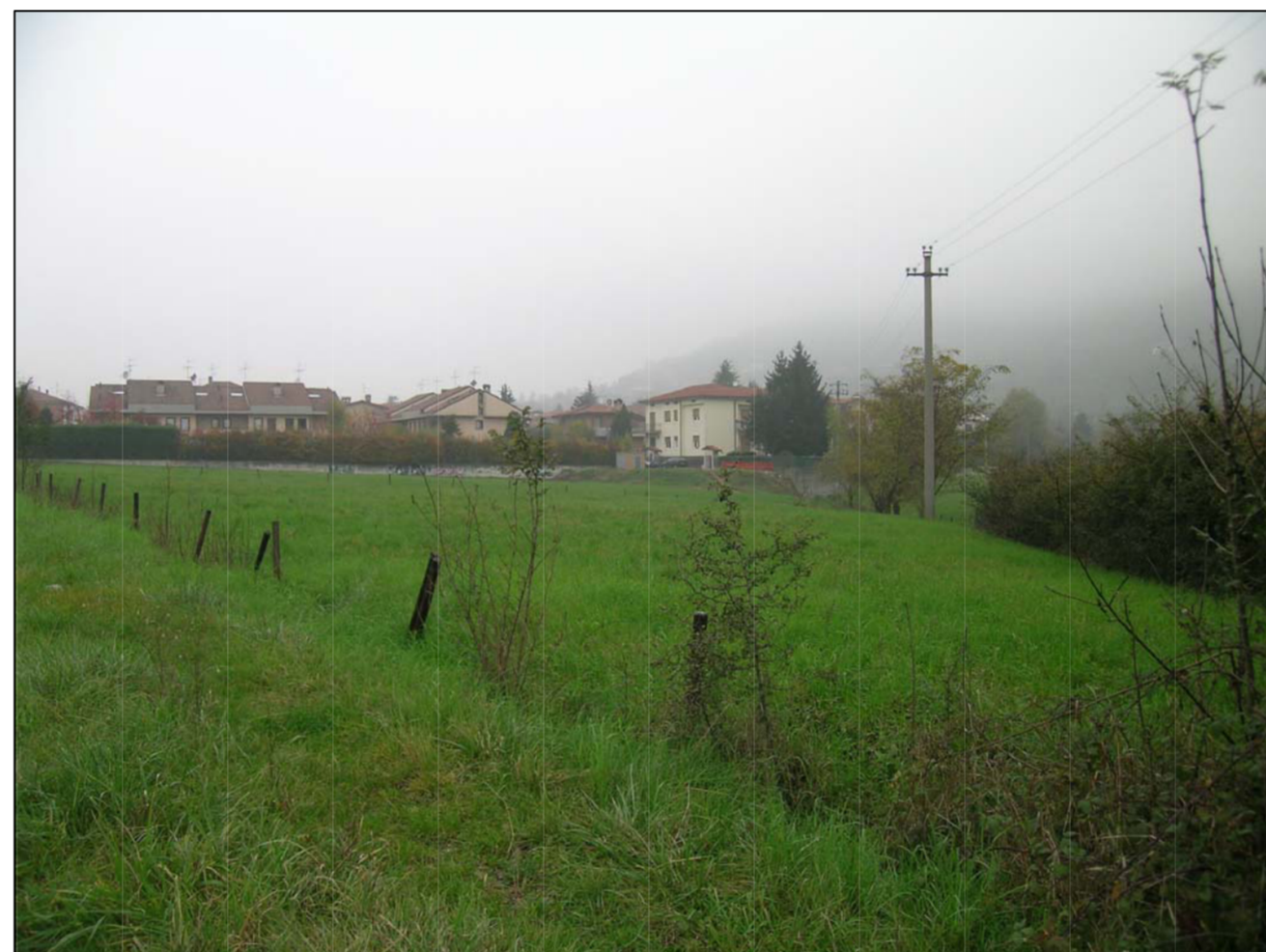
VISTA FOTOGRAFICA 4