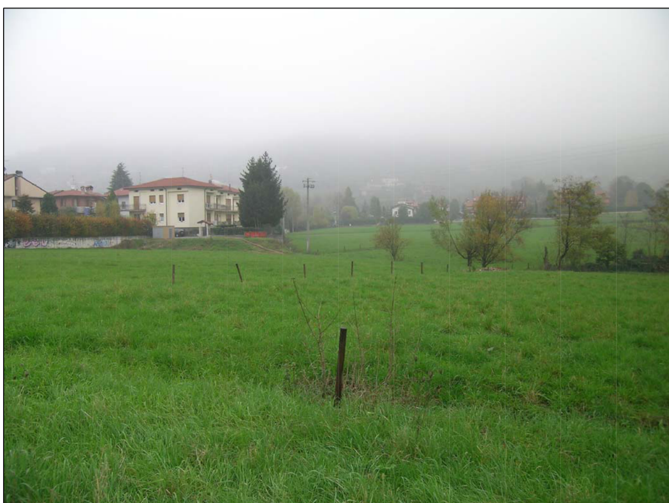
VISTA FOTOGRAFICA 5