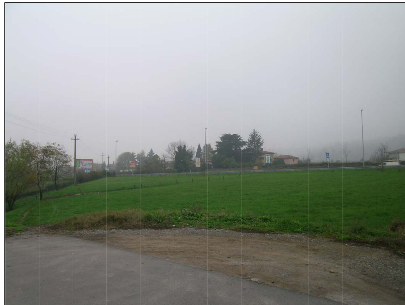
VISTA FOTOGRAFICA 2