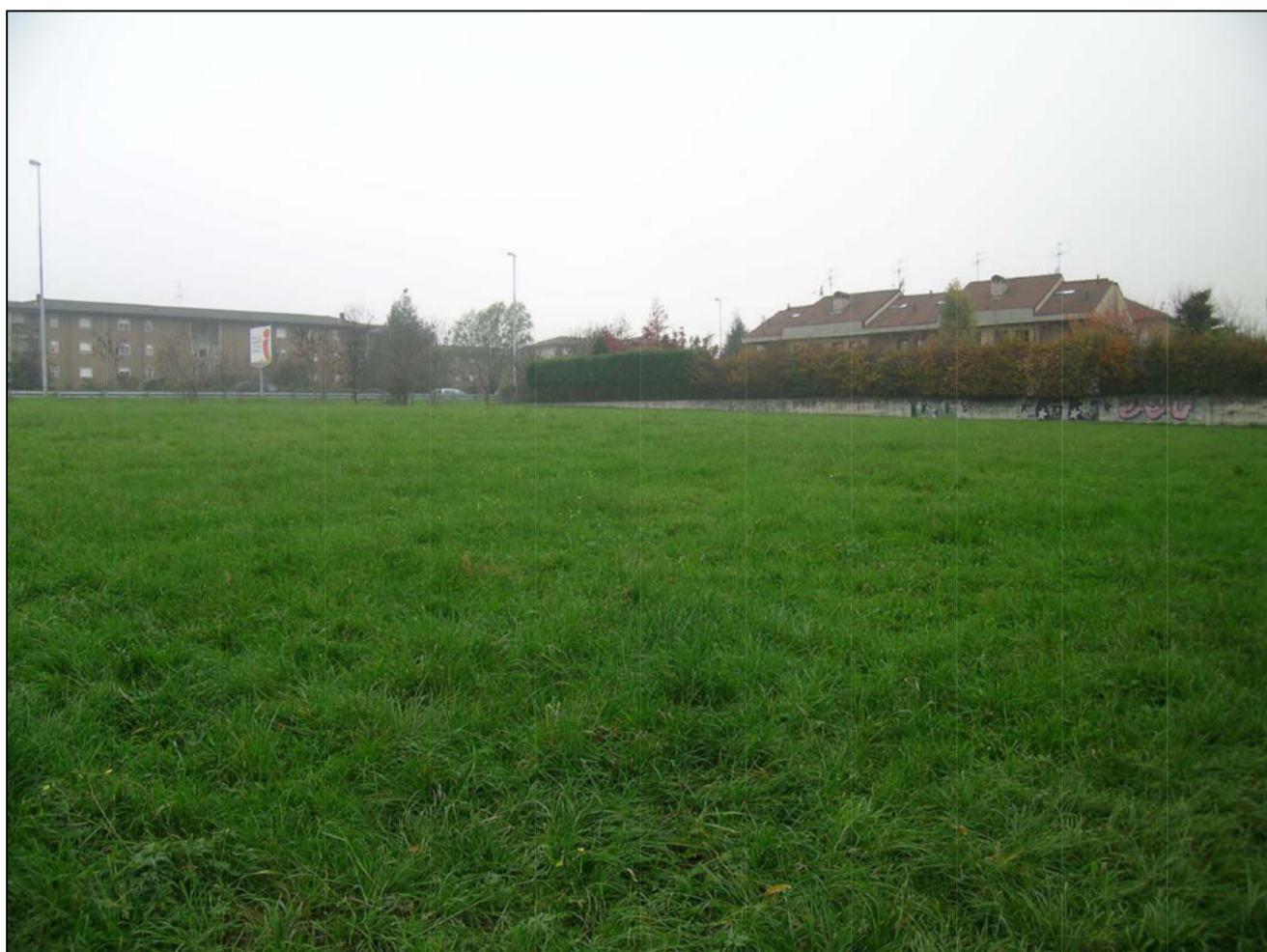
VISTA FOTOGRAFICA 3