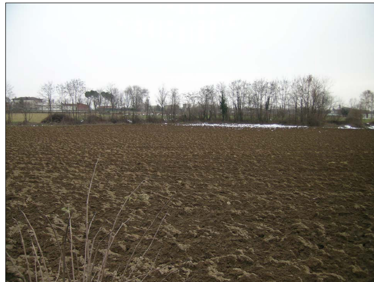
VISTA FOTOGRAFICA 6