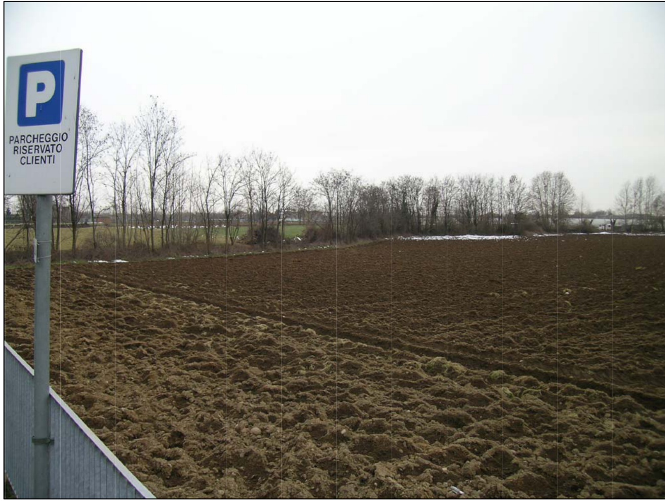
VISTA FOTOGRAFICA 1