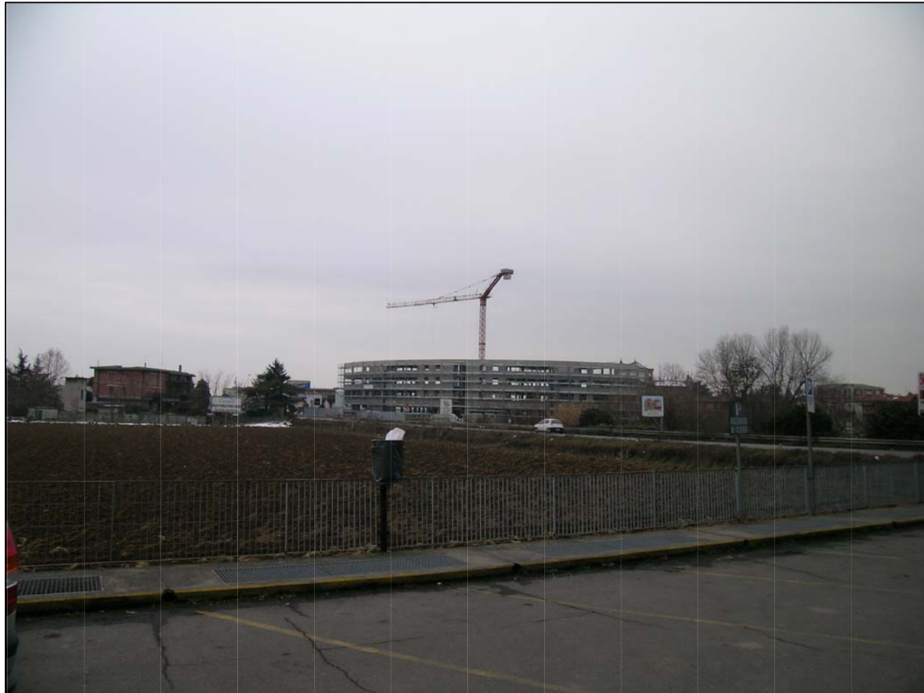
VISTA FOTOGRAFICA 3