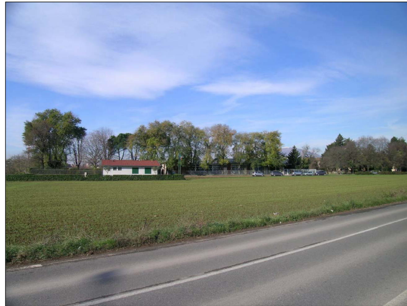
VISTA FOTOGRAFICA 4