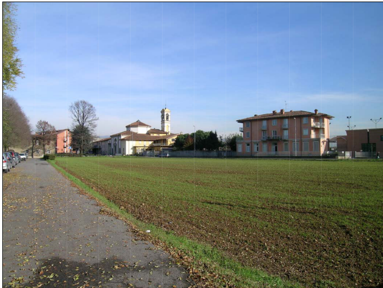
VISTA FOTOGRAFICA 3