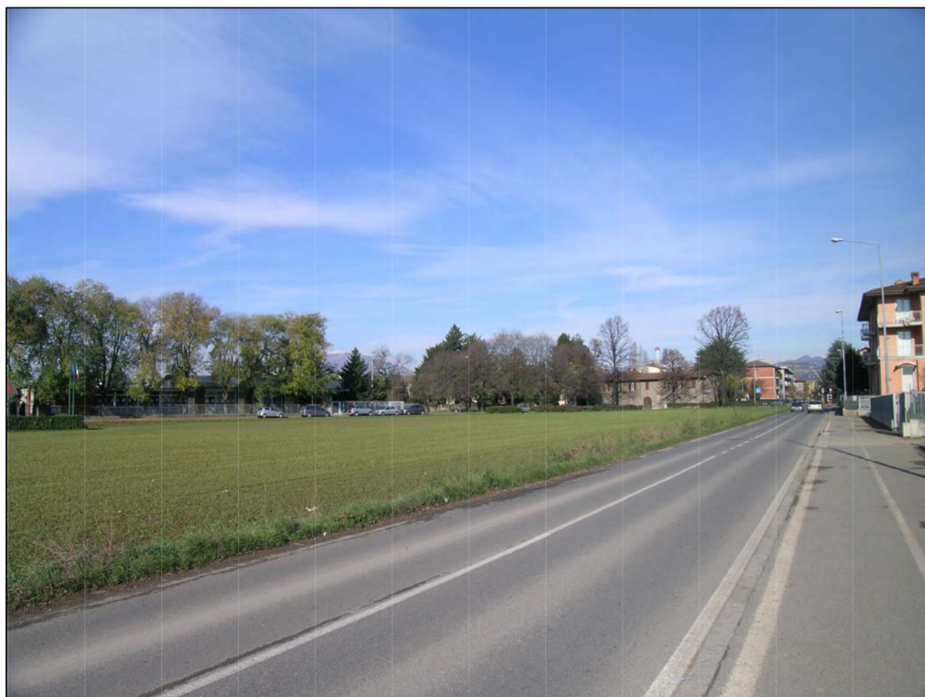
VISTA FOTOGRAFICA 5