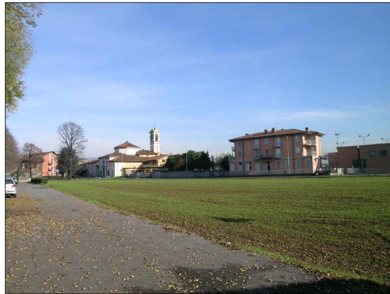
VISTA FOTOGRAFICA 2