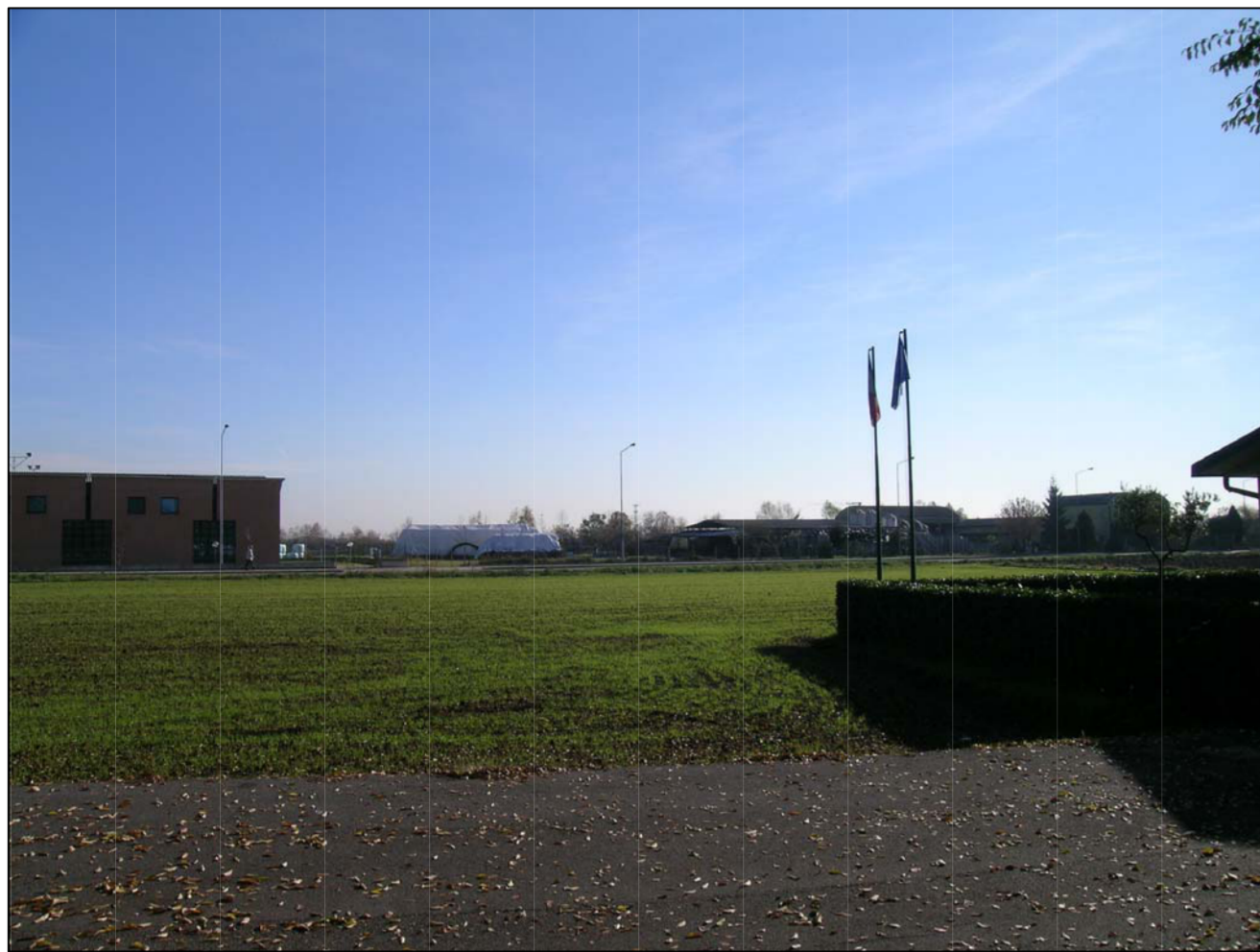
VISTA FOTOGRAFICA 1