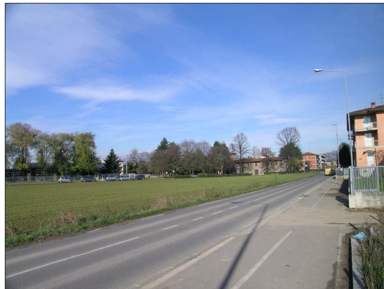
VISTA FOTOGRAFICA 6