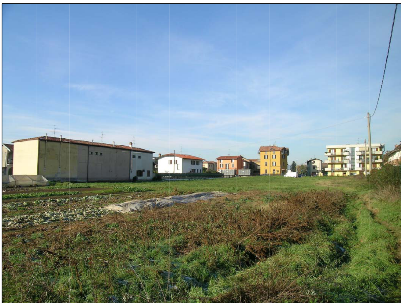
VISTA FOTOGRAFICA 5