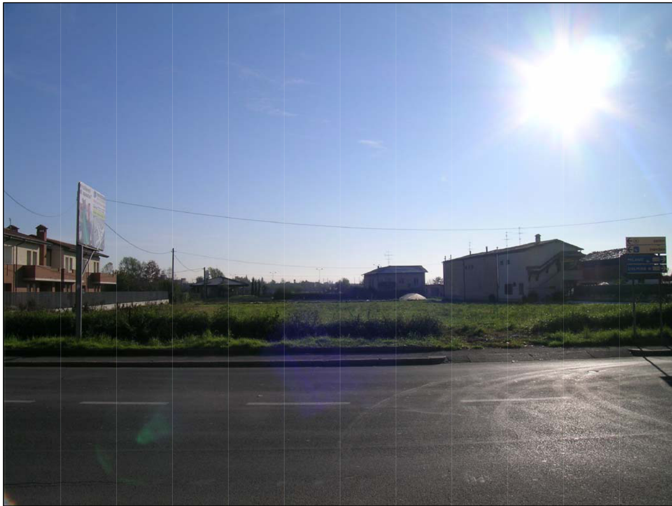
VISTA FOTOGRAFICA 1