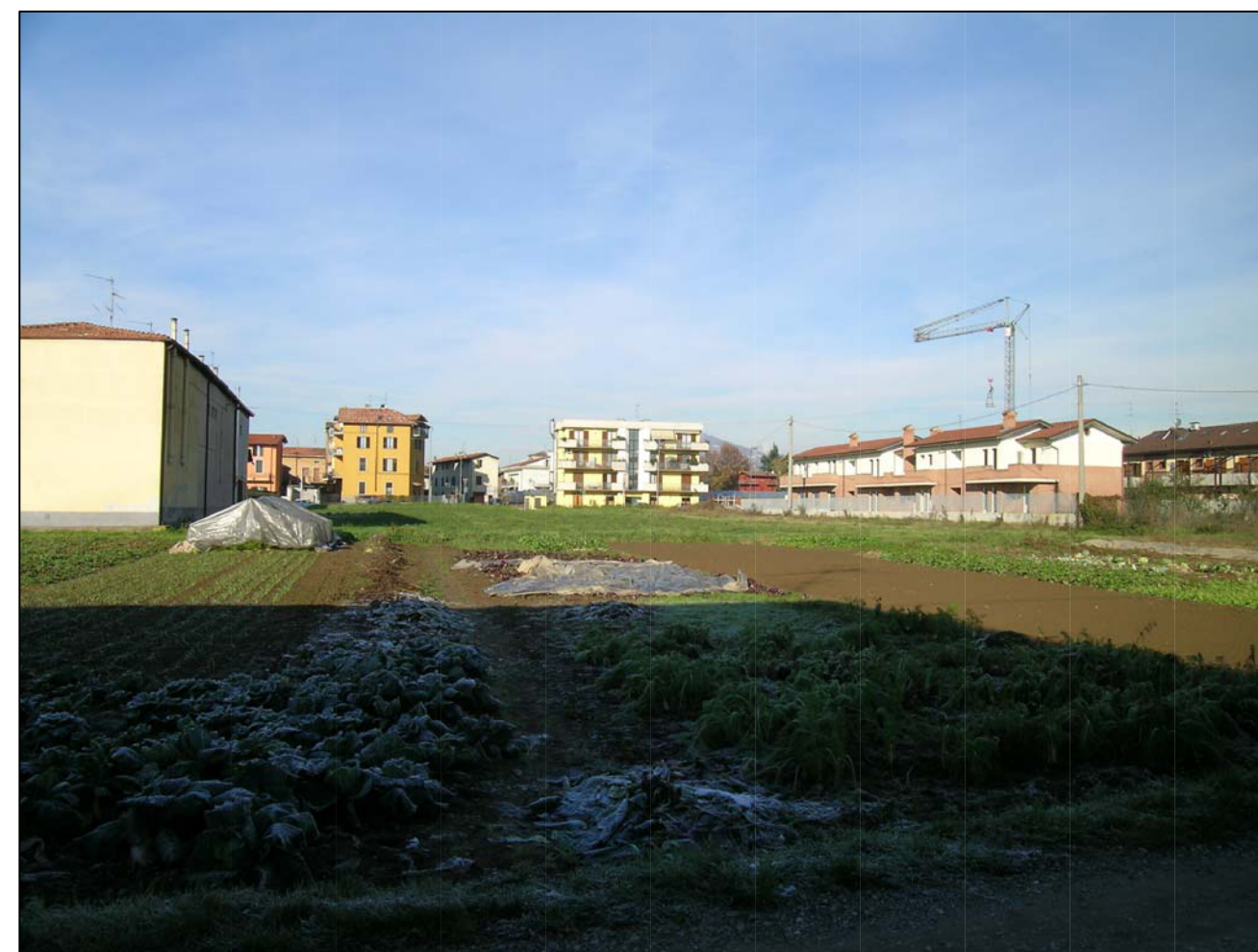
VISTA FOTOGRAFICA 6