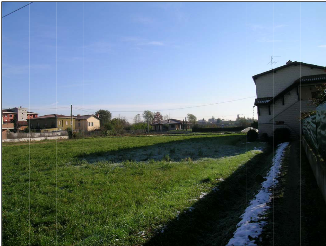
VISTA FOTOGRAFICA 3