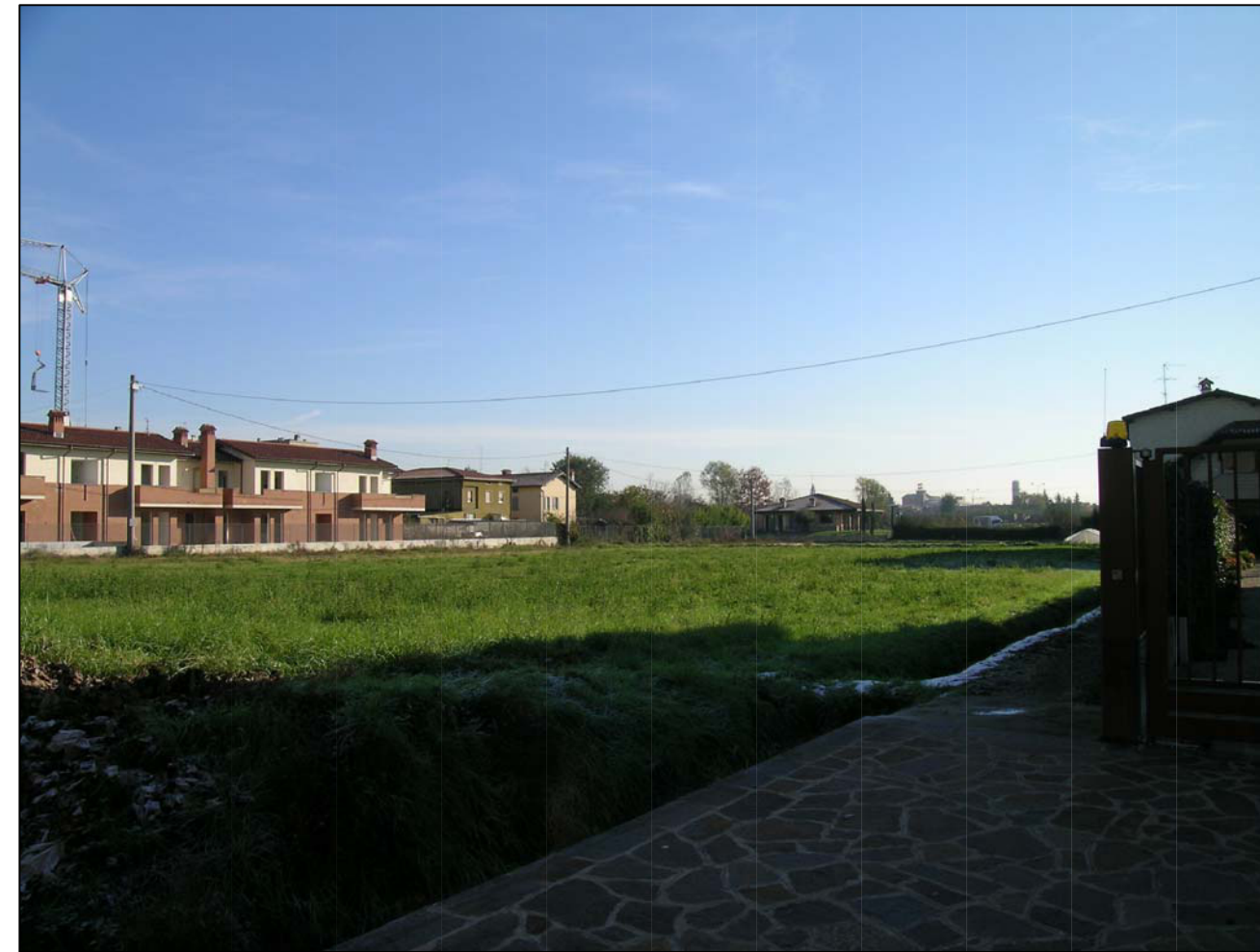
VISTA FOTOGRAFICA 2