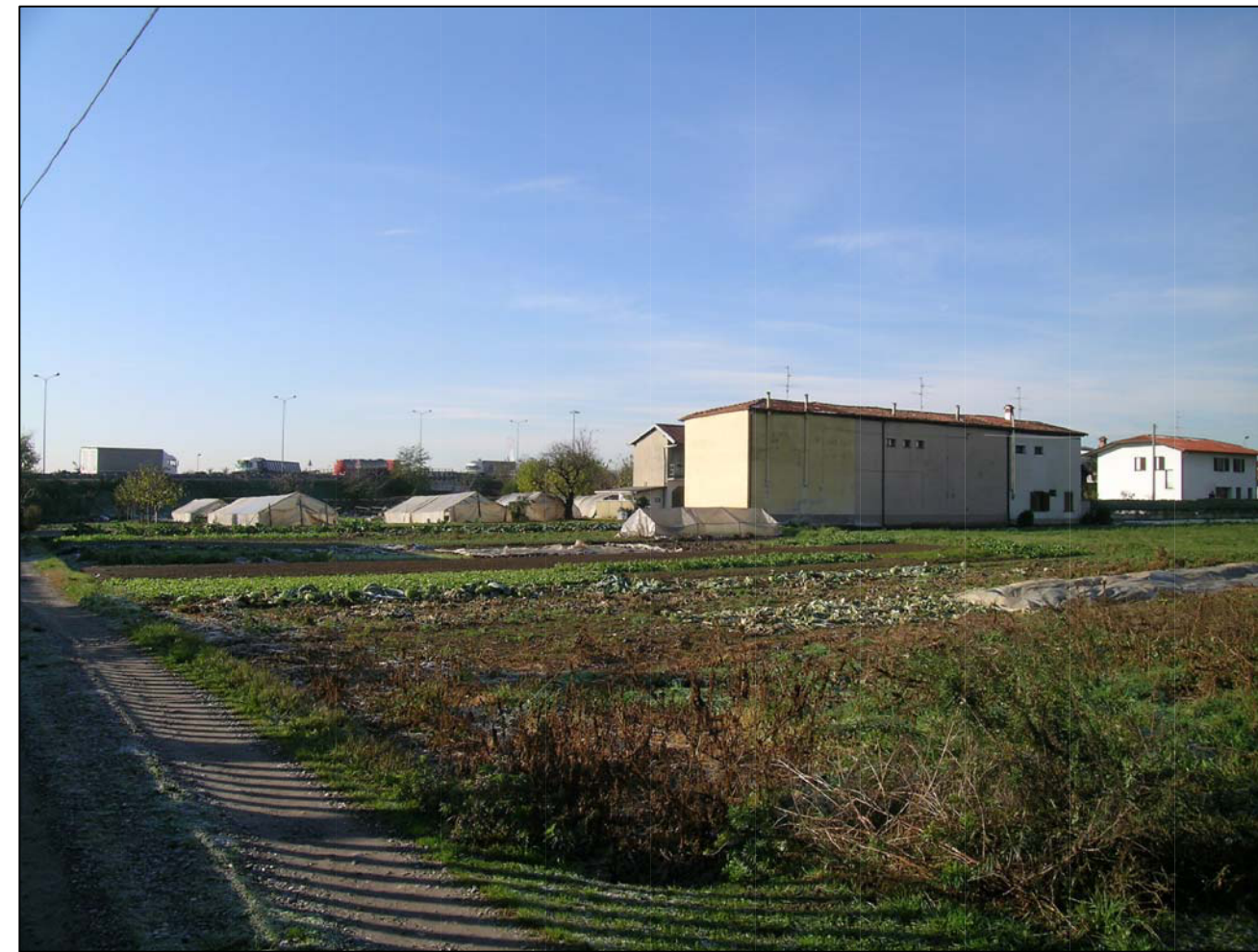
VISTA FOTOGRAFICA 4