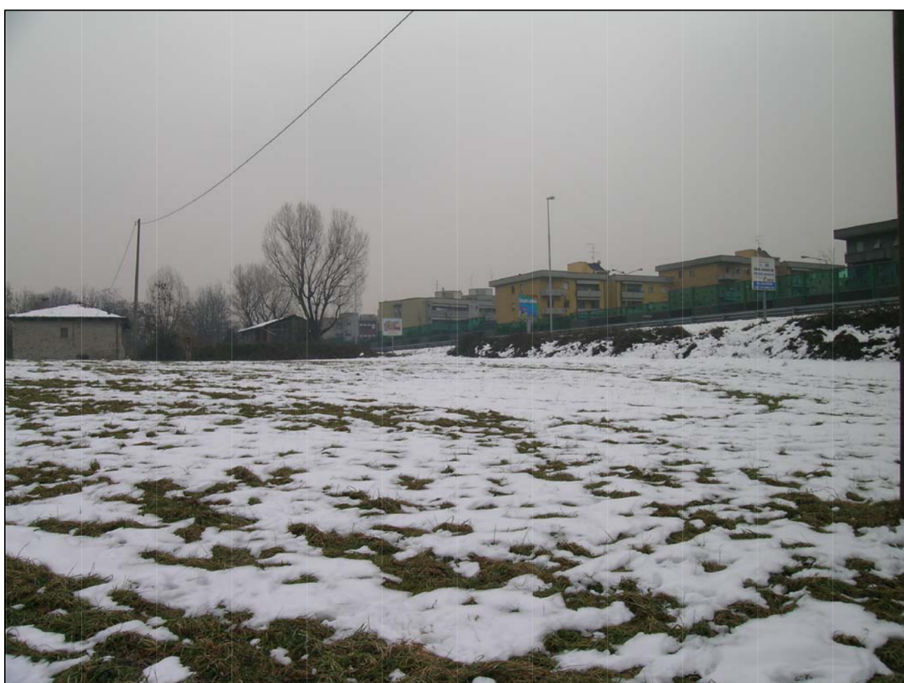
VISTA FOTOGRAFICA 5