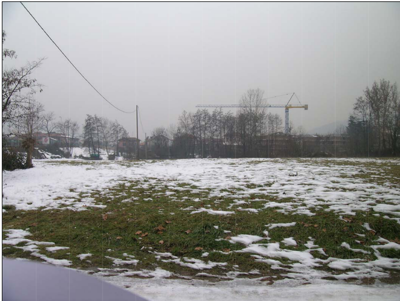
VISTA FOTOGRAFICA 3