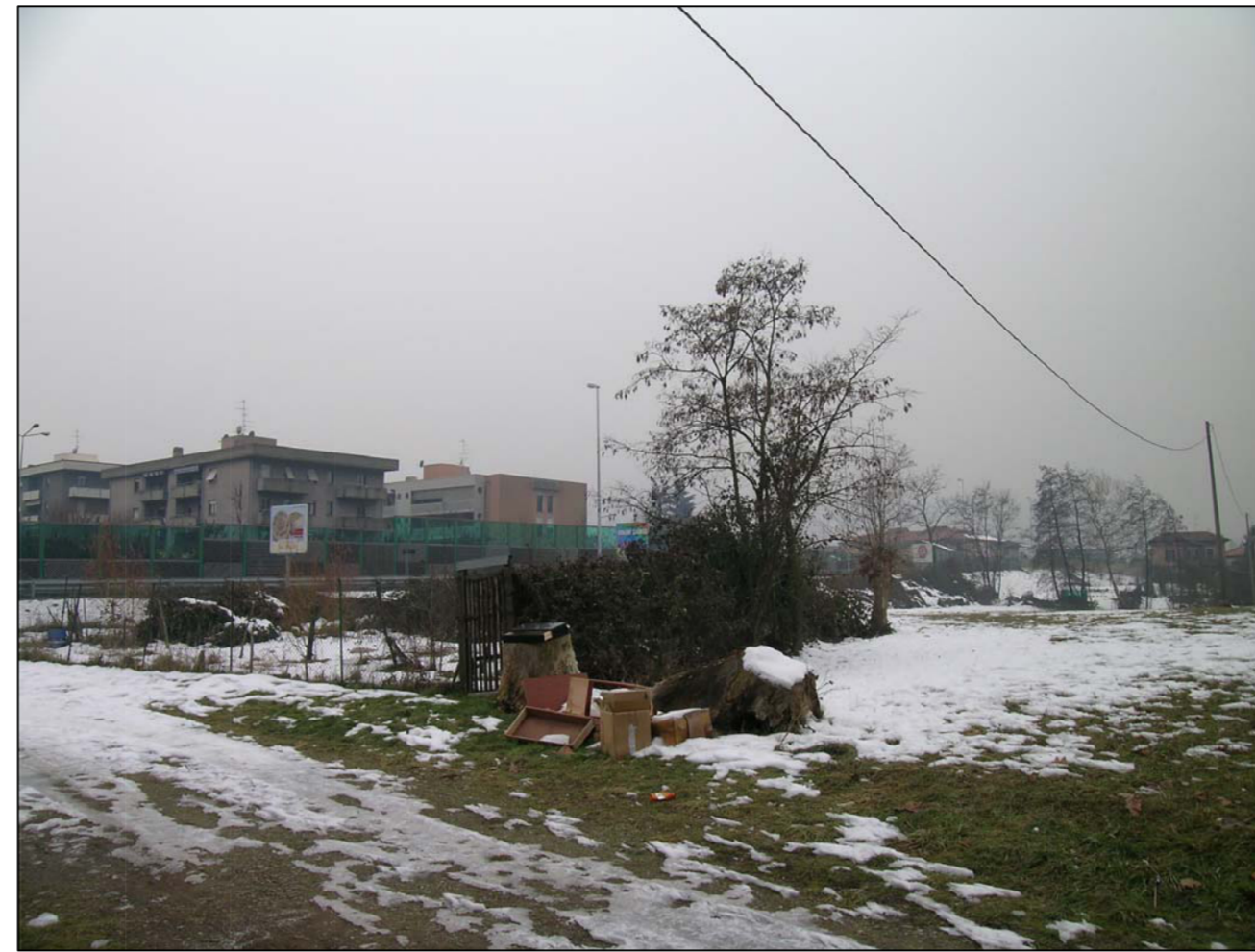
VISTA FOTOGRAFICA 2