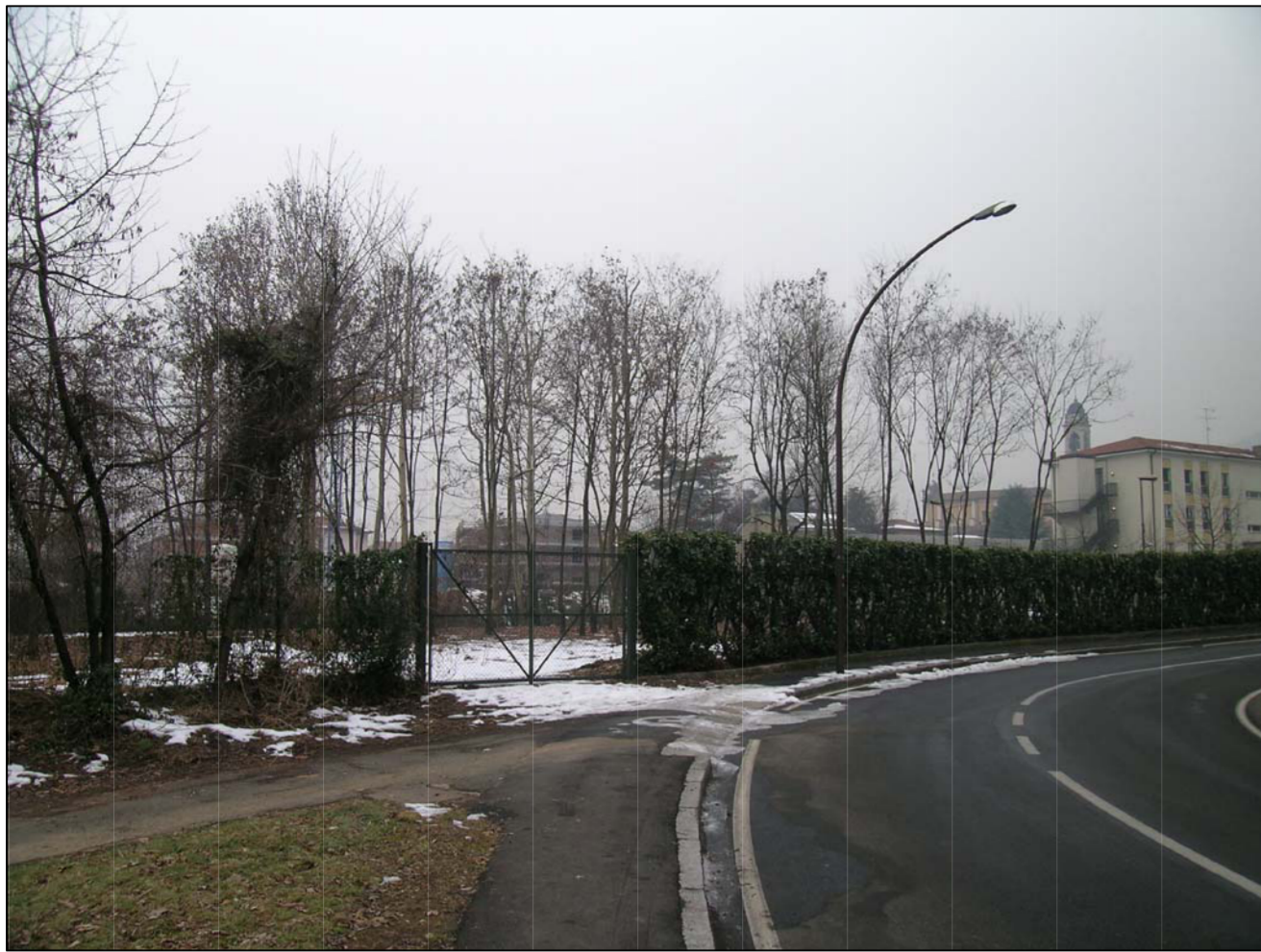
VISTA FOTOGRAFICA 1