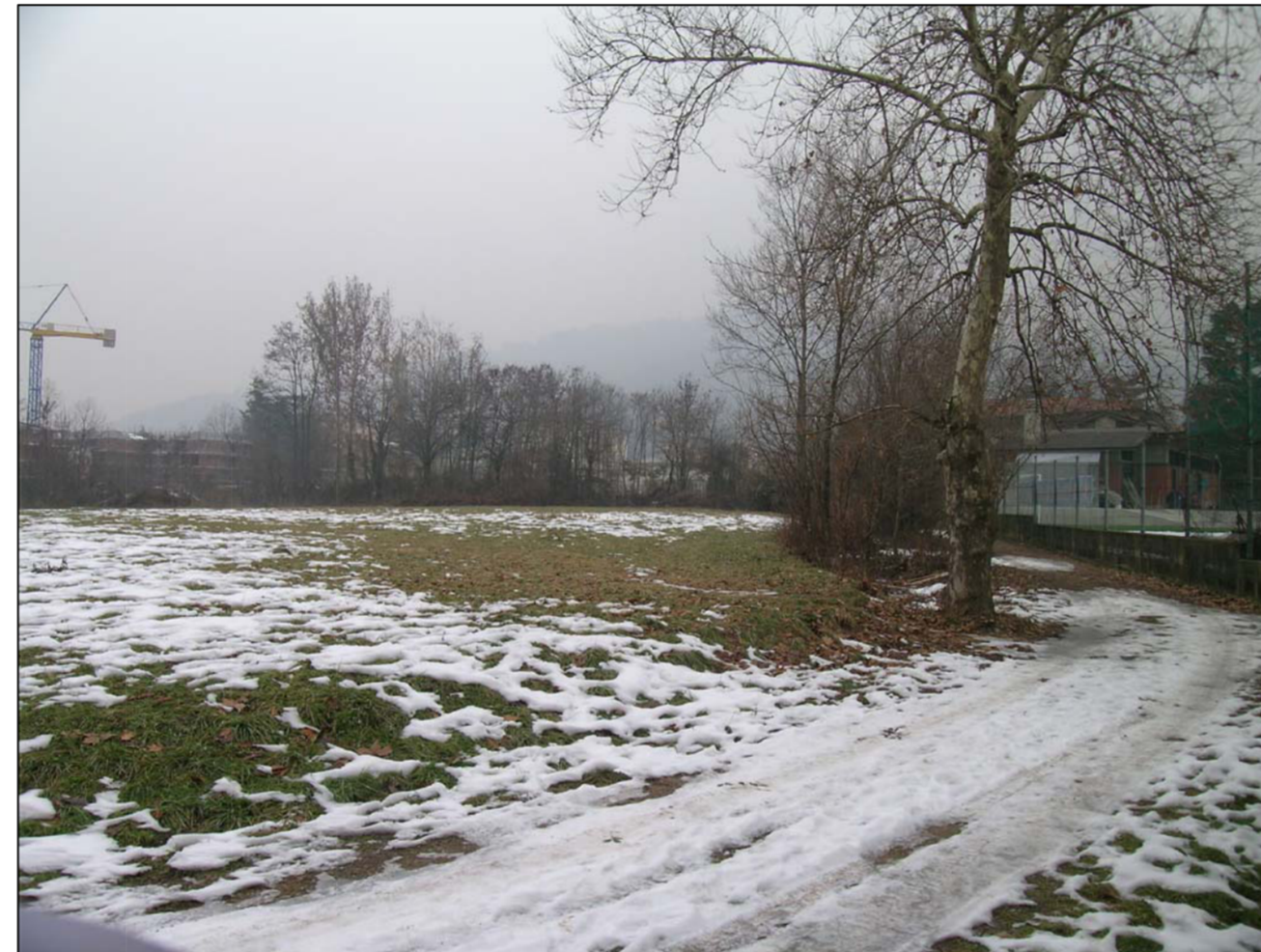
VISTA FOTOGRAFICA 4