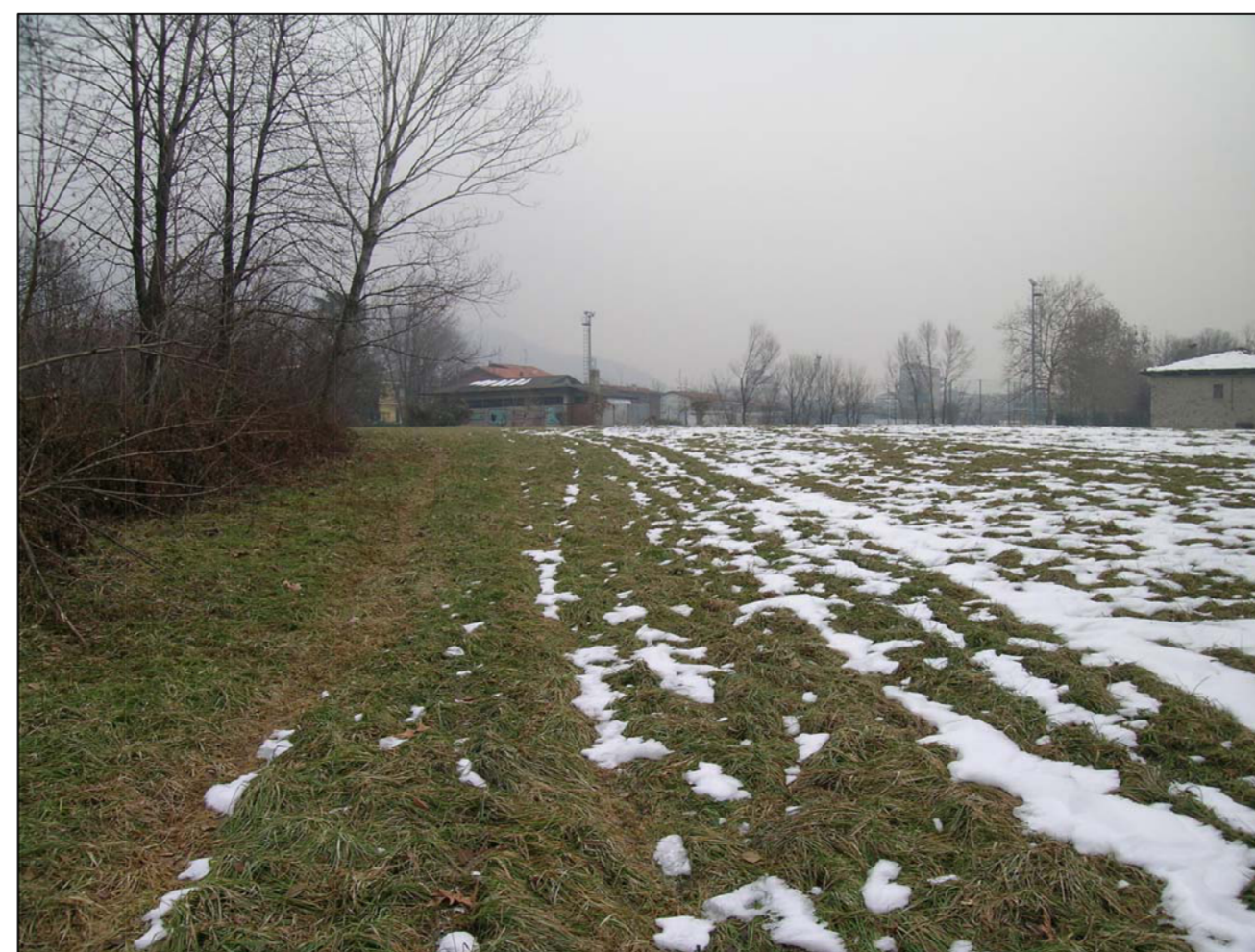
VISTA FOTOGRAFICA 6