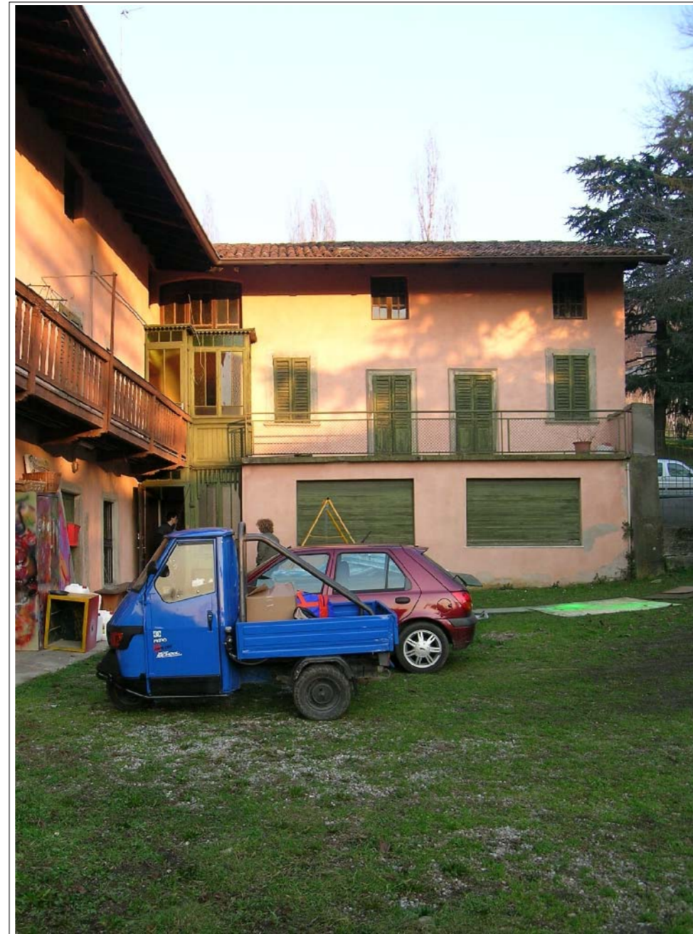
VISTA FOTOGRAFICA 2