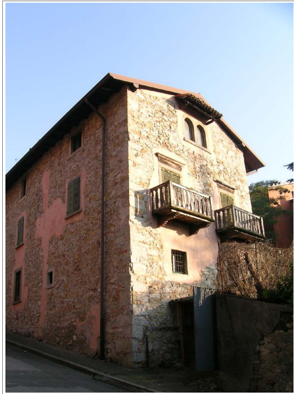
VISTA FOTOGRAFICA 1