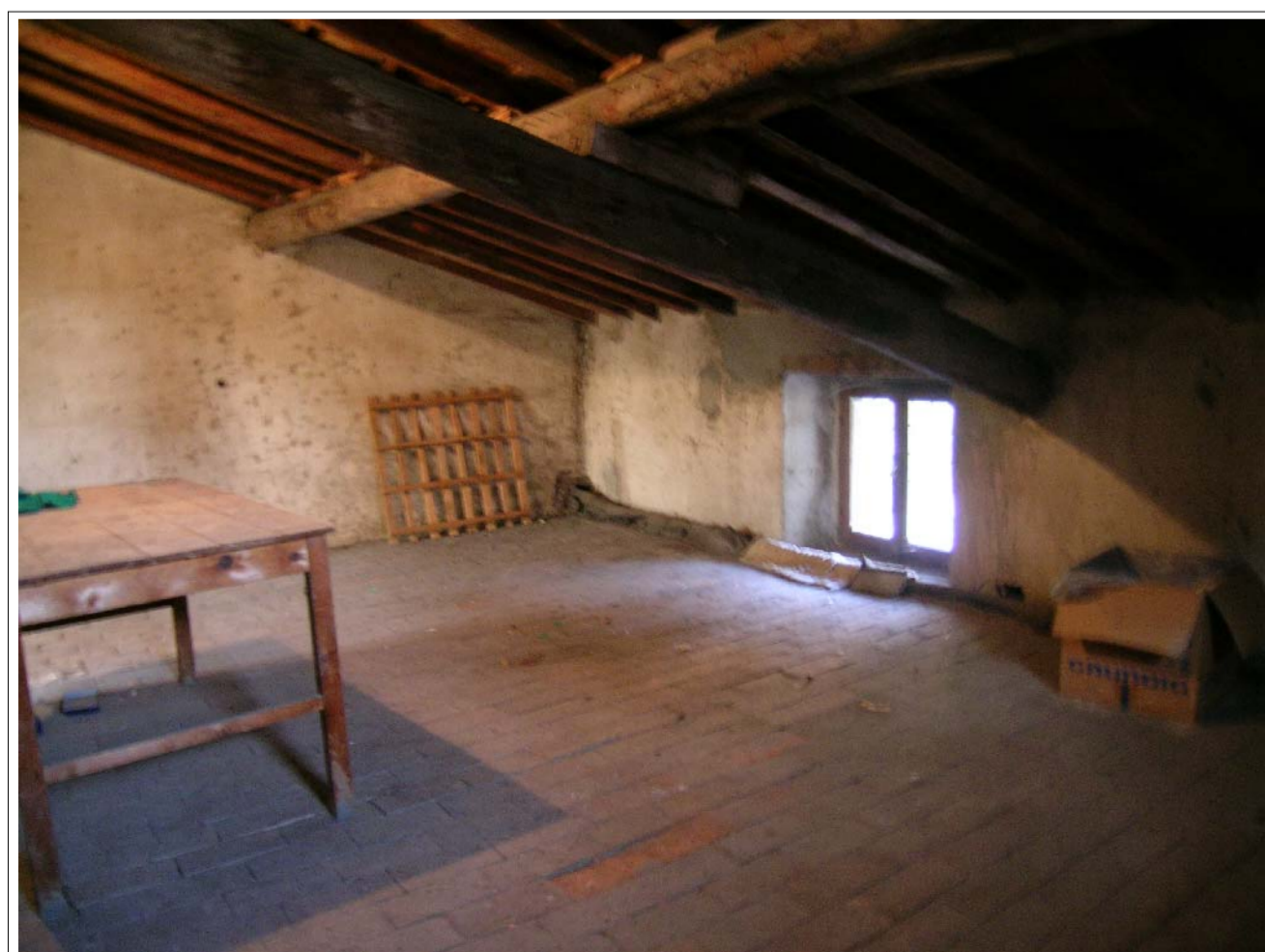
VISTA FOTOGRAFICA 5