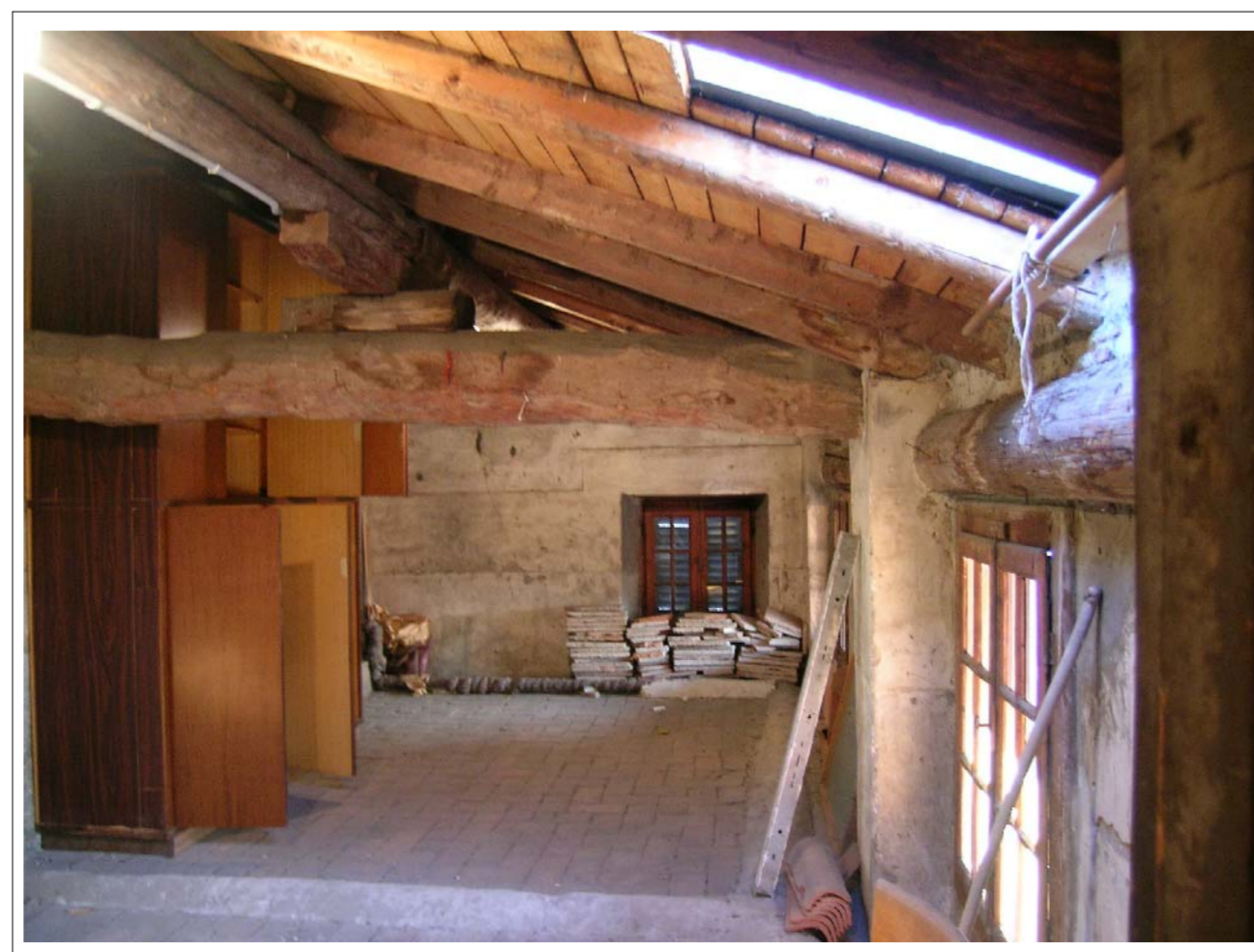
VISTA FOTOGRAFICA 6