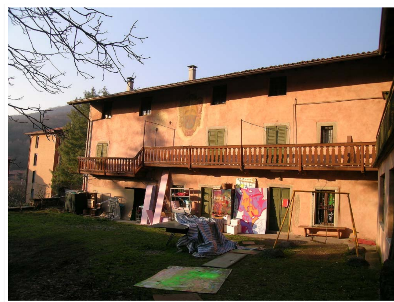
VISTA FOTOGRAFICA 4