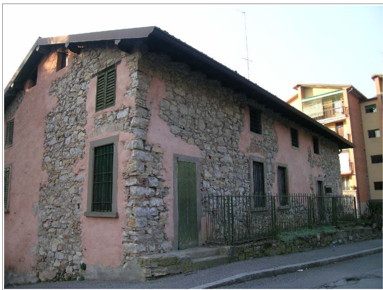
VISTA FOTOGRAFICA 3