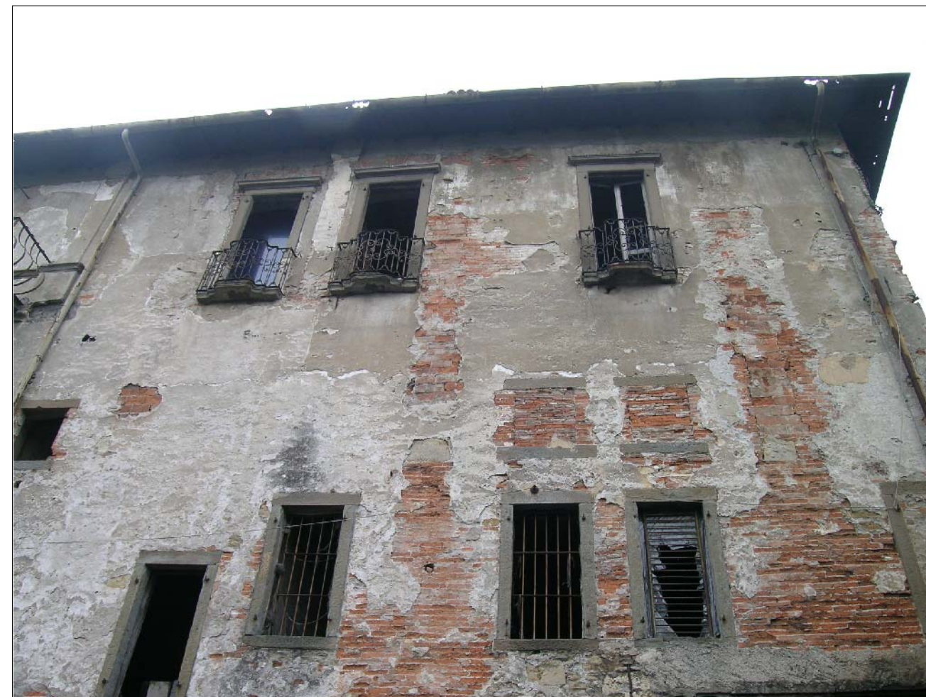
VISTA FOTOGRAFICA 4