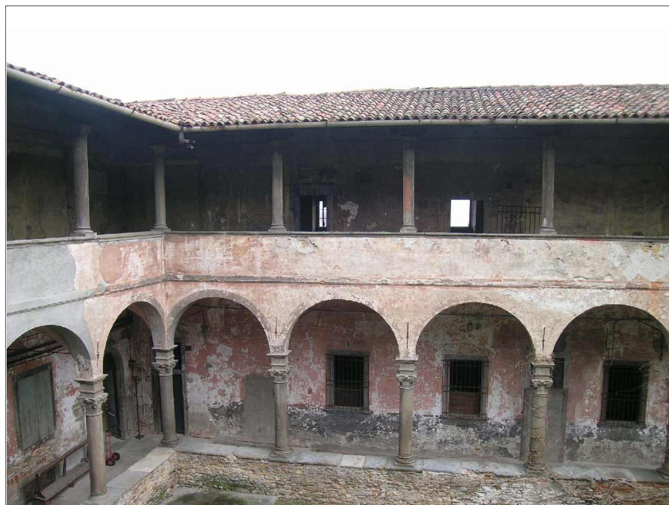
VISTA FOTOGRAFICA 5

ARCH. MASSIMO CASANOVA Progettista ARCH. GIANLUCA DELLA MEA Progettista GEOM. ROBERTO MADASCHI Collaboratore tecnico DOTT. NICOLA GHERARDI Collaboratore tecnico GEOM. PAOLA CEREA Collaboratore tecnico SIG.RA ANNA BRUCATO Collaboratore amministrativo