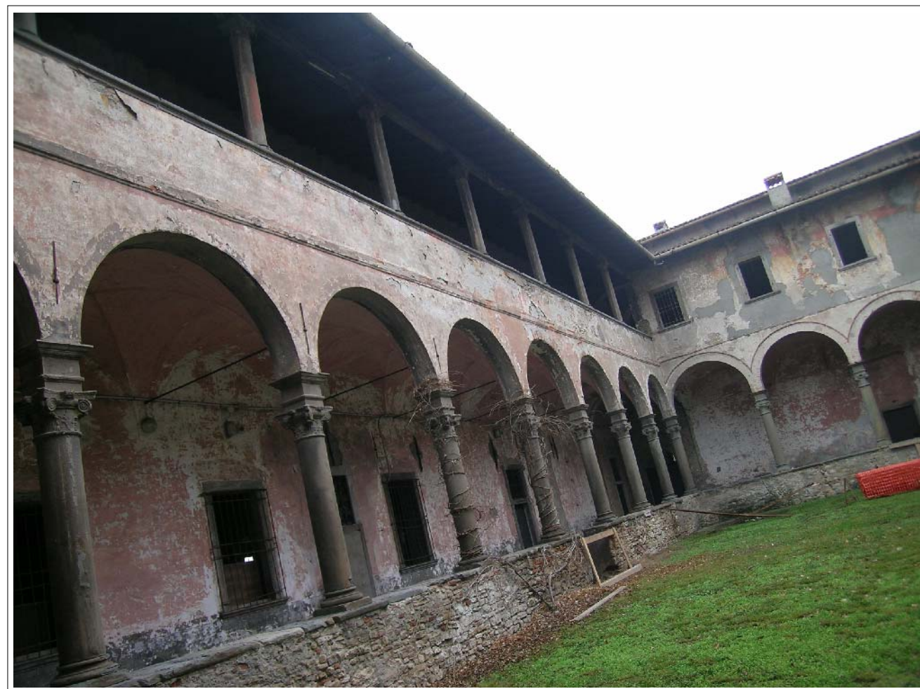
VISTA FOTOGRAFICA 3