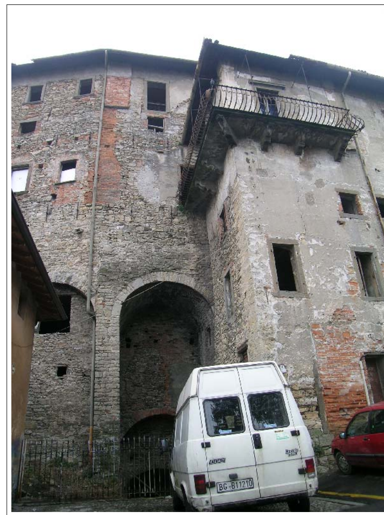
VISTA FOTOGRAFICA 2