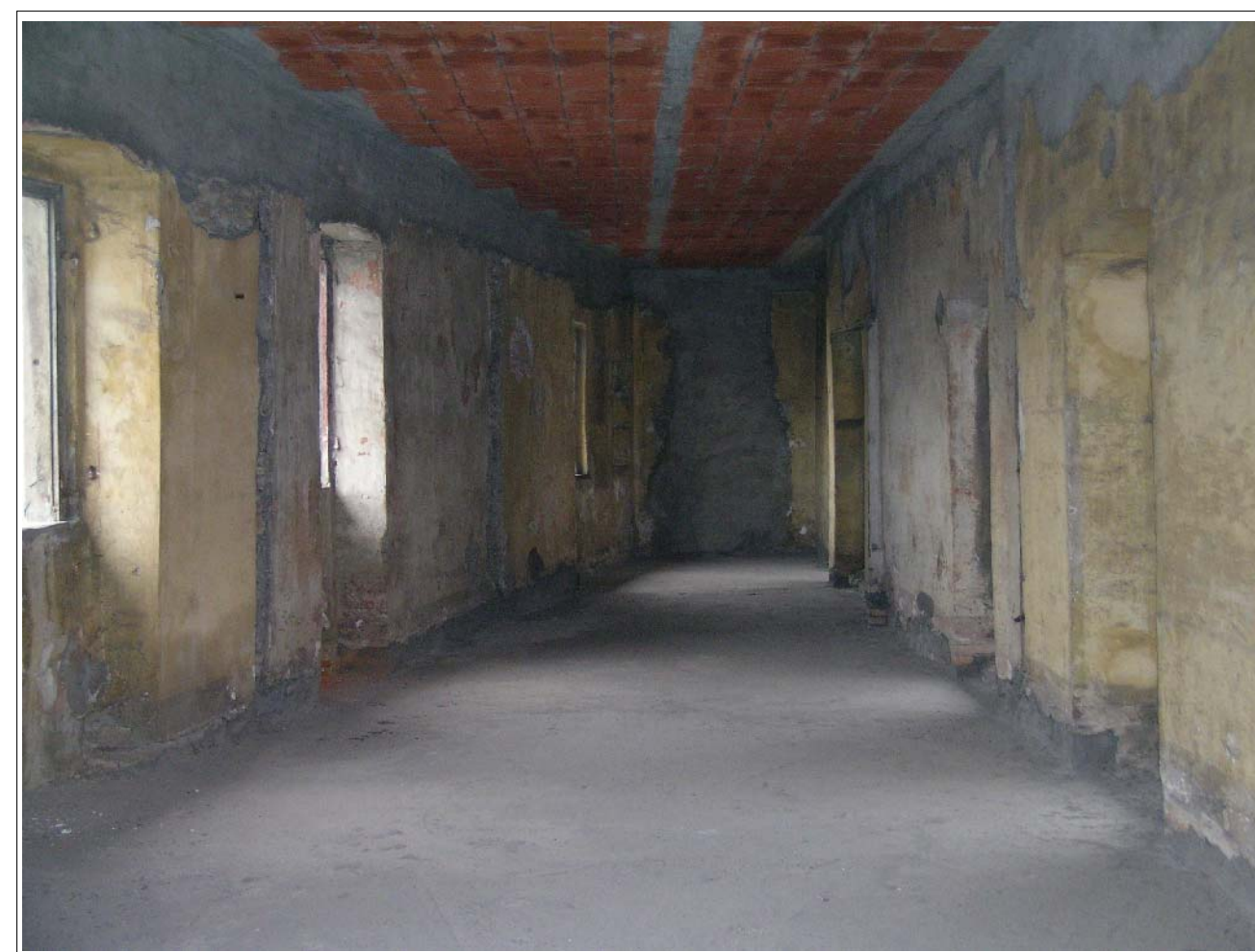
VISTA FOTOGRAFICA 6