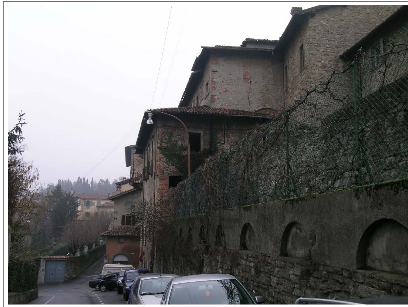
VISTA FOTOGRAFICA 1