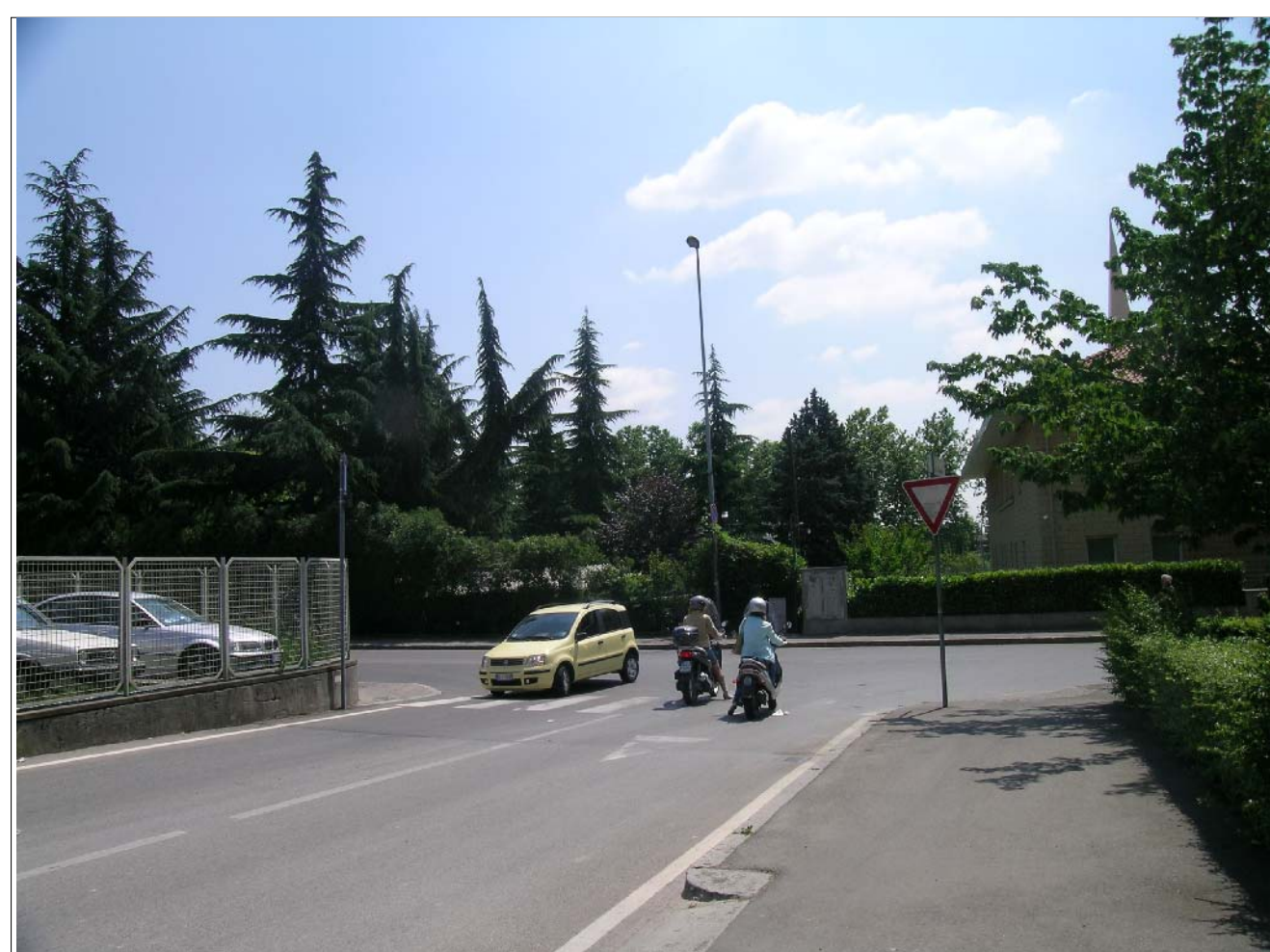
VISTA FOTOGRAFICA 3