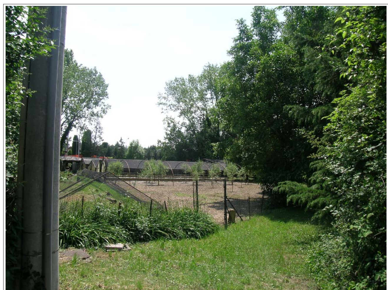
VISTA FOTOGRAFICA 5