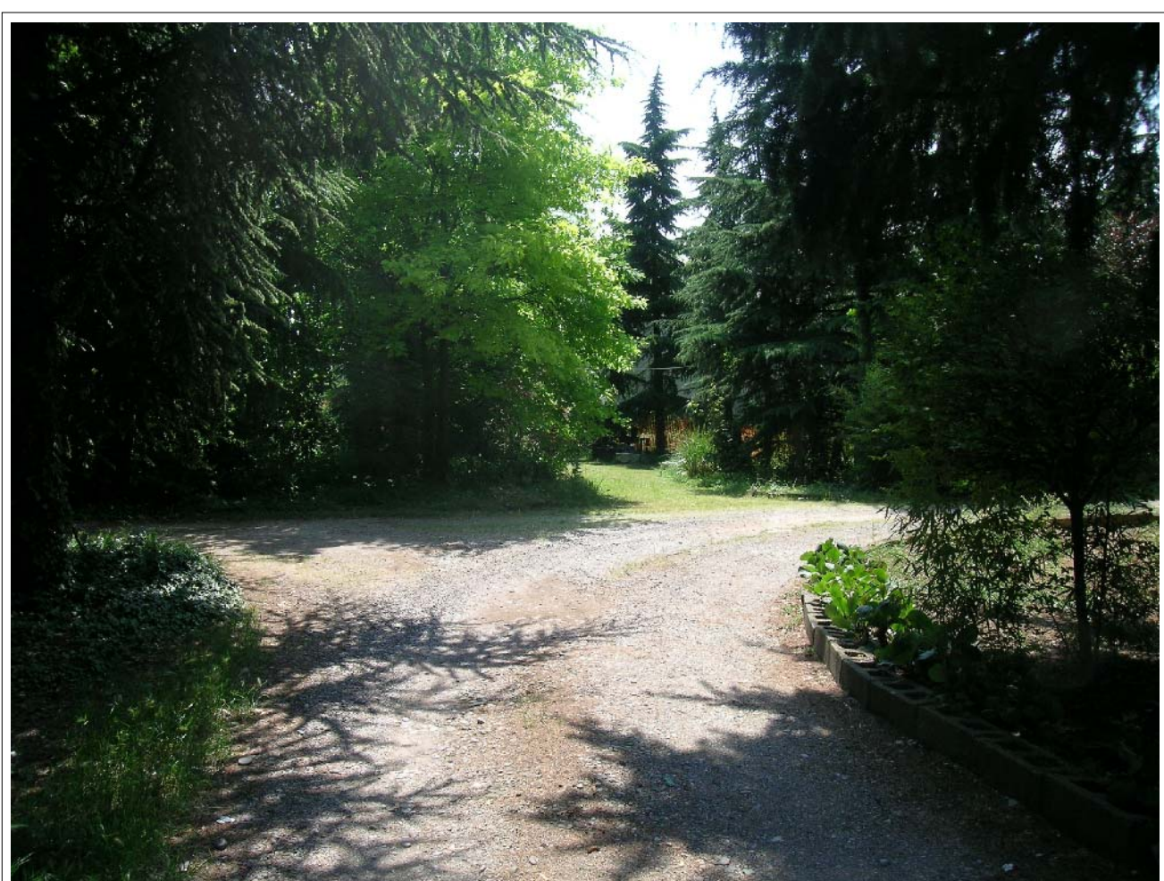
VISTA FOTOGRAFICA 6