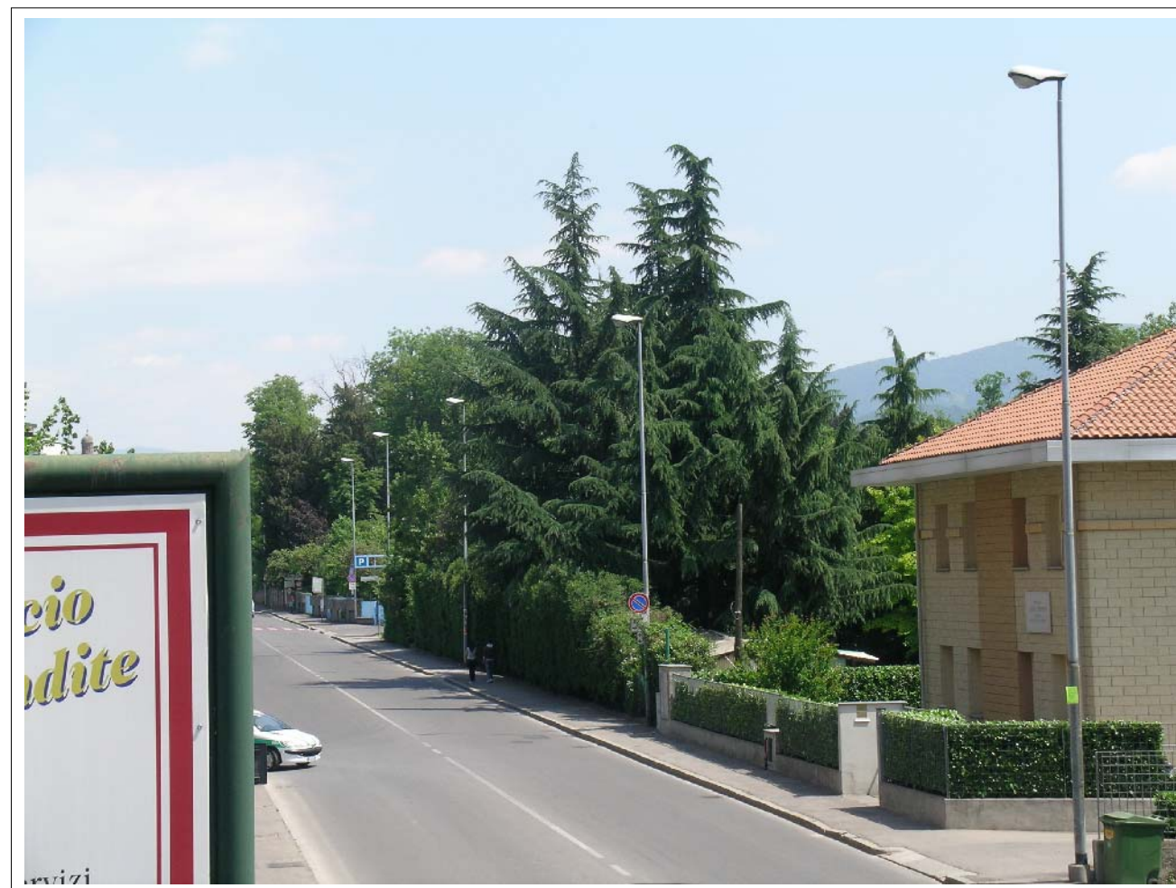
VISTA FOTOGRAFICA 2