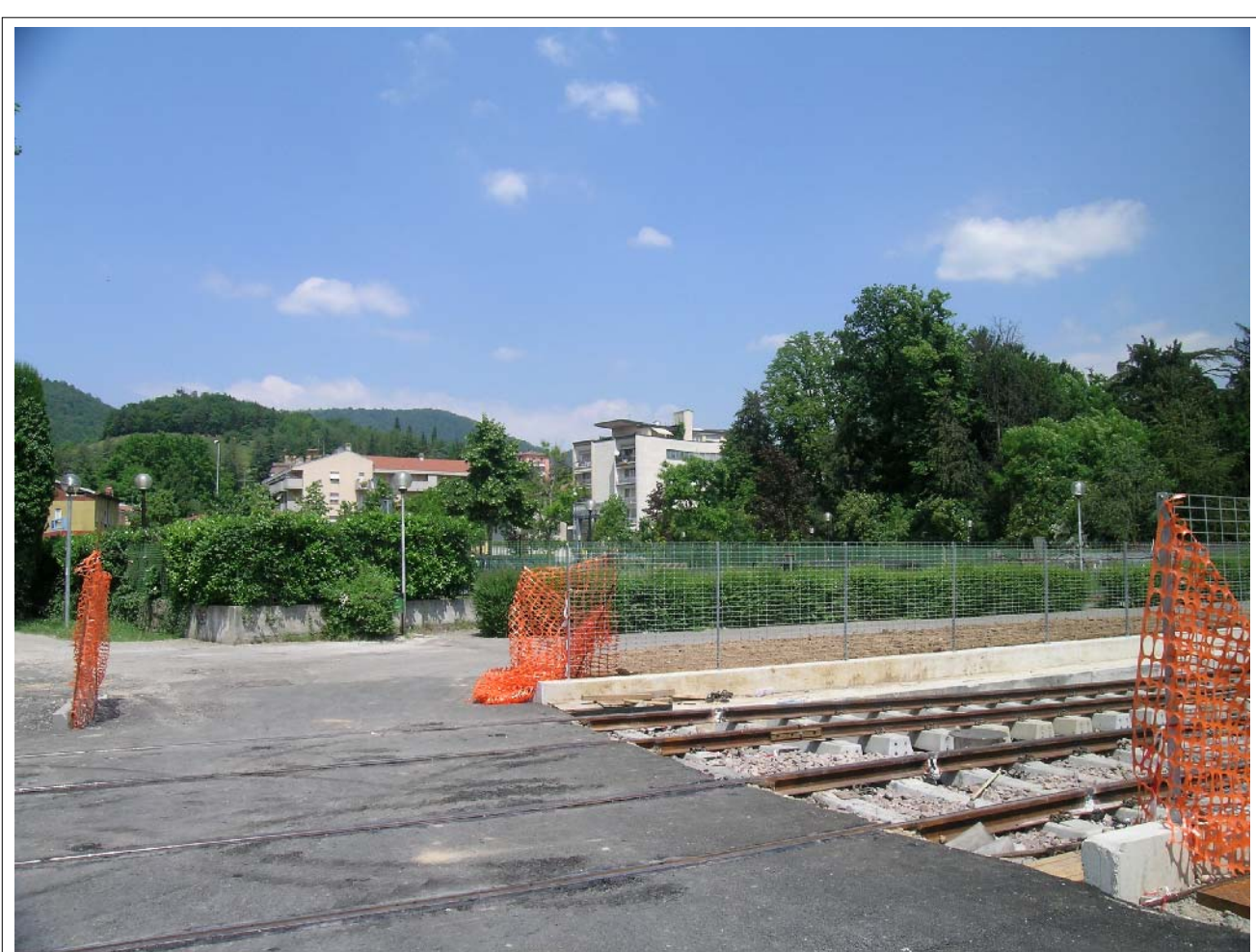
VISTA FOTOGRAFICA 4