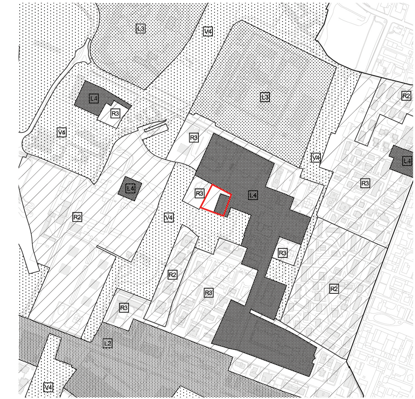
PROGETTO: LA STRUTTURA DI PIANO - I SISTEMI - SCALA 1:5.000