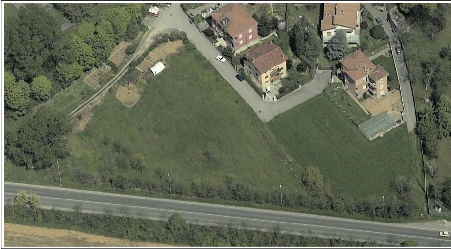
VISTA FOTOGRAFICA 1