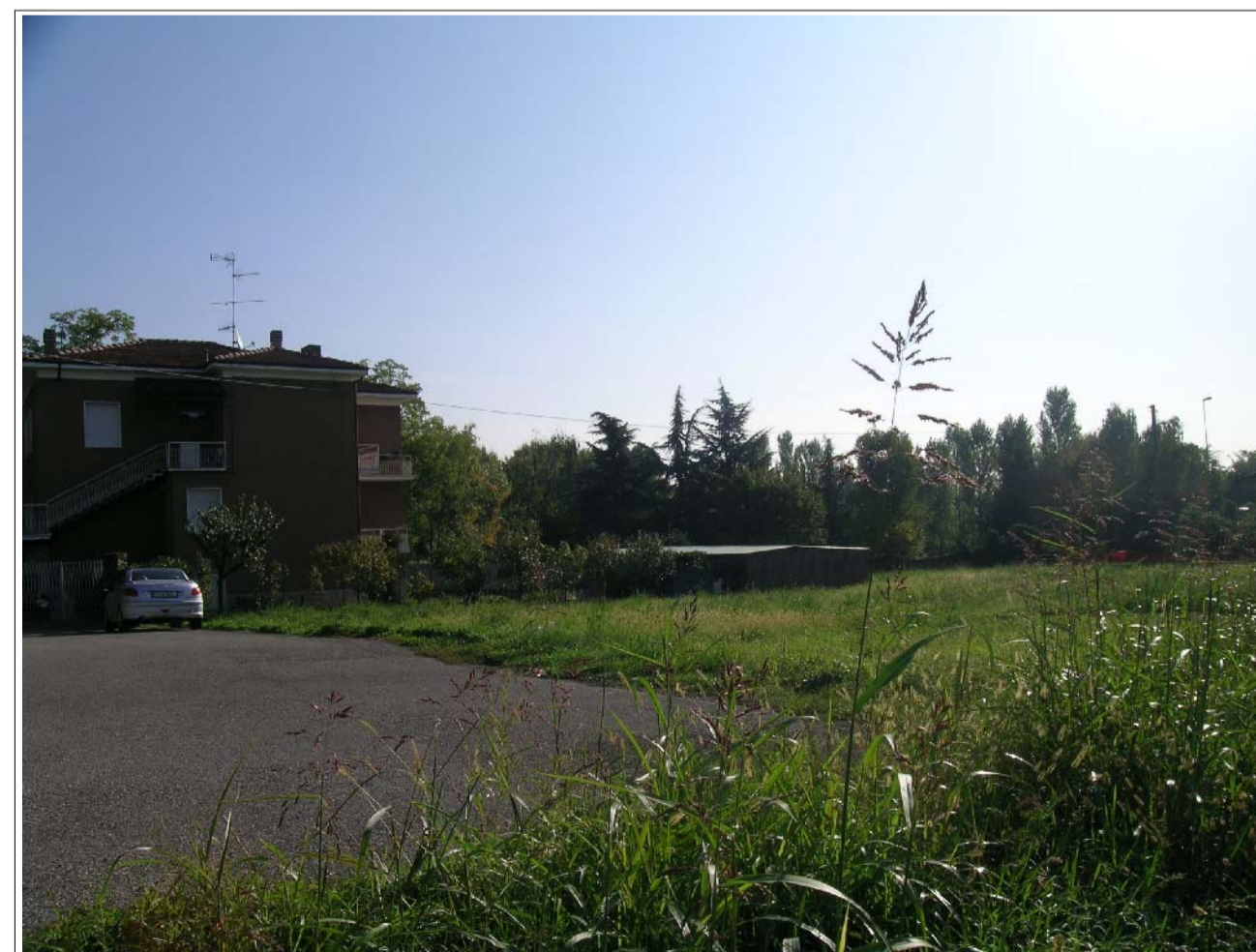
VISTA FOTOGRAFICA 6