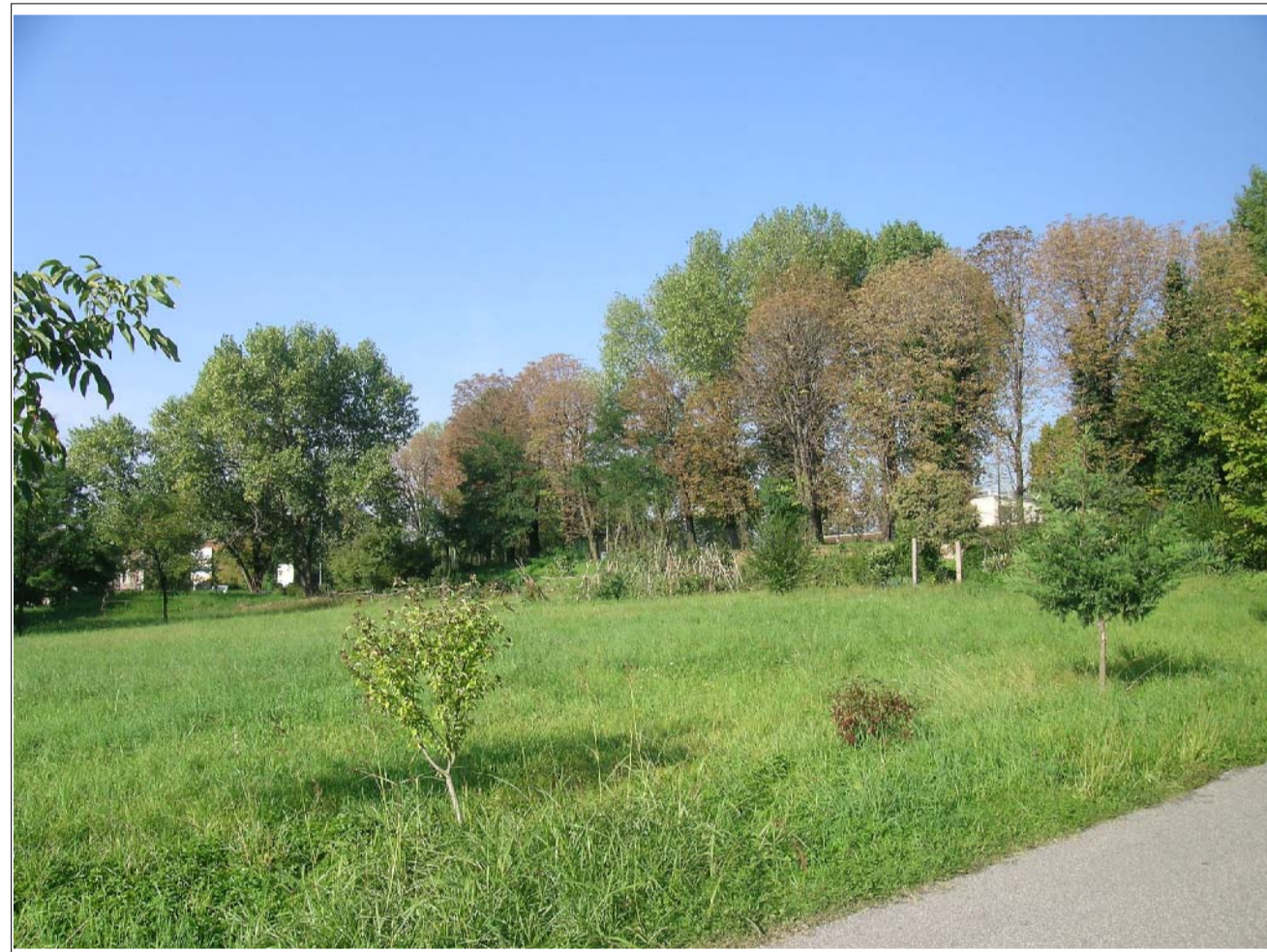
VISTA FOTOGRAFICA 3