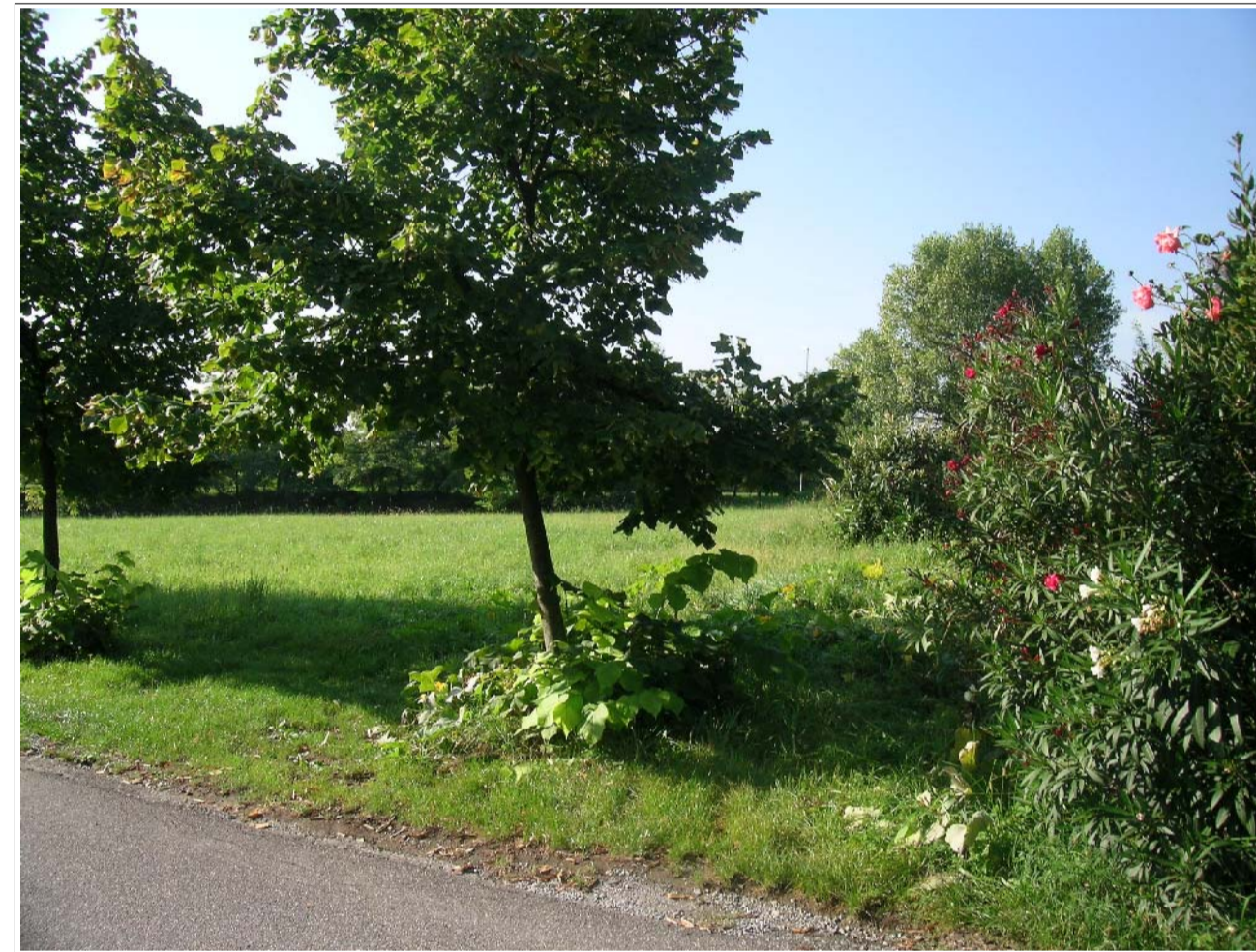
VISTA FOTOGRAFICA 4