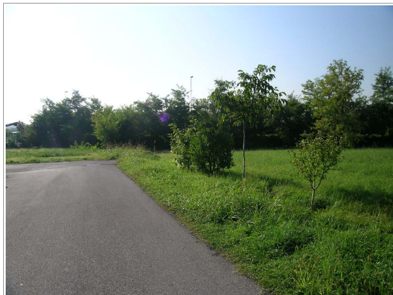
VISTA FOTOGRAFICA 5