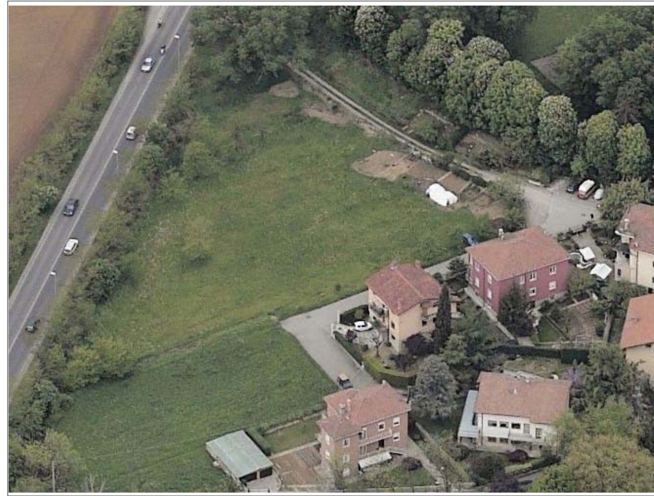
VISTA FOTOGRAFICA 2