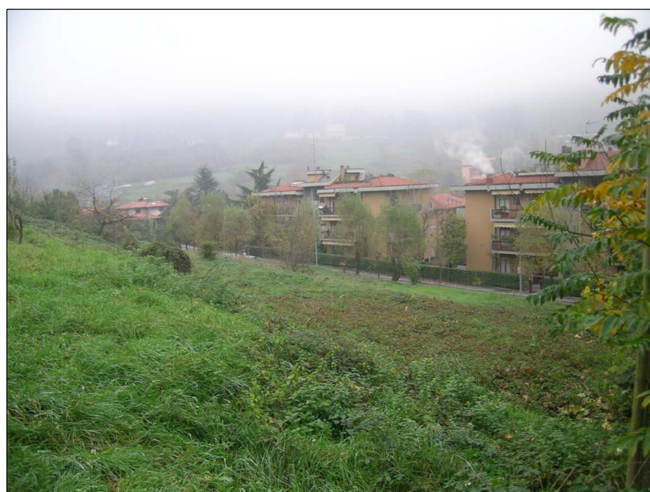
VISTA FOTOGRAFICA 6