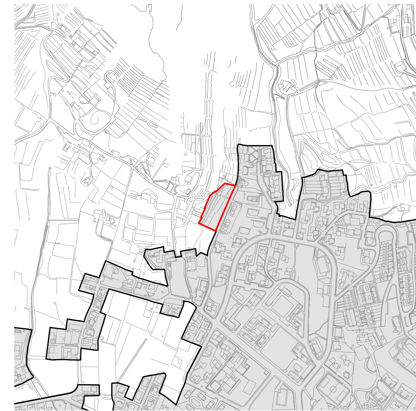
PERIMETRAZIONE CENTRO EDIFICATO - SCALA 1:5.000