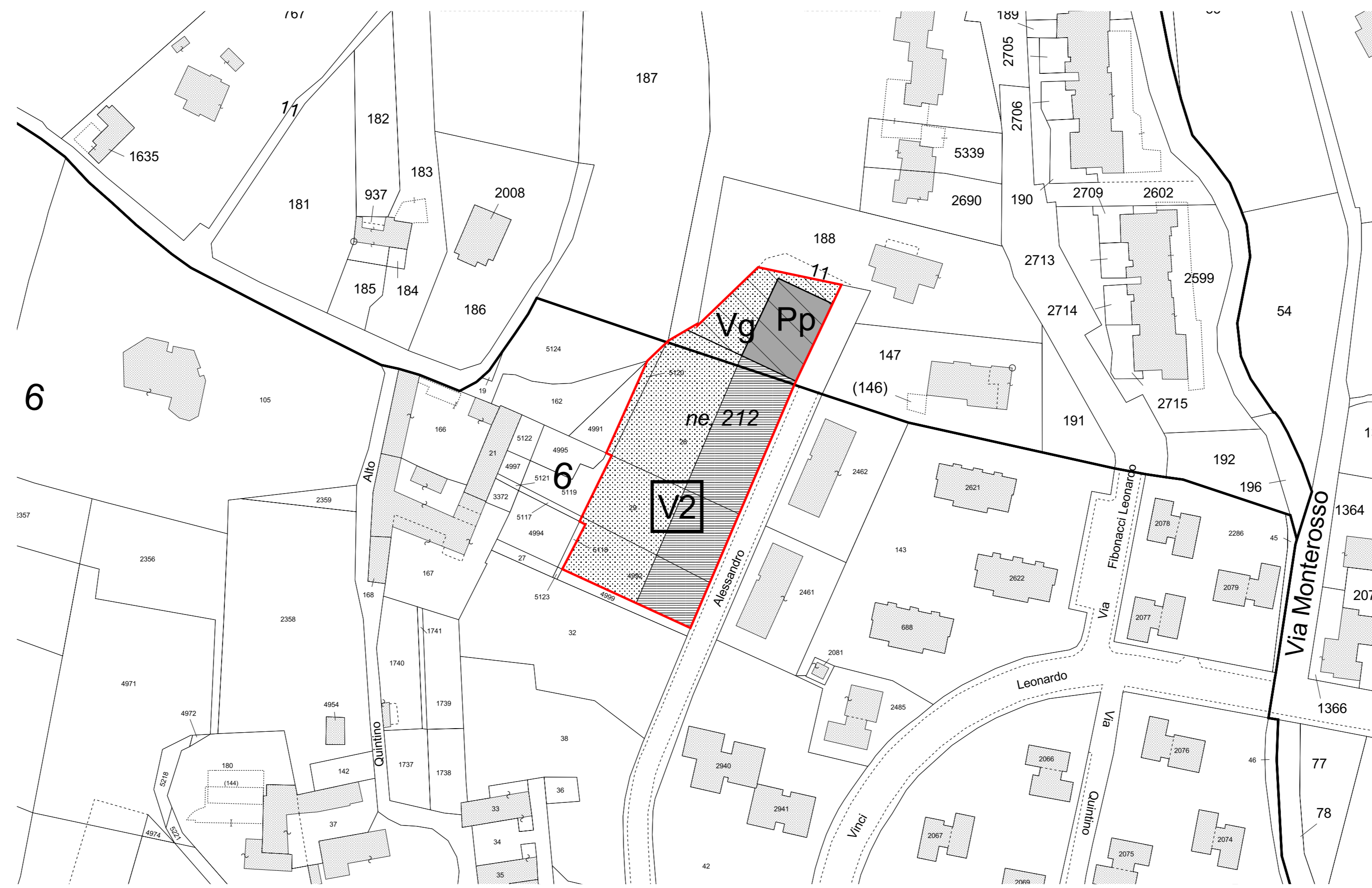
PROGETTO: USI DEL SUOLO E MODALITA' DI INTERVENTO - SCALA 1:1.000