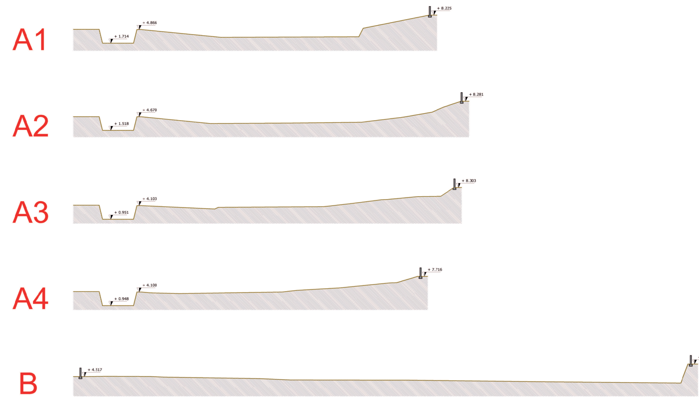
STATO DI FATTO - Andamento naturale del Terreno Sezioni Ambientali _ Scala 1:500