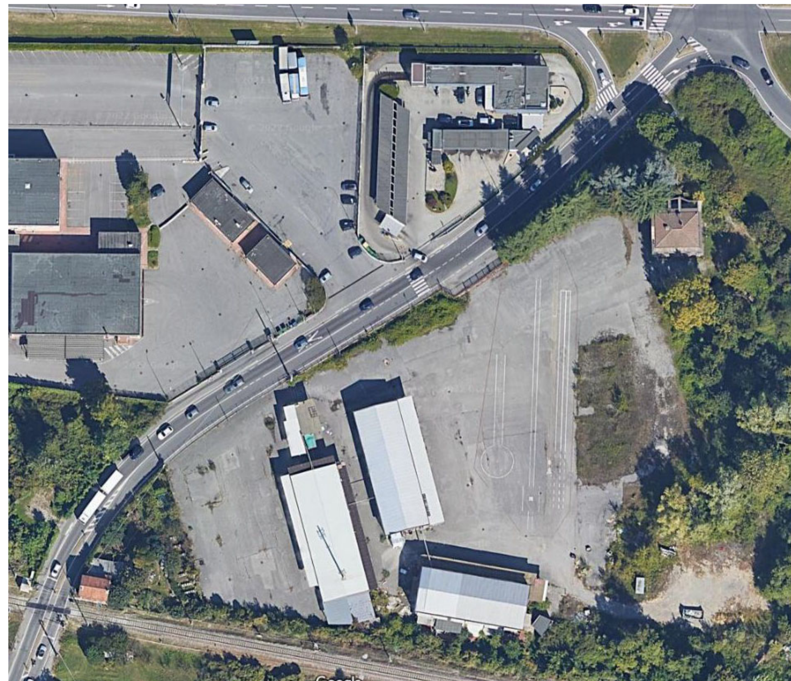
ORTOFOTO STATO DI FATTO