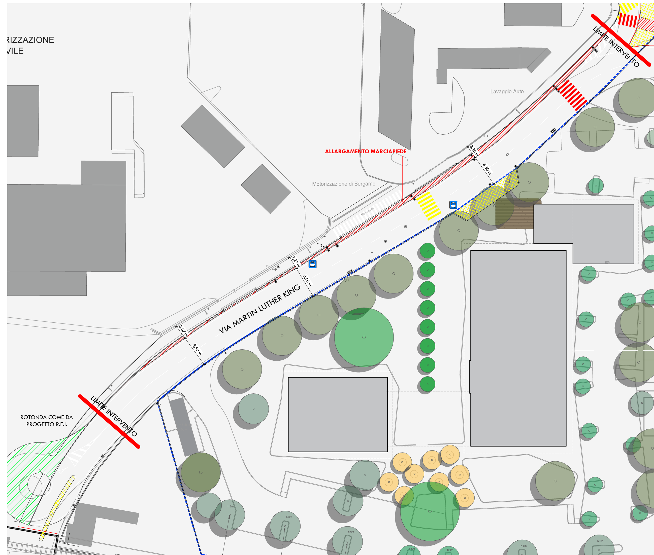
PLANIMETRIA DI PROGETTO