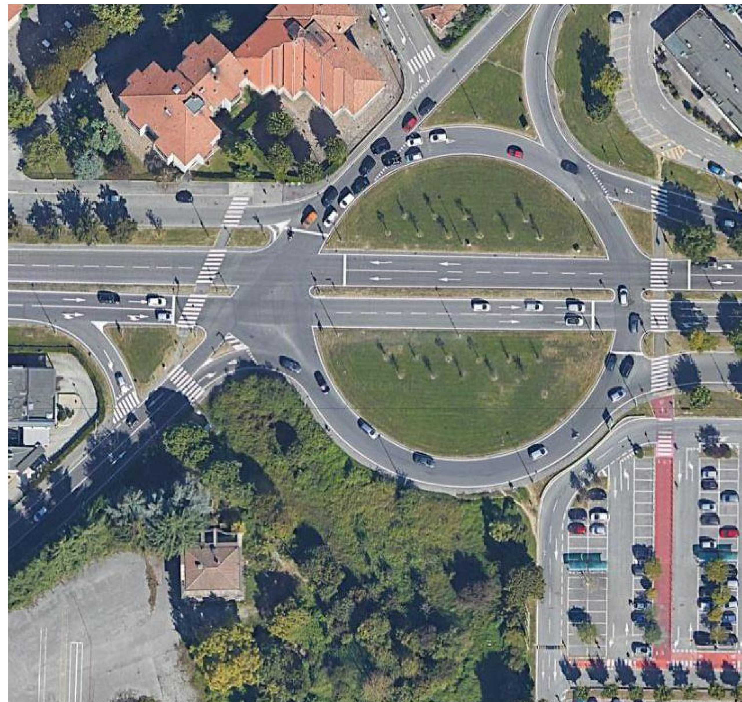
ORTOFOTO STATO DI FATTO