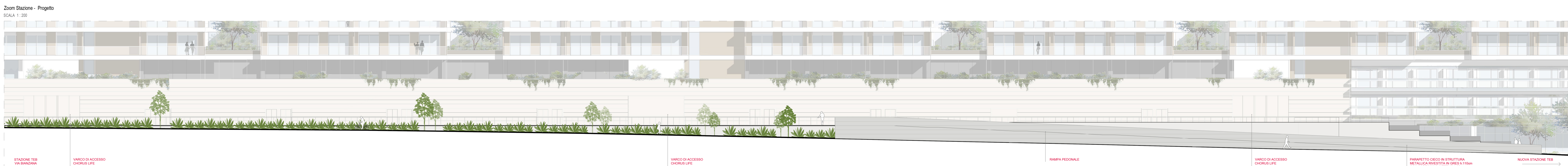
Zoom Stazione - Progetto SCALA 1:200